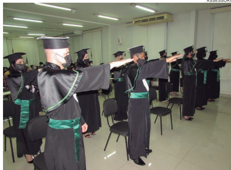
OS formandos fizeram o Juramento da Enfermagem, durante a cerimônia

“Eu terei orgulho em dizer que são meus colegas de trabalho. Vocês foram incríveis e nunca me esquecerei da nossa trajetória, de todos os momentos juntos. É uma alegria imensa