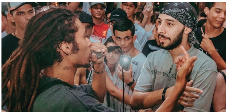
ENTRE as atrações, está a Batalha das Ideias, Capoeira (Afoxé), Bigz, Coddre, Ibatorá e DJ CR. A entrada custa simbólicos R$ 5

Promover a inclusão socio-cultural e celebrar as raízes afro-brasileiras motivam a iniciativa. “As manifestações artísticas que sempre fizeram parte da construção do povo preto clamam por mais representatividade e o festival surge em torno desse conceito”, complementa.