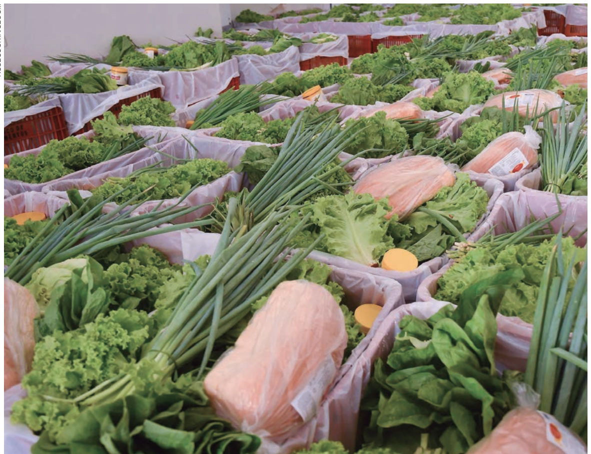
UM dos mais importantes programas de alimentação do Brasil, o Banco de Alimentos é uma extensão da Secretaria Municipal de Agricultura e Meio Ambiente

Um dos mais importantes programas de alimentação do Brasil, o Banco de Alimentos é uma extensão da Secretaria Municipal de Agricultura e Meio Ambiente. “A partir da segunda quinzena de janeiro de 2022 serão realizadas novas avaliações e atualizações dos cadastros já existentes. Para tanto, o Banco