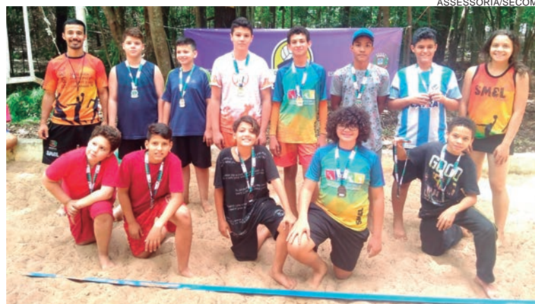
A competição teve a primeira etapa dias 20 e 21 de novembro e a segunda aconteceu no último final de semana nas quadras do Bosque Uirapuru

Dentro do Smel Verão, entre terça e ontem (quarta-feira) ocorreu o encerramento das atividades do Projeto Vida Ativa Melhor Idade em 2021. As atividades esportivas e de lazer retornam em 22 de janeiro. Veja como ficou a classificação da segunda etapa do Circuito de Vôlei de Areia.