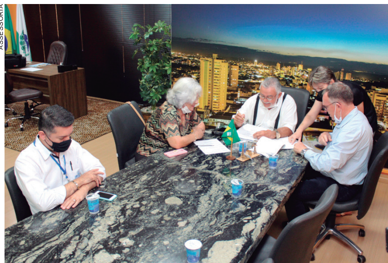
O presidente da Aciu ligou para os contemplados e notou reações adversas. “A maioria reluta em acreditar que ganhou um prêmio tão valioso”, disse