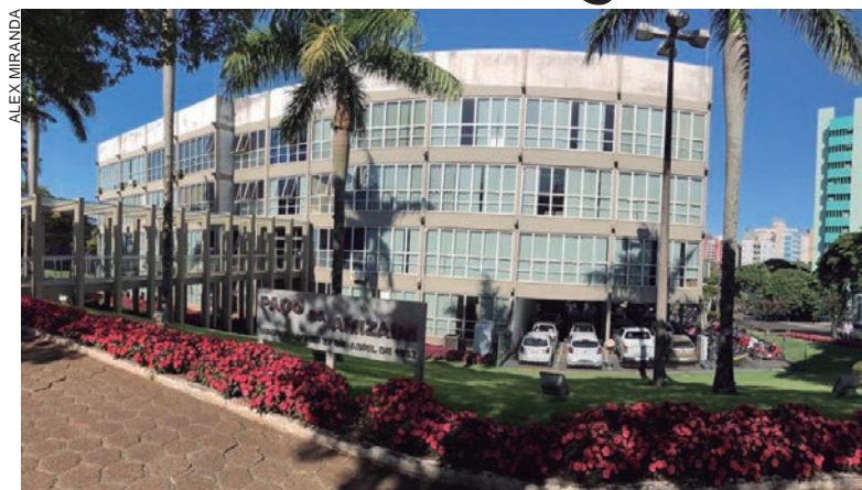
A proibição é imposta pela Lei das Eleições para evitar o uso da máquina e de recursos públicos por agentes políticos para alavancar eventuais candidaturas em 2022

Com base na exceção permitida pela legislação, as localidades dos estados da Bahia e de Minas Gerais que foram atingidas pelas fortes chuvas nos últimos dias, por exemplo, ainda poderão prestar assistência material aos desabrigados se houver