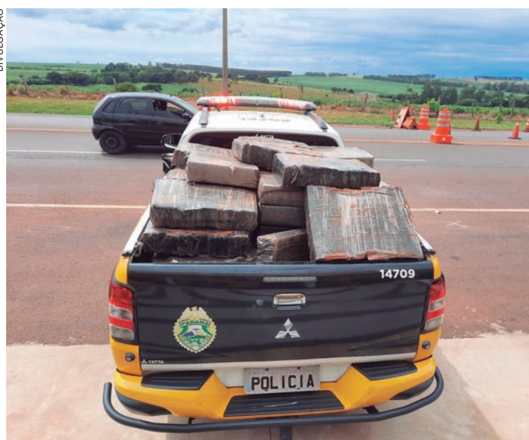
DEZENAS de fardos de maconha estavam armazenadas em fundo falso na carroceria do caminhão

A carga, segundo os policiais, está avaliada em mais de R$ 1 milhão e foi levada para