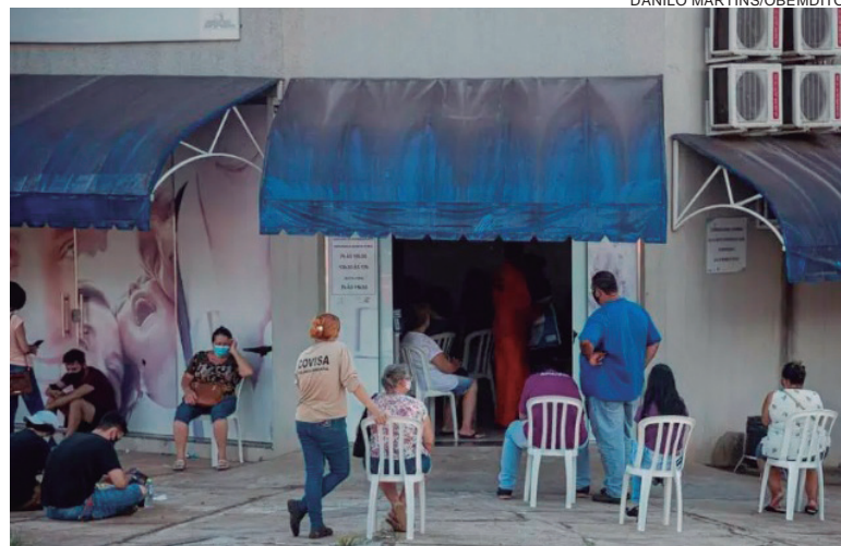
HOUE aumento na procura pela Tenda da Covid, que estava em local improvisado

da Secretaria Municipal de Saúde, na segunda (3) foram realizadas 176 consultas e 106 coletas para testes RT-PCR e na terça (4) foram 217 consultas e 92 coletas. “Como deixamos o Centro Diocesano e atendemos no antigo Posto Central, na avenida Rio Grande do Norte, o local ficou pequeno para tanta demanda. Desta forma o prefeito Hermes Pimentel nos instruiu a imediatamente tomarmos uma providência. As adaptações foram iniciadas