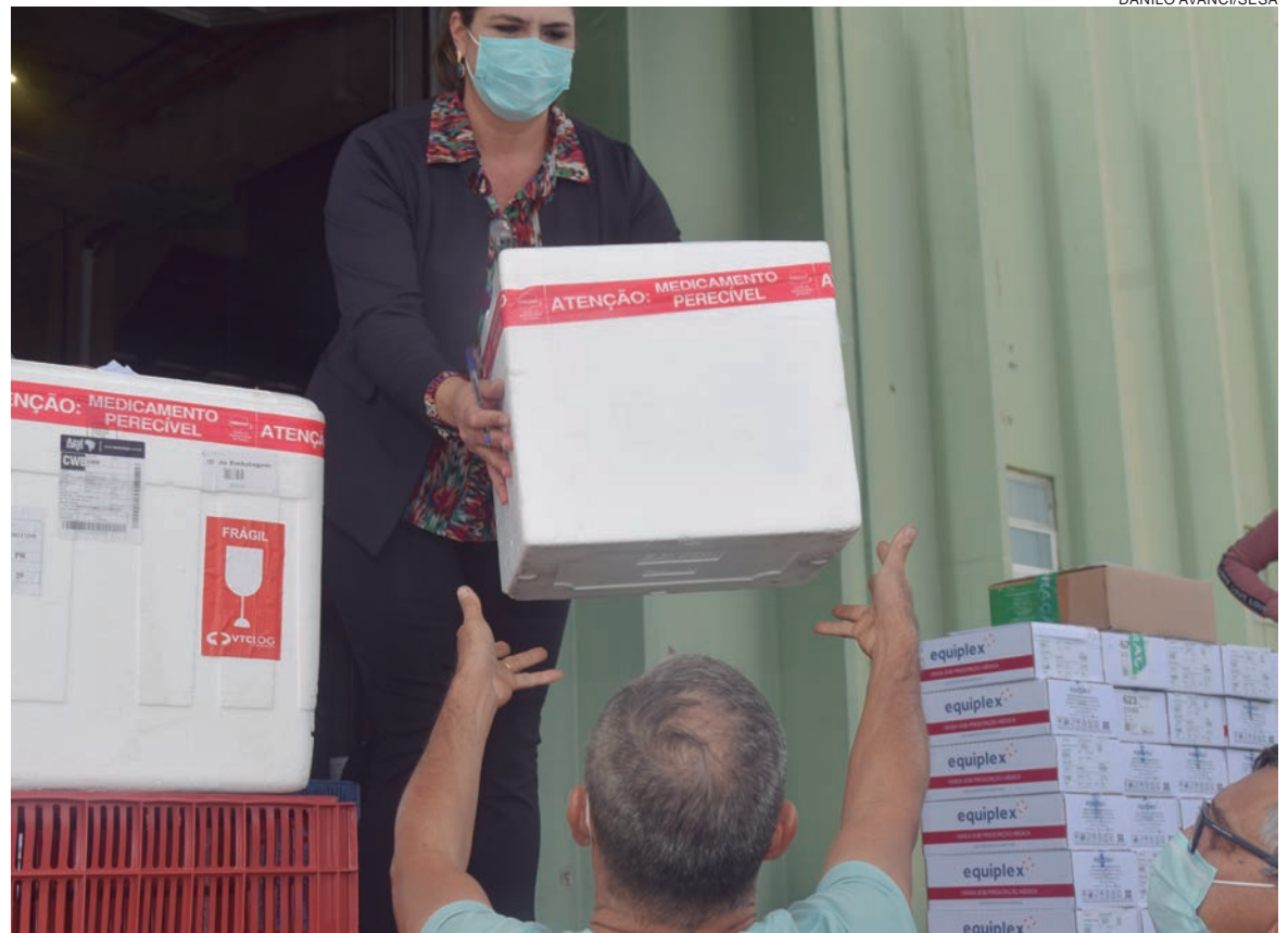
A 12ª Regional de Saúde recebe 9.006 doses da vacina Pfizer, destinadas à primeira e segunda doses e para dose de reforço

Na sexta, a Saúde já havia distribuído outras 377 mil vacinas contra a covid-19, na primeira entrega de 2022.