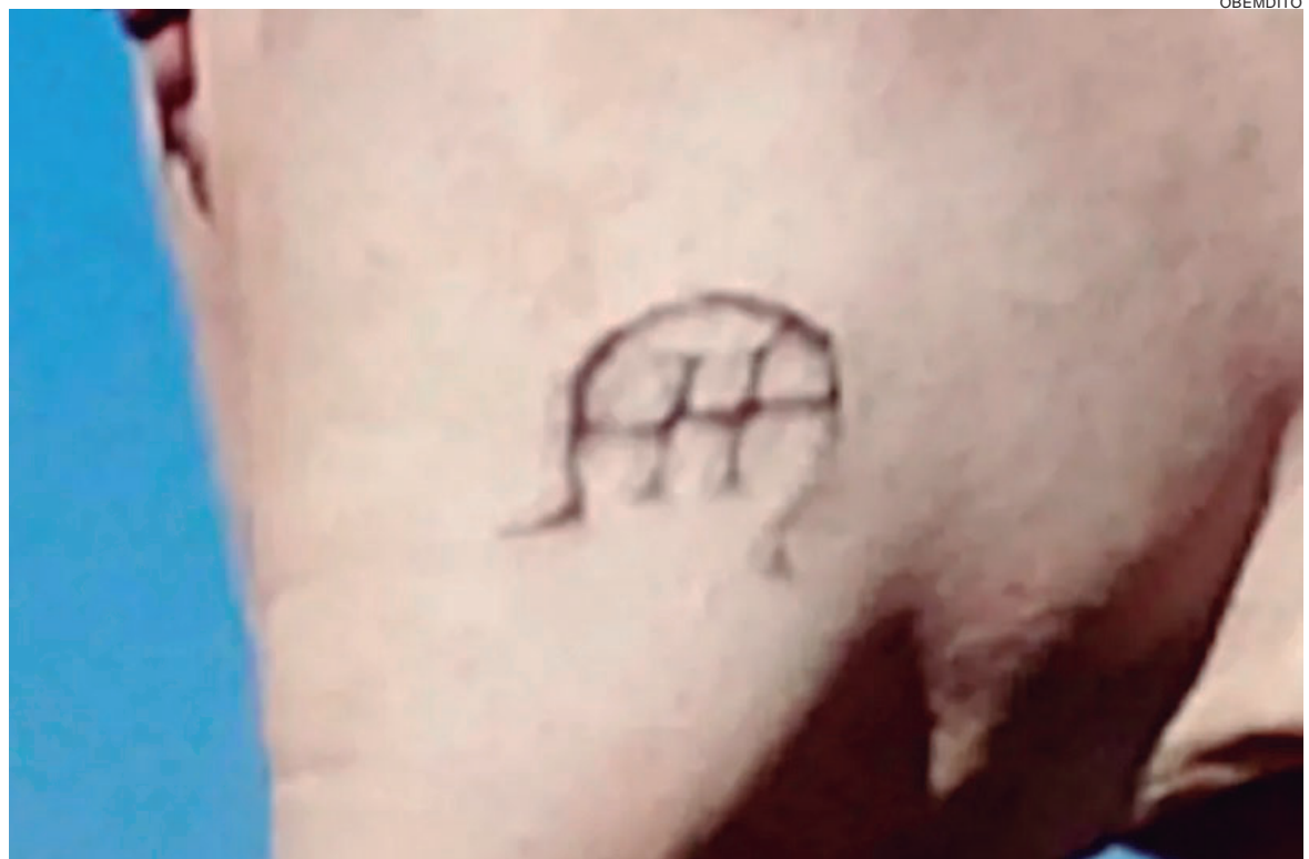
OS animais levados possuem a marca de uma ferradura com a letra 'H' no meio

O proprietário pede informações sobre o paradeiro dos animais e o contato com a