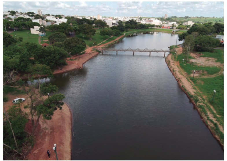
A recuperação do Lago Aratimbó foi uma das primeiras ações do prefeito Hermes Pimentel, que assumiu a Prefeitura em setembro do ano passado

A recuperação do Lago Aratimbó foi uma das primeiras ações do prefeito Hermes Pimentel, que assumiu a Prefeitura em setembro do ano passado. “Isso aqui estava abandonado, assoreado e com muita sujeira. A limpeza retirou centenas de toneladas de areia e resíduos que cobriam grande parte da lâmina d’água. Hoje lago recuperou sua exuberância e nas próximas semanas vamos deixar o local ainda