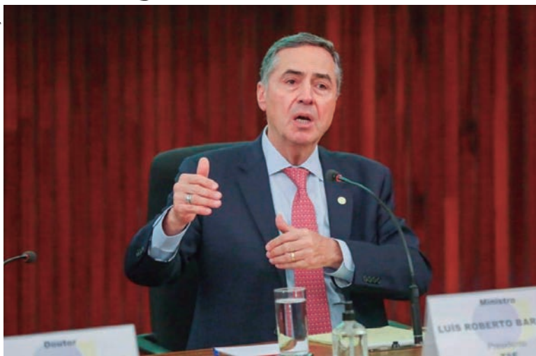
SEGUNDO Barroso, pela nova lei, dois ou mais partidos podem se unir em uma federação, que depende de registro no TSE

Pela nova lei, dois ou mais partidos podem se unir em uma federação, que depende de registro no Tribunal Superior Eleitoral (TSE). Trata-se de uma aliança eleitoral semelhante à das