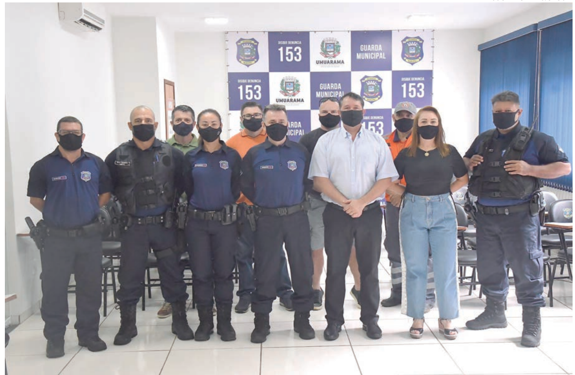
GUARDA Municipal manteve-se em processo de melhorias constantes, profissionalizando sua atuação e aperfeiçoando seu atendimento à população

Em segundo lugar estão as abordagens para averiguação de suspeitos, com 38 registros e em terceiro lugar as solicitações de atendimento em que o cidadão sentiu-se, de alguma forma, ofendido por drogaditos, mendigos, bêbados ou andarilhos, com 34 ocorrências. Em quarto lugar foram os relatos de fios de energia rompidos, com 27 indicações e em quinto lugar ficaram as denúncias de perturbação de sossego, com 10 chamados.