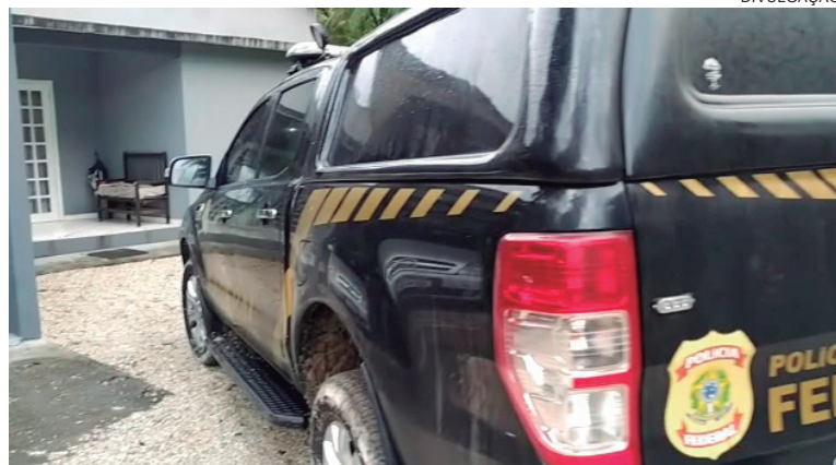
PF desarticula organização criminosa que lavou R$ 4 bilhões, com ramificações na região

A Operação Fluxo Capital, por sua vez, tem por objetivo dismantlar organização criminosa responsável pela lavagem do dinheiro por meio de movimentações milionárias, com a utilização de "laranjas", empresas de fachada e contadores. As investigações demonstraram que o grupo não se limitava à lavagem do dinheiro do traficante investigado na Operação Spectrum. A organização também mantinha relação com diversas outras organizações criminosas atuantes em território nacional, envolvidas em outros delitos além do tráfico de drogas.