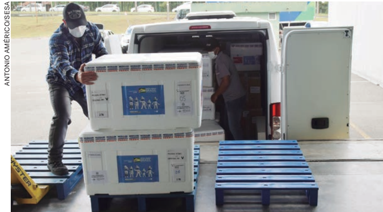
AS vacinas são, em maioria, para dose de reforço; 1ª dose em crianças de 5 a 11 anos; 2ª dose para a população acima de 12 anos e 1ª dose também acima de 12 anos

As vacinas são, em sua maioria, para dose de reforço (322.287); primeira dose em crianças de 5 a 11 anos (256.880); segunda dose para a população acima de 12 anos (58.565); e primeira dose também acima de 12 anos (23.610). Também há um quantitativo para D1, D2 e DR, segundo a solicitação dos municípios (25.542).