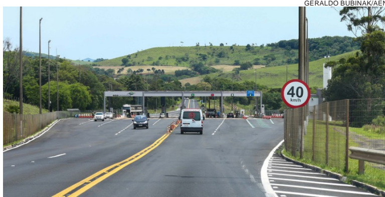
PEDIDO é embasado na mudança de modelo econômico e ausência de projetos técnicos das obras e de estudos com os valores das desapropriações

Sobre a modelagem, na apresentação de fevereiro de 2021, o Governo Federal apresentou um modelo híbrido de concessão onerosa, porém, em agosto, o Ministério da Infraestrutura apresentou uma