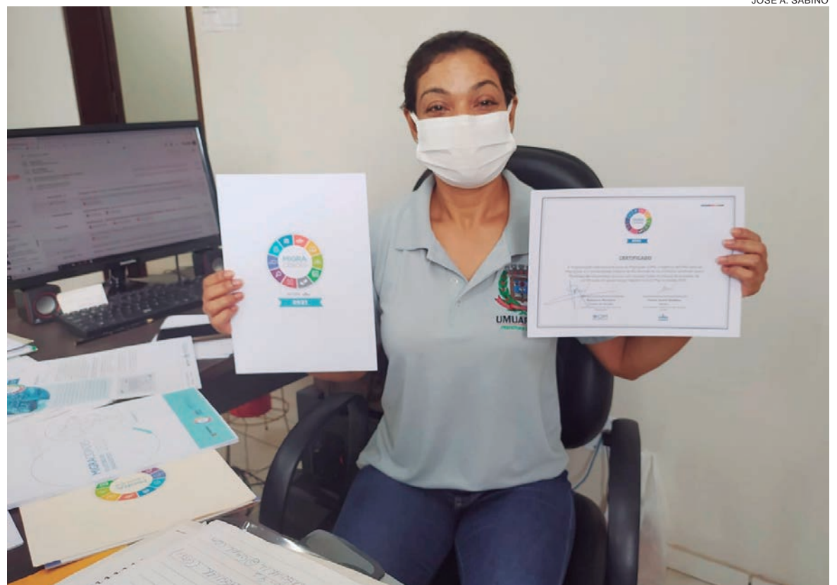
O selo é parte do processo de certificação que aprimora a governança migratória local no Brasil e foi entregue aos gestores que cumprem todas as etapas do processo

De janeiro de 2000 a junho de 2021, 656 migrantes obtiveram o Registro Nacional Migratório como habitantes do município, de acordo com dados do sistema de registro (Sismigra) da Polícia Federal. Conforme a equipe da Cáritas, atualmente cerca