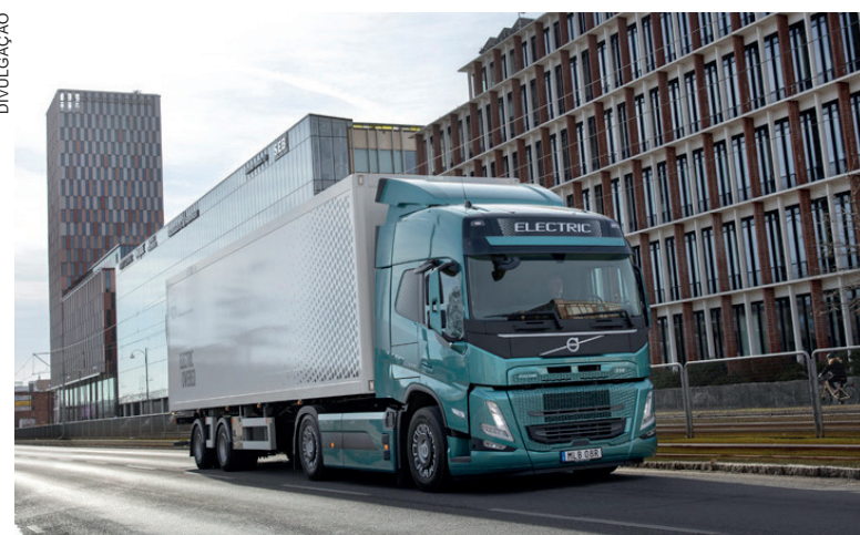
A Volvo Trucks é líder em caminhões pesados 100% elétricos na Europa, com 42% do mercado

A Volvo iniciou a produção em série de caminhões