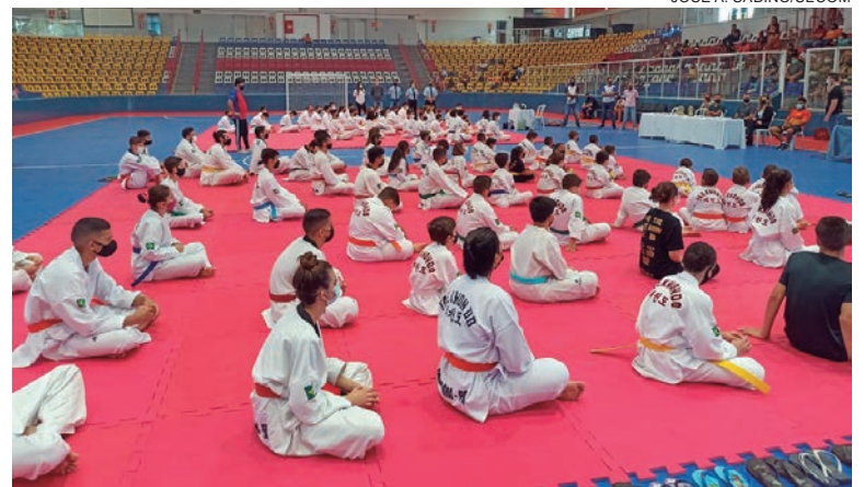
EVENTO coordenado pela Smel reuniu 131 atletas de quatro municípios, que representam seis academias e associações