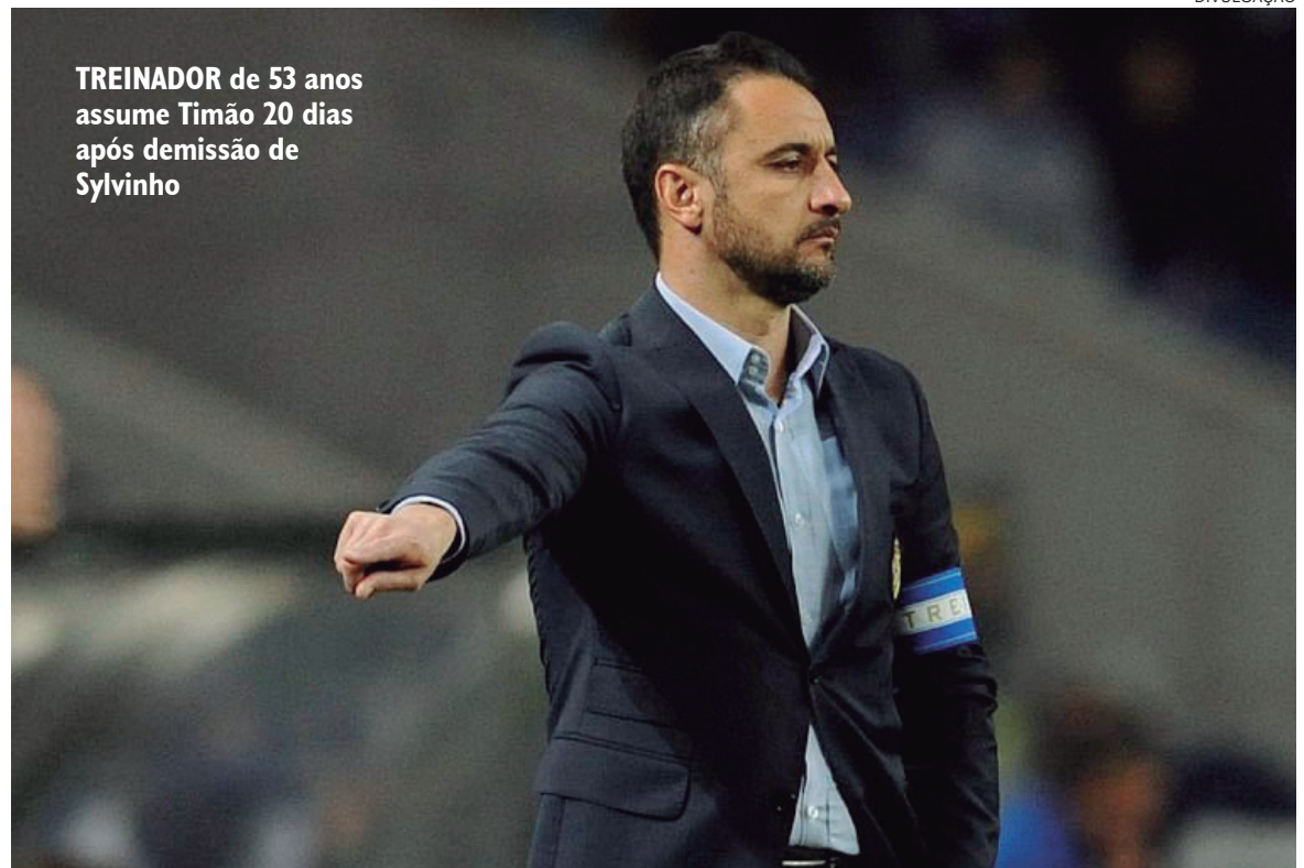
TREINADOR de 53 anos assume Timão 20 dias após demissão de Sylvinho

do Corinthians será neste domingo (27), às 11h (horário de Brasília), contra o Red Bull