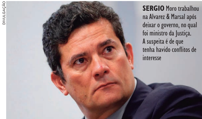
SERGIO Moro trabalhou na Alvarez & Marsal após deixar o governo, no qual foi ministro da Justiça. A suspeita é de que tenha havido conflitos de interesse

Sergio Moro trabalhou na Alvarez & Marsal após deixar