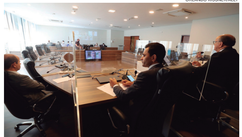
DE acordo com o relator, a matéria objetiva assegurar a liberdade de escolha do cidadão