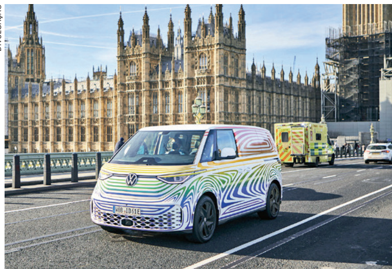
A Kombi elétrica (VW ID.BUZZ) passeou pela Europa antes da sua primeira aparição ao público, no dia 11 de março, em Austin (EUA)

Trazendo linhas de DNA da icônica Kombi de primeira geração (T1), o ID. BUZZ proporcionará uma experiência de condução ágil e dinâmica. Montado sobre a plataforma modular elétrica (MEB), ele oferecerá o máximo de área de carga e de passageiros, ocupando um espaço mínimo nas ruas. A lenda está de volta! Fique ligado para mais informações.