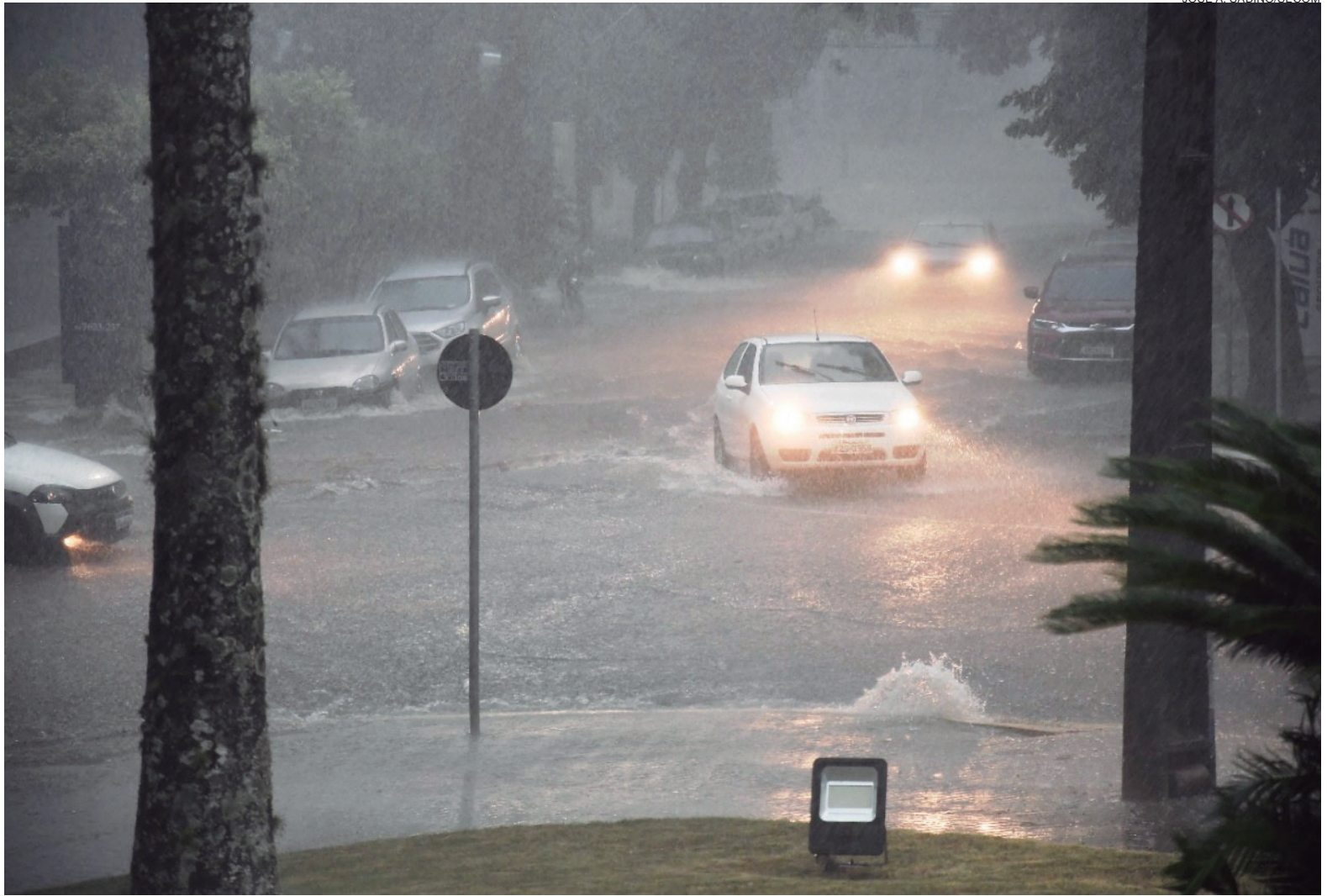
ESTA foto, feita de dentro do prédio da Prefeitura, na tarde do temporal mostra a rua Governador Ney Braga e os carros seguindo em direção à Praça Henio Romagnoli

Os alagamentos atingiram vários pontos da área central da cidade, com a água invadindo estabelecimentos comerciais e algumas residências. De acordo com a Secretaria Municipal de Obras, Planejamento Urbano e Projetos Técnicos, o grande volume acumulado de água em tão curto espaço de tempo, foi responsável por sobrecarregar o sistema de captação. “Mesmo com a manutenção de bueiros, poços de visita e galerias pluviais em dia – a Prefeitura conta com equipe própria e uma empresa contratada com caminhão equipado com água pressurizada e sugador de resíduos – o sistema não suportou o volume da chuva, inundando pontos