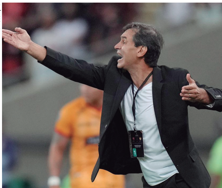
ARGENTINO foi eleito melhor treinador do Equador em 2019 e 2020