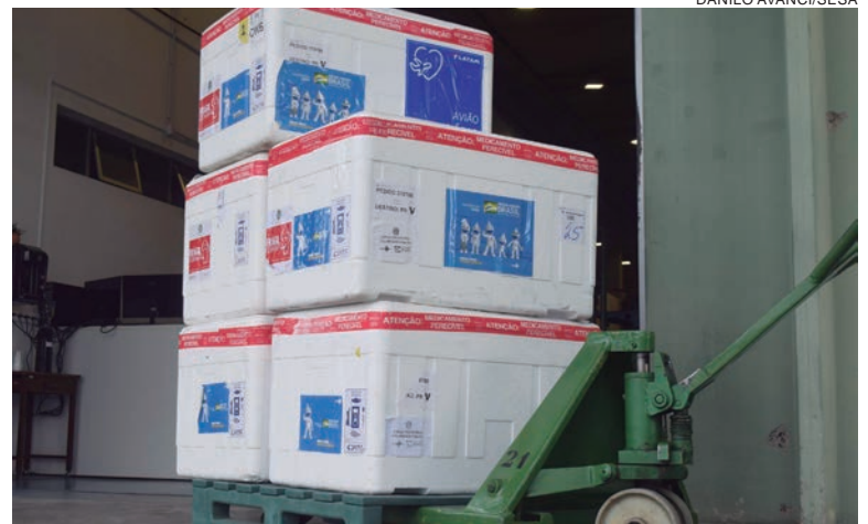
REGIONAL de Umuarama receberá doses pediátricas e doses de reforço contra a Covid-19

São 233.716 vacinas destinadas à D1 de adolescentes e crianças de 6 a 11 anos de idade. Para o público jovem (12 a 17) estão sendo enviadas aos municípios 44.286 vacinas da Pfizer e para o público infantil são 189.430 para o início do esquema vacinal. As doses para a D2 das crianças estão armazenadas e serão enviadas oportunamente, para