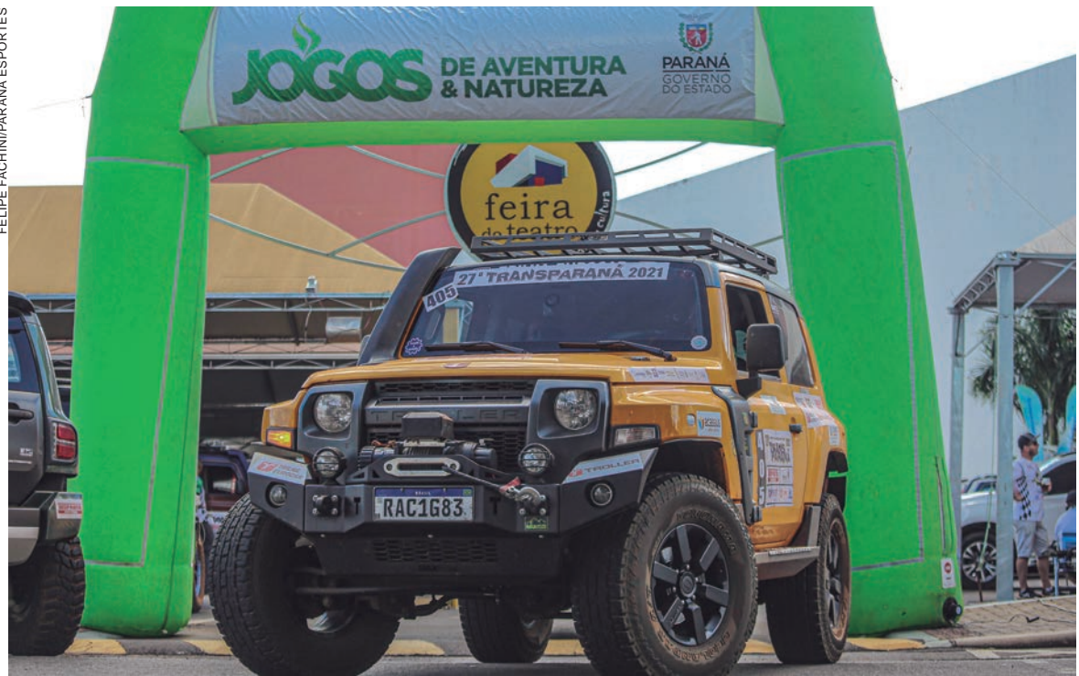
TENDO como pontos de destino as cidades de Guaíra e Maringá as equipes passarão dentro dos limites do município de Umuarama

As motos estão divididas nas categorias Moto