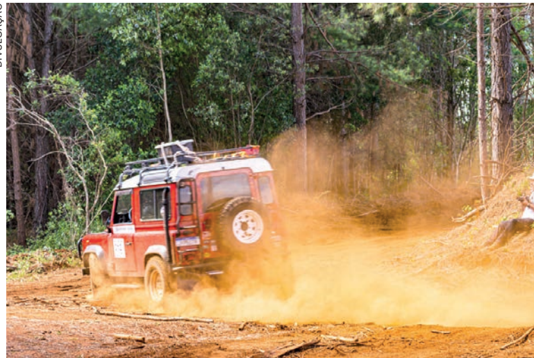
O 28º Transparaná percorrerá 1.300 quilômetros em cinco dias de Foz do Iguaçu a Curitiba, cruzando 55 municípios paranaenses