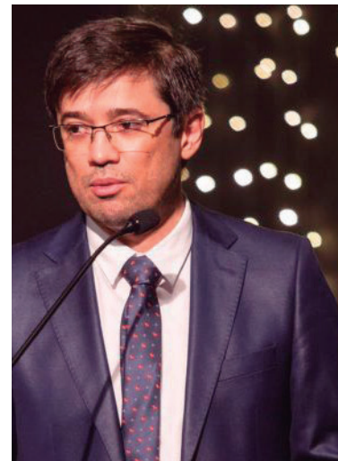
MÁRCIO Nunes de Oliveira, que é delegado da PF, assumirá o comando da corporação, no lugar do também delegado Paulo Maiurino

"Ao Dr Márcio Nunes, meus votos de sucesso em mais essa desafiadora missão da sua valerosa carreira. Caberá ao senhor dar continuidade ao trabalho do Dr Maiurino, incrementando a eficiência e o profissionalismo da Polícia Federal, diariamente", acrescentou.