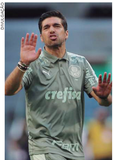
TÉCNICO Abel Ferreira tem contrato fechado com o Palmeiras até o final de 2022

jornalistas entendem o jogo jogado. O jogo falado até meu pai e minha mãe falam. O jogo jogado só quem realmente estuda. Não fiz curso de jornalismo, não falo de jornalista. Mas jornalistas falam de treinadores sem o curso de treinador”, disse o português.