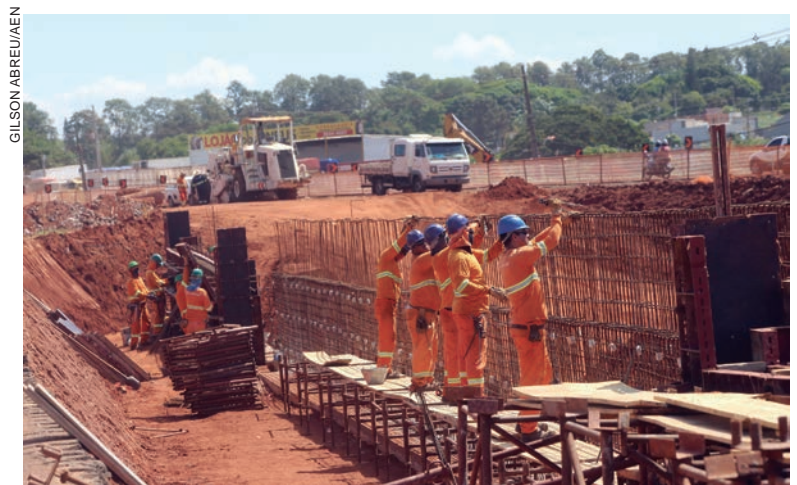
A construção atingiu em fevereiro 43% de conclusão, com término previsto para novembro deste ano

Está prevista a restauração, recuperação e reforço estrutural da ponte, bem como nova iluminação pública com luminárias LED, em uma extensão de 3,6 quilômetros. Também será executado um novo pavimento de concreto na rodovia de acesso à ponte no lado paranaense, em uma extensão de 1,1 quilômetro, a partir da Avenida Almirante Tamandaré. Também está prevista a execução de melhorias no sistema de drenagem e serviços de manutenção em todo o trecho contemplado durante a obra.