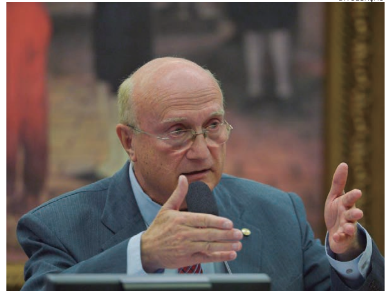
PREFEITO ressalta que o deputado sabe a importância desse setor e tem feito contribuições importantes através de emendas

Pimentel lembrou que por força de decreto de sua