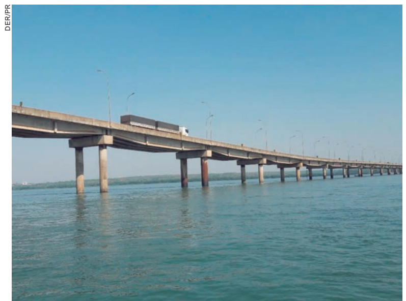
ESTÁ prevista a restauração, recuperação e reforço estrutural da ponte, bem como nova iluminação pública com luminárias LED, em uma extensão de 3,6 quilômetros

No trecho de 4,4 quilômetros haverá a duplicação e vias marginais. Após a trincheira no acesso a Mariluz a obra segue por uma extensão de 700 metros, com encerramento previsto para o km 304,1 da PR-323. Essa duplicação será efetivada pelo alargamento da pista existente, o que minimiza o impacto às propriedades lindeiras e os custos com desapropriações. As vias marginais foram dispostas de forma a expandir e complementar as laterais. Elas terão como finalidade separar o tráfego local para o de longa distância, permitindo o disciplinamento dos pontos de ingresso e egresso da rodovia. Ao longo do trecho estão previstas diversas agulhas de entrada/saída.