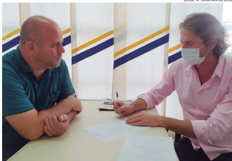
POR meio de ofício ao deputado, o município solicitou apoio para a aquisição de 25 implementos agrícolas

No pedido, entregue por meio de ofício ao deputado, o município solicita o apoio para aquisição de grades niveladoras, colhedoras de forragem, subsoladores com sete