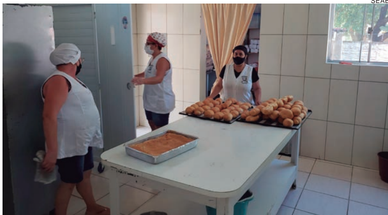
OS recursos de R$ 61.306,97 da Seab com R$ 3.334,66 de contrapartida do município garantiram a compra de equipamentos e materiais de consumo