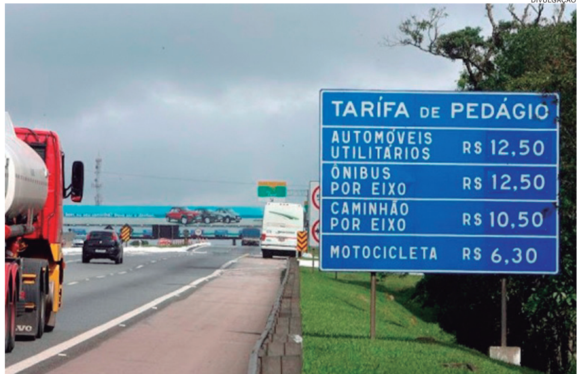
Na representação do TCU, os deputados questionaram a mudança de modelo econômico e a ausência de projetos técnicos das obras e estudos com valores de desapropriações

Na representação do TCU, os deputados questionaram a mudança de modelo econômico do processo e também a ausência de documentos essenciais como projetos técnicos das obras e estudos com valores de desapropriações. “A análise está suspensa na contagem de prazos, muito embora as equipes técnicas do TCU continuem trabalhando, inclusive interagindo com o Instituto de Tecnologia de Transportes e Inovação (ITTI), uma consultoria contratada