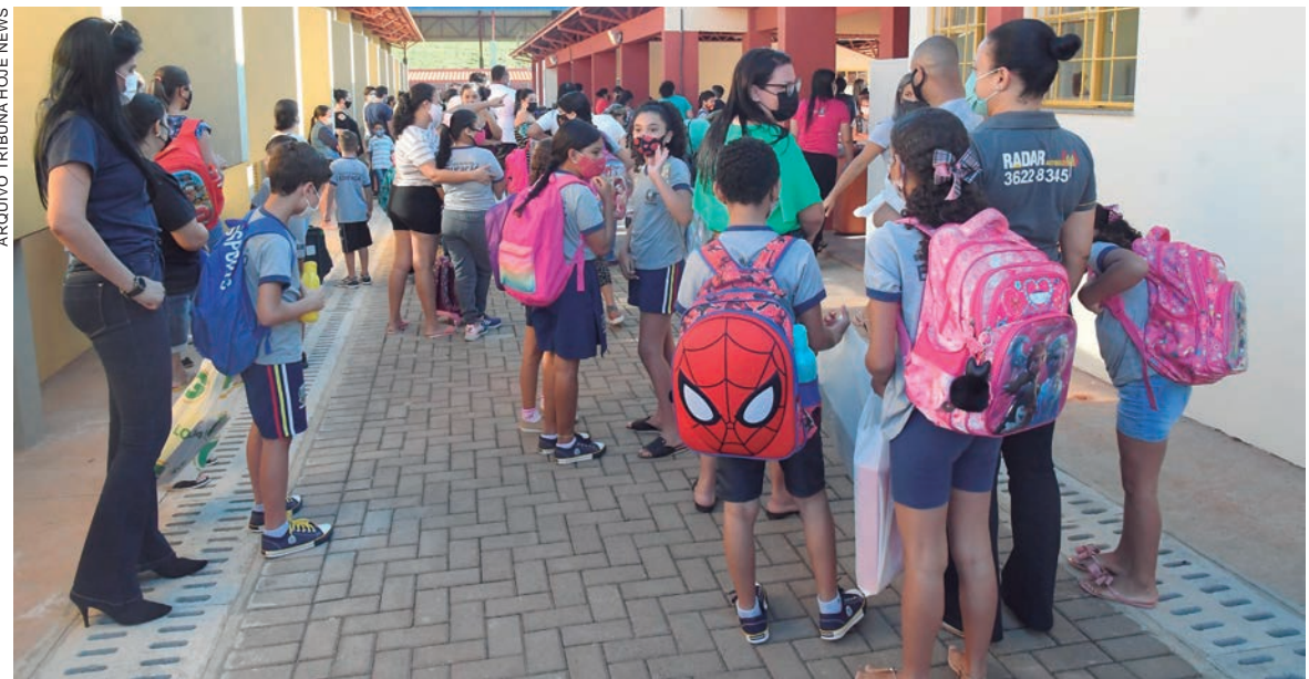
PELO programa Fundo Rotativo, a Secretaria de Estado da Educação e do Esporte repassa recursos de maneira descentralizada para as escolas

É o caso do Colégio Estadual João Paulo Apóstolo, em Curitiba, que atende cerca de