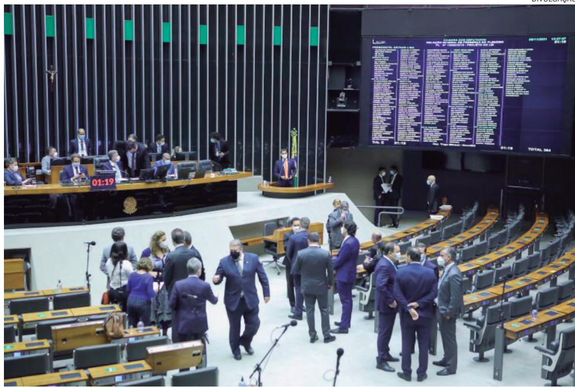
Depois de passar pela Câmara o texto será encaminhado ao Senado, onde já existem manifestações controversas

“É importante mitigar os riscos de lavagem de dinheiro, usando as estruturas que já atuam nesse controle – como o Coaf, Receita Federal e o