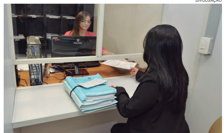
A nova sistemática vai eliminar a burocracia e facilitar o cumprimento de prazos processuais pelas partes e pelos advogados

O texto ainda permite que os documentos originais sejam encaminhados à Justiça usando o sistema nacional de protocolo, como opção à entrega nos cartórios judiciais, a única alternativa prevista na lei atual.