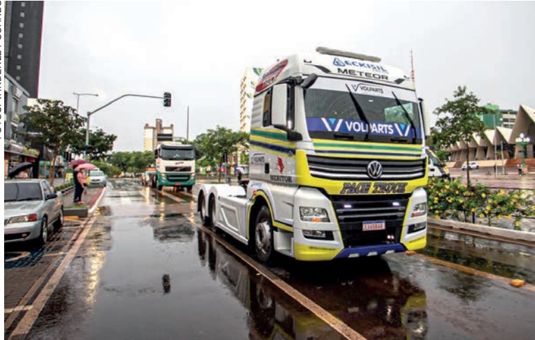
Mesmo com a chuva de ontem à tarde, os caminhões da Fórmula Truck desfilaram pelas ruas de Cascavel