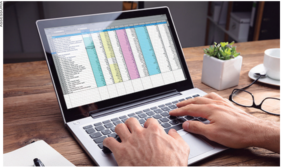
SÃO mais de 50 opções de cursos para todas as idades e em diversas cidades do estado

A lista completa dos cursos para realização on-line e a programação presencial de cada unidade, está disponível no site do Sesc PR.