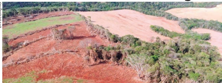
ÁREA foi mapeada com o uso de um drone e de um helicóptero pela Polícia Ambiental

Um proprietário rural foi autuado pela Polícia Militar Ambiental por danificar vegetação nativa de Mata Atlântica em Campo Mourão (cidade localizada a 100 quilômetros de Umuarama). A ação policial aconteceu na manhã de ontem (quinta-feira, 3).