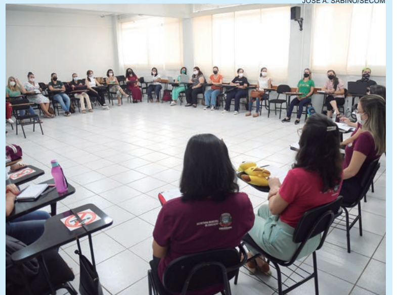
JOSÉ A. SABINO/SECOM

Ela conta que existe um cronograma, que foi previamente enviado às unidades educacionais, organizado por ano e turma em que lecionam em 2022. “Além das práticas pedagógicas mencionadas, a Secretaria Municipal de Educação utilizará o recurso ‘Google Sala de aula’, por meio dos e-mails