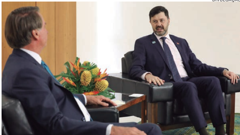
BOLSONARO e Sergey Lukashevich, em reunião no Brasil antes do conflito trataram de assuntos relacionados à importação de fertilizantes

Lukashevich afirmou ainda que Belarus foi obrigado a suspender as vendas de fertilizantes porque o escoamento foi proibido pela Lituânia, que fechou as fronteiras. “O potássio bielorrusso, que representa 20% do mercado brasileiro, é agora impossível de ser entregue aos consumidores brasileiros, porque a Lituânia “democrática”, nosso vizinho do norte com seus 2,7 milhões de habitantes, proibiu o trânsito de nosso potássio para o Brasil,