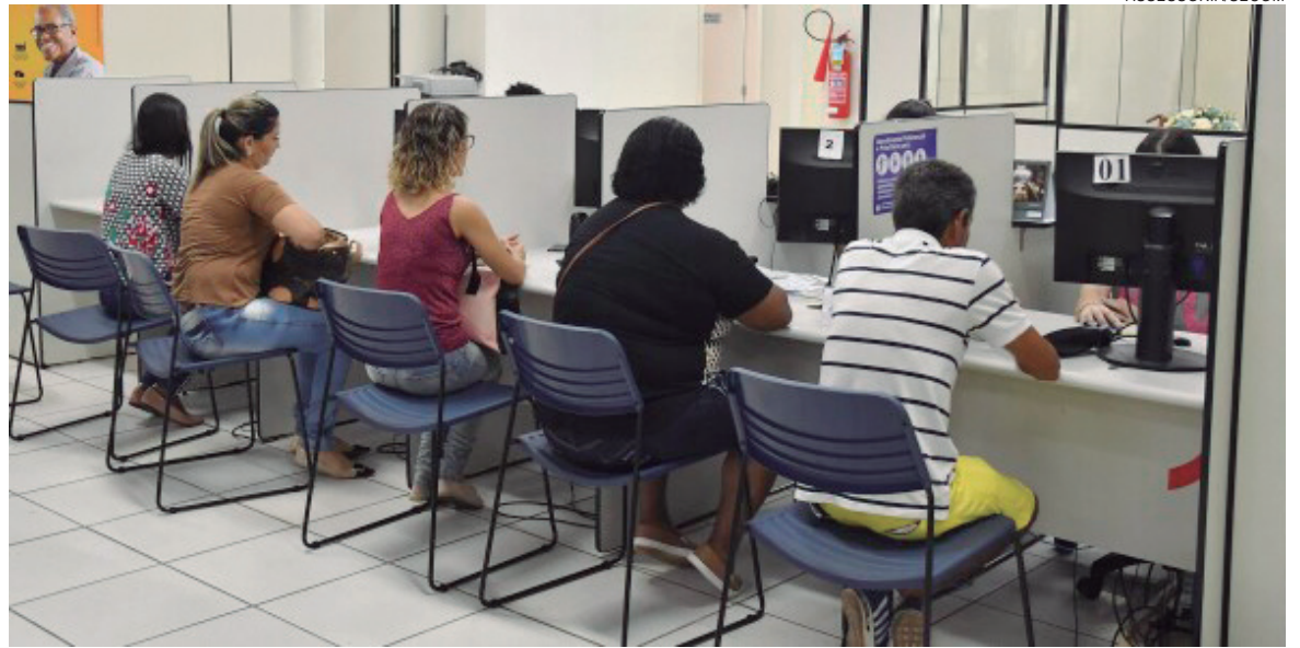
NOS 11 municípios da regional da Sejuf em Umuarama, 1.175 trabalhadores foram colocados no mercado de trabalho no acumulado de janeiro e fevereiro de 2022