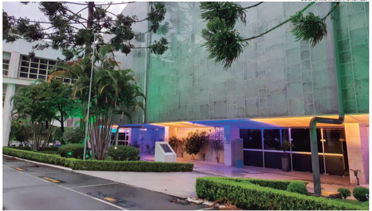
ALÉM da iluminação em amarelo e azul do prédio da Alep que acontece desde o dia 1º, a bandeira da Ucrânia será hasteada em frente ao Poder Legislativo

Além da iluminação em amarelo e azul do prédio da Alep que acontece desde o dia 1º, a bandeira da Ucrânia será hasteada em frente ao Poder Legislativo. Os deputados estaduais paranaenses também publicaram um manifesto de apoio incondicional ao povo ucraniano. “É inegável a contribuição das famílias de descendentes para o desenvolvimento de muitas cidades e regiões paranaenses. A Ucrânia é uma nação irmã e as violentas ações militares russas merecem total repúdio. A invasão promovida pela Rússia ataca todos os princípios de harmonia entre as nações e de convivência pacífica entre os povos. O parlamento do Paraná reforça a defesa da democracia e acredita que seus preceitos devem ser aplicados em qualquer lugar do mundo. O diálogo é a melhor forma de resolver conflitos. A soberania, a integridade territorial e o povo ucraniano têm nosso reconhecimento e respeito”, diz o texto.