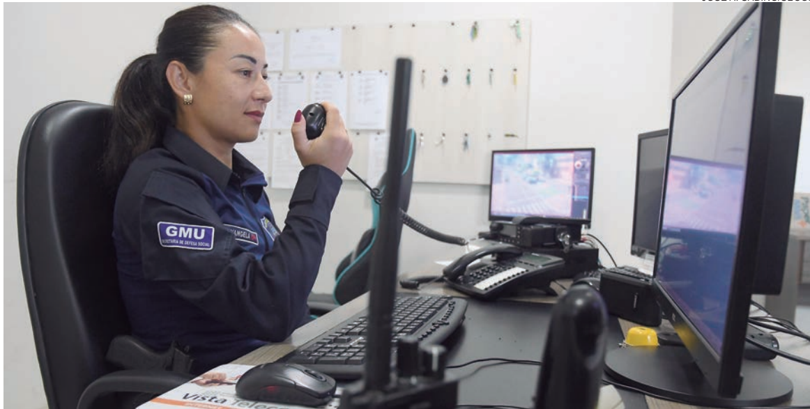
NA Guarda Municipal de Umuarama existem 16 mulheres e a diretoria fez questão de destacar a força e a garra dessas trabalhadoras

A Secretaria Municipal de Assistência Social preparou uma série de homenagens, que serão realizadas durante toda a terça-feira (8), a começar por café da manhã com equipes e convidadas do Creas/Cram (Centro de Referência e Assistência à Mulher). Destaque ainda para a ação que será realizada a partir das 10h30 no Lar