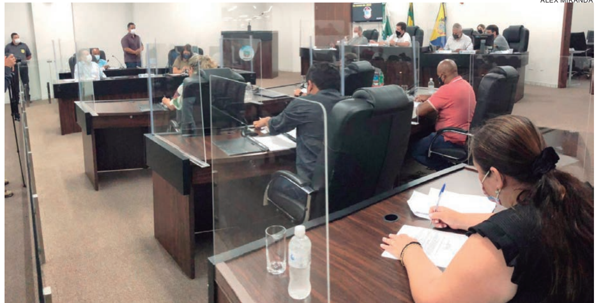
CONCESSÃO do direito de uso do Parque Dario Pimenta da Nóbrega pela SRU passa por votação na Câmara de vereadores

A Lei Orgânica do Município de Umuarama define que o uso de bens municipais, por terceiros, só poderá ser feito mediante concessão, ou permissão a título precário e por