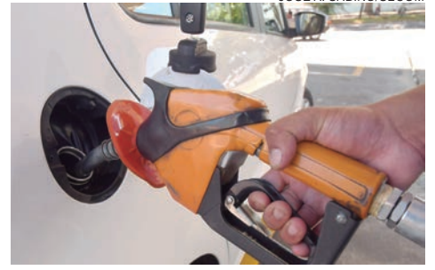
DE acordo com a pesquisa, o etanol pode ser encontrado a R$ 4,59, no lugar mais barato, e a R$ 4,75 no lugar mais caro, uma diferença de 10,9%

Já a gasolina pode ser encontrada tanto a R$ 6,39 quanto a R$ 6,80 – diferença de 6,4%. A maior diferença está no óleo diesel, que pode ser encontrado a R$ 5,13 ou a R$ 5,77 – 12,5%. “A pesquisa foi realizada pelo setor de fiscalização em 44 postos de combustíveis de Umuarama (um deles no distrito de Serra dos Dourados) e serve para orientar o consumidor em sua tomada de decisão. Lembramos que o Procon está sempre de portas