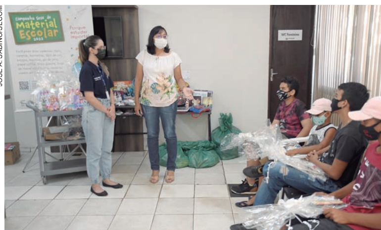
EQUIPES do Sesc Umuarama, fizeram a entrega à secretaria de Assistência Social na manhã de ontem