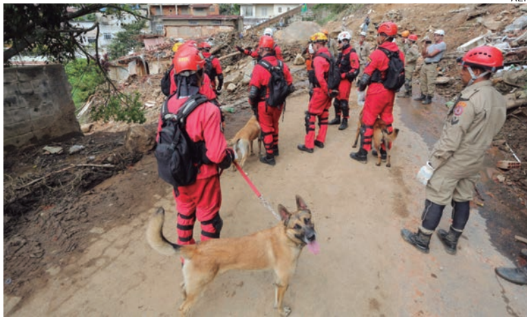
AS equipes foram designadas no indicativo, por meio dos cães, dos locais onde poderia haver vítimas, auxiliar na remoção e retiradas dos corpos e no apoio a outras demandas

São equipes especializadas nesse tipo de ocorrência e também no emprego de cães na procura pelas vítimas. Além dos