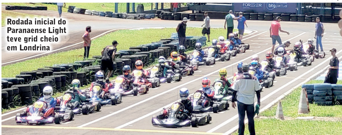
Rodada inicial do Paranaense Light teve grid cheio em Londrina

A rodada inicial da competição, organizada pela Associação de Kartistas da Região de Londrina (AKRL) e supervisionada pela FPrA (Federação Paranaense de Automobilismo), foi disputada no mesmo sistema utilizado na Copa Brasil. Após a tomada de tempos os pilotos foram à pista para duas provas classificatórias, que definiram o grid