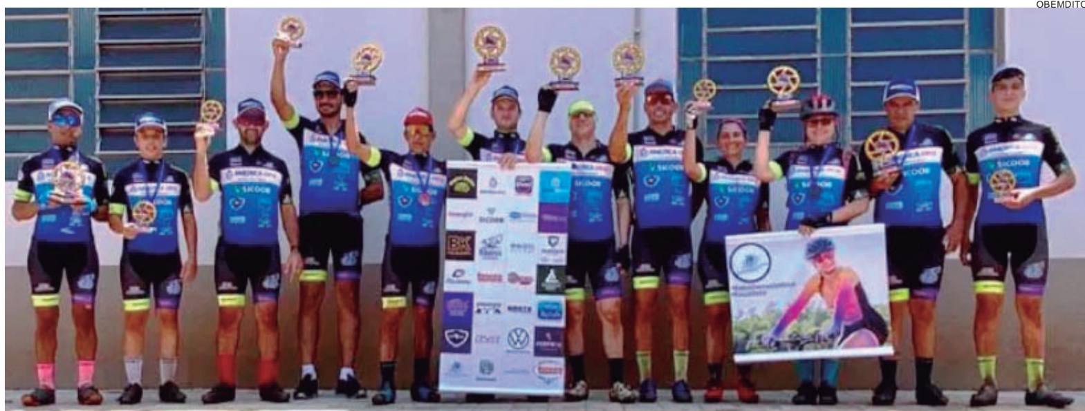
A equipe América Bike Shop/Fusão de Ciclismo, representou Umuarama no evento com a participação de 24 atletas, a maior delegação da competição

Foram 58 quilômetros na categoria Pró com 990 metros de altimetria e na Categoria Sport 44 quilômetros com 612 metros de altimetria, com muitas pedras soltas, curvas acentuadas, calor e subidas. A prova foi considerada de nível técnico extremamente difícil. Muitos atletas tiveram problemas com seus equipamentos