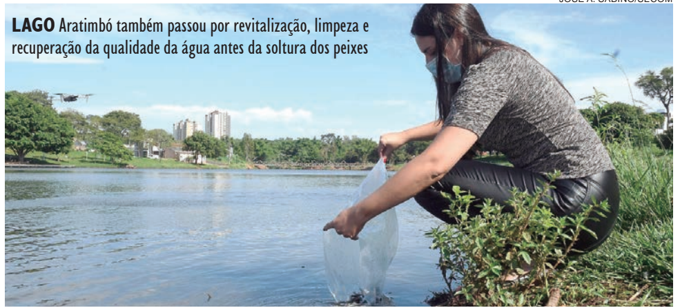
LAGO Aratimbó também passou por revitalização, limpeza e recuperação da qualidade da água antes da soltura dos peixes