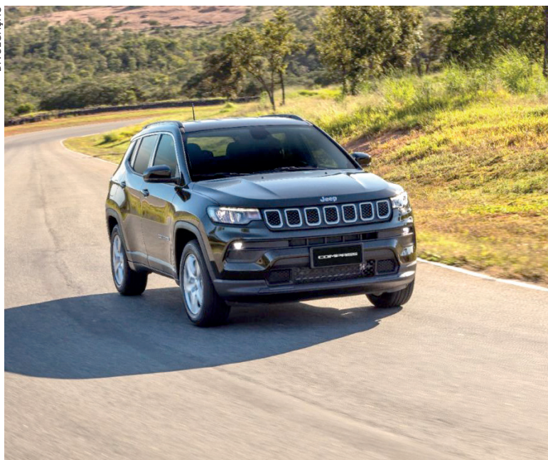
Commander alcança sua melhor participação de mercado no segmento de D-SUVs