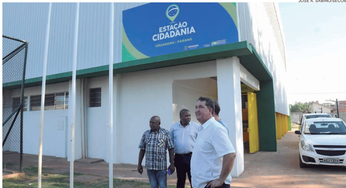
PREFEITO vai inaugurar a obra aguardada há 7 anos pela comunidade do Conjunto Habitacional Sonho Meu

Nos últimos meses, o ginásio recebeu adequação do pavimento, acabamentos internos e pintura, finalização da quadra aberta, ao lado do prédio, piso sintético flexível na quadra principal, plantio de grama (paisagismo) e instalações elétricas. O complexo esportivo conta inclusive com elevador para o acesso de cadeirantes ao mezanino. A