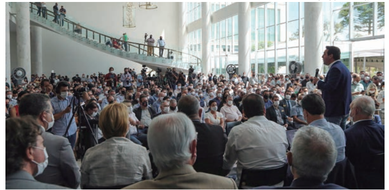
OS recursos foram repassados na presença de prefeitos e secretários de Saúde dos 399 municípios do Paraná

Japurá, na região Noroeste, vai receber R$ 200 mil para a obra de uma Unidade Básica de Saúde, R$ 27,3 mil para os atendimentos do SUS e