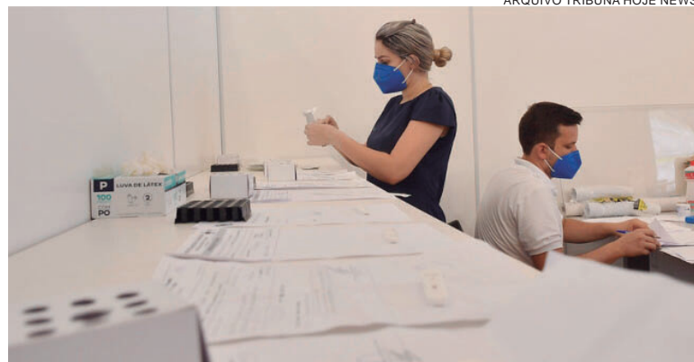
EM 24 horas a Tenda Covid realizou 107 consultas médicas e 232 exames anti-genos, com 67 resultados positivos (29%) e 165 anti-genos negativos (71%)

Nas últimas 24 horas o Ambulatório de Síndromes Gripais realizou 107 consultas médicas e 232 exames anti-