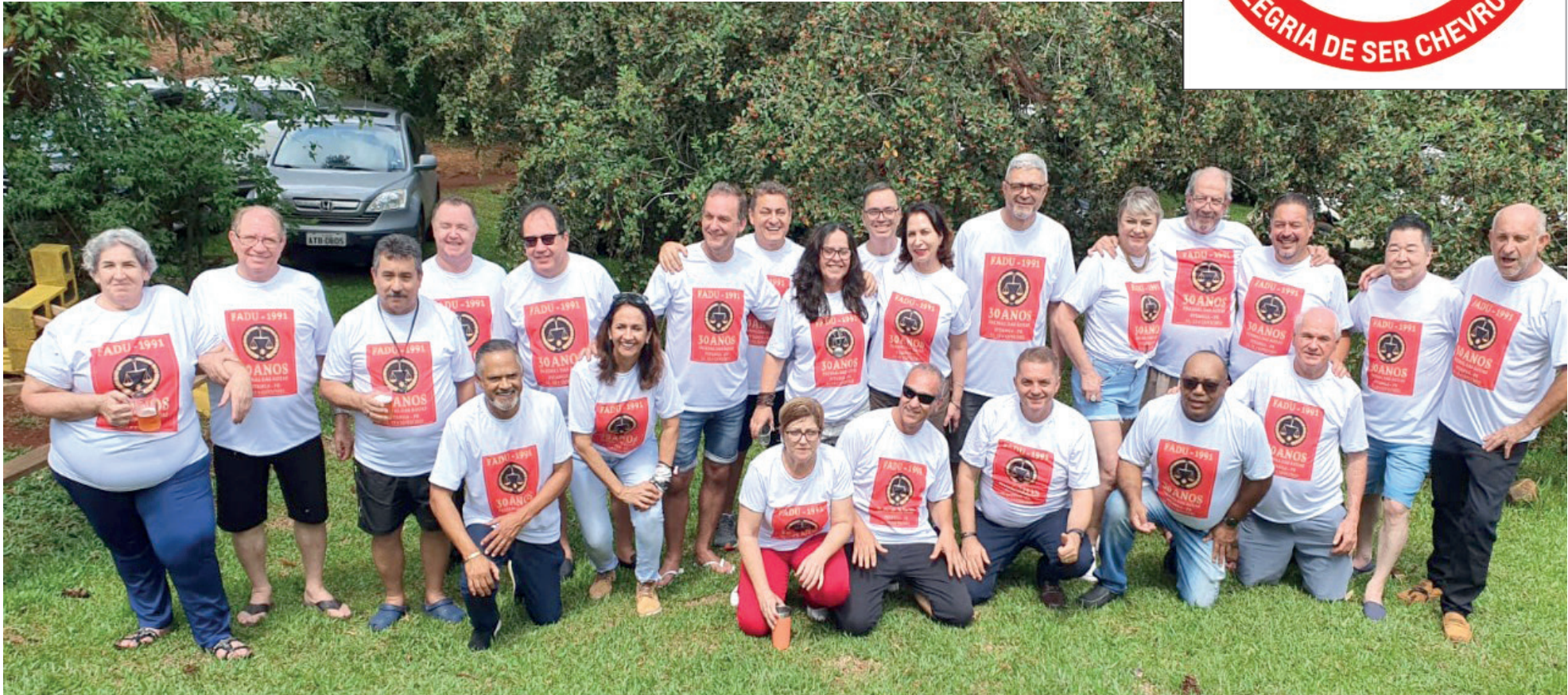
Turma de Direito de 1991 da FADU comemora 30 anos em encontro histórico!