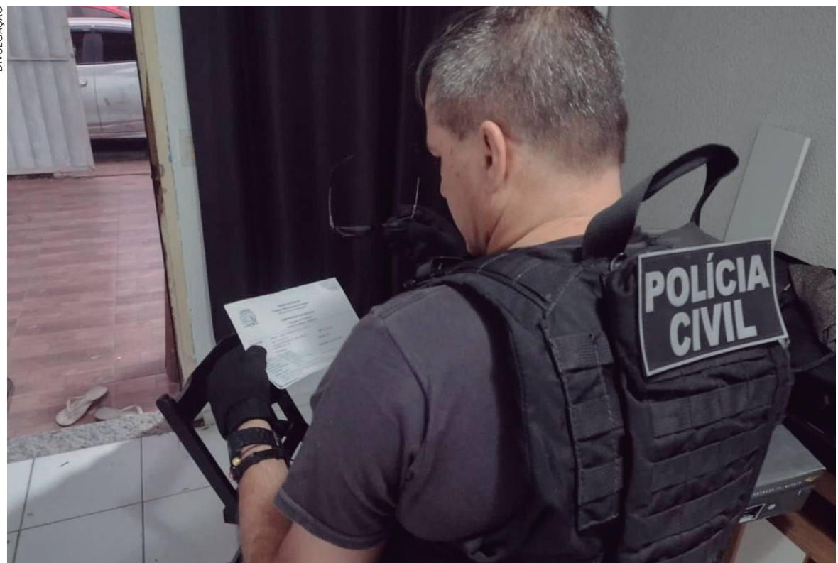
PCPR e PRF deflagram operação contra organização criminosa envolvida em pelo menos 12 roubos de carga

Naquela comunidade, teria acontecido um desentendimento entre dois homens, que terminou em agressões. Um dos envolvidos tem apenas 18 anos de idade. O outro, tem 38 anos. A Polícia Militar