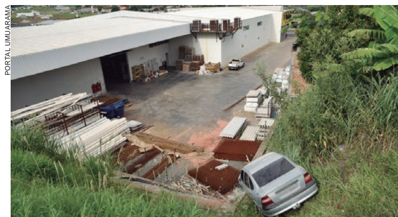
APÓS romper o muro, o automóvel desceu o barranco, já no domínio de uma empresa de materiais de construção, parando no início do pátio