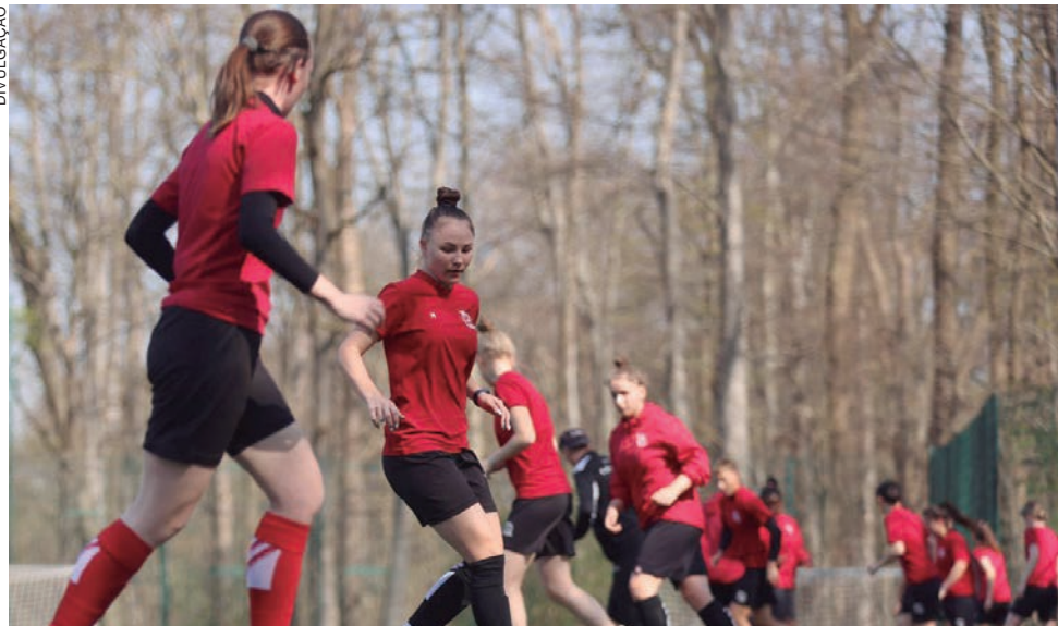
EQUIPE do Kryvbas foi acolhida pelo Colônia, 7º colocado da Bundesliga

“Os rostos que você está vendo agora não podem ser comparados aos rostos de quando elas chegaram aqui. No primeiro dia, você via olhares vazios, via medo e no primeiro dia, as mulheres também choraram. Mas depois de todas as boas experiências, estão sorrindo novamente”, disse Podkopyev.