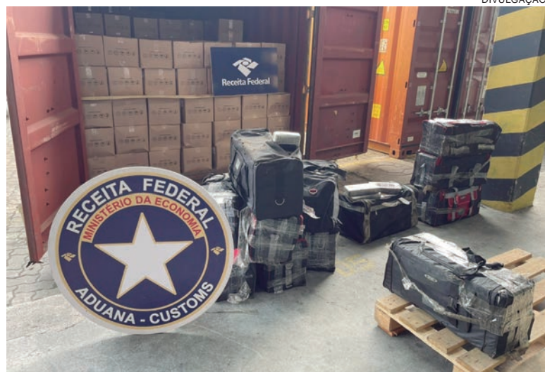
GRUPO criminoso usava o porto de Paranaguá para esconder drogas até nos cascos dos navios, através de mergulhadores

Durante os trabalhos foram realizados dois procedimentos de entrega controlada em conjunto com a França, que proporcionaram às autoridades daquele país a oportunidade de acompanhar o recebimento da cocaína em solo europeu, com a identificação do grupo criminoso responsável pela retirada da droga ("RIP OFF") no Porto de Le Havre, resultando na prisão dos envolvidos e apreensão de pistolas e fuzis, além da droga remetida. Apurou-se também que as quadrilhas investigadas possuem vínculo direto com a máfia italiana, especificamente com uma organização mafiosa constituída na região da Calábria, que contrata a logística executada pelos investigados em Paranaguá para enviar os carregamentos de cocaína até os portos da Europa, em especial o porto italiano situado na região na qual detém predomínio nas ações criminosas. Os envolvidos que foram alvos das duas ações, também se caracterizam pela extrema violência empregada, havendo a constatação do envolvimento de seus integrantes em homicídios, inclusive o líder de um destes grupos foi executado a tiros.