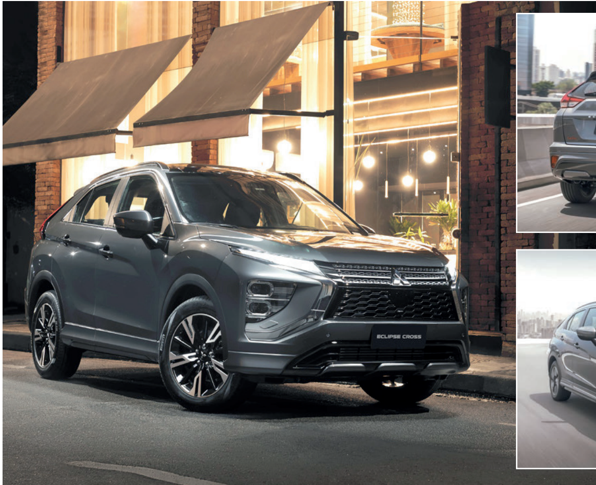
Novo Eclipse Cross 2023, SUV com legítimo DNA 4X4 da Mitsubishi chega com novo design, mais capacidade de porta-malas e mais opções de acabamento