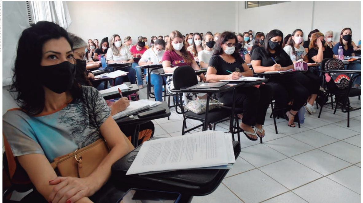
A primeira etapa da formação foi com 100 professores de Educação Infantil 5 e 1º ano do Fundamental

Hermes Pimentel, o município de Umuarama investe constantemente na qualificação e atualização dos professores. “Essa formação continuada, com doutores e especialistas renomados,