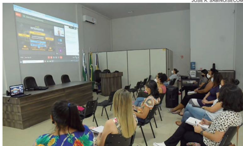
A cultura do ‘design thinking’ visa construir cidades inteligentes, com estrutura eficiente e intuitiva, melhorando a convivência e interação

Diante dos aspectos econômico, social, cultural e