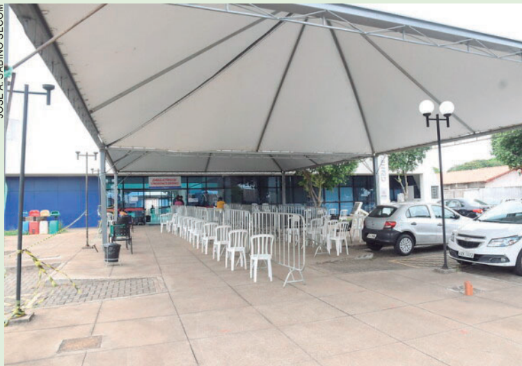
NO último plantão de 24 horas, a Tenda Covid realizou 143 consultas médicas, sem a necessidade de nenhum encaminhamento aos hospitais

De acordo com o Boletim Covid da sexta-feira (25), 41 novos casos foram confirmados, sendo 23 mulheres, 15 homens e três crianças. Os casos ativos estão em 506 e o total de casos suspeitos é de 46, indicando que 556 pessoas estão em isolamento domiciliar. Novamente nenhuma morte foi oficialmente confirmada e o total de óbitos segue em