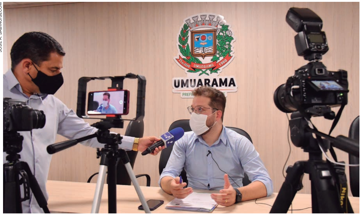
PROCURADOR Jurídico ressalta que o município está atuando de forma efetiva para resolver a situação, respeitando a lei, por isso as medidas demoram para serem implementadas

O procurador acrescentou ainda que, do ponto de vista jurídico, o município trabalha em várias frentes. “A problemática não é apenas a suspensão das linhas, apesar do impacto que isso causa à população. Existe uma ação civil pública questionando a prorrogação do contrato e determinando uma nova licitação no prazo máximo de 8 meses. Tem também a questão do reequilíbrio financeiro, que é necessário, porém a empresa não apresentou outras medidas a não