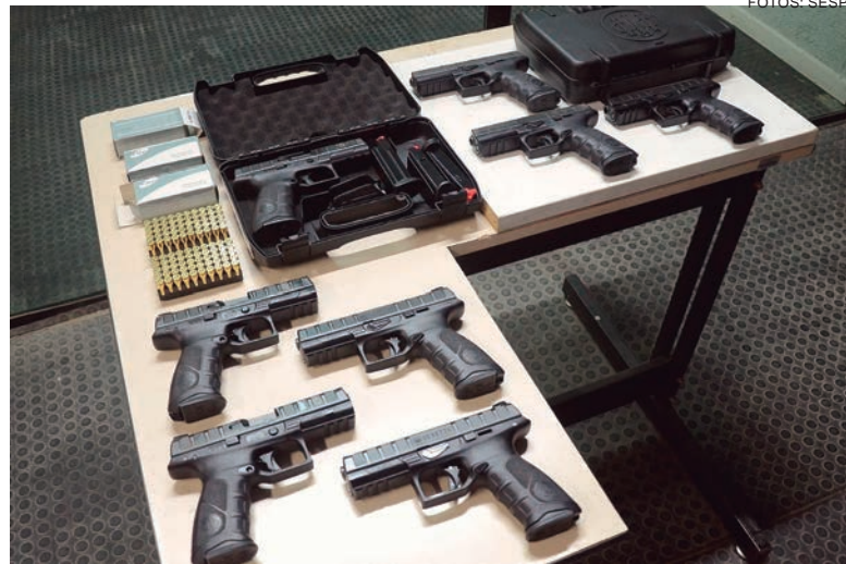
OS policiais civis também receberão cinco mil pistolas Beretta APX Full Size 9mm. Os itens estão divididos em dois contratos

os policiais civis receberão novas carteiras e insígnias para identificação.