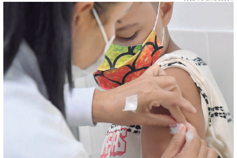
EM pouco mais de 60 dias, a Secretaria de Saúde aplicou 5.628 primeiras doses

Ela conta que a sugestão de levar a vacina até as crianças foi dada por representantes do Conselho Municipal de Saúde e da Regional de Saúde. “Profissionais da Secretaria de Saúde também já fizeram esforço concentrado em diversas ações, como campanhas realizadas aos sábados