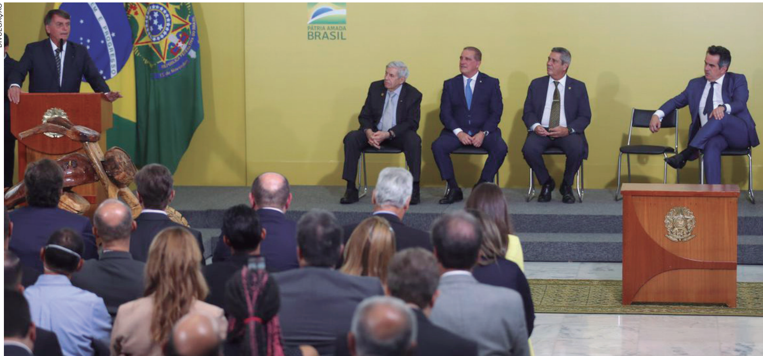
A adoção desse regime poderá ser acordada entre o empregador e o trabalhador e deverá seguir regras já previstas na legislação

O governo federal apresentou ontem (25) duas medidas provisórias (MP) para regulamentar o trabalho remoto, promover mudanças no auxílio-alimentação e também com ações como a antecipação de férias ou benefícios como abono para os trabalhadores, em caso de ocorrência de situação de calamidade. As medidas fazem parte do Programa Renda e Oportunidade e, segundo o governo, visam ajudar na retomada da economia.