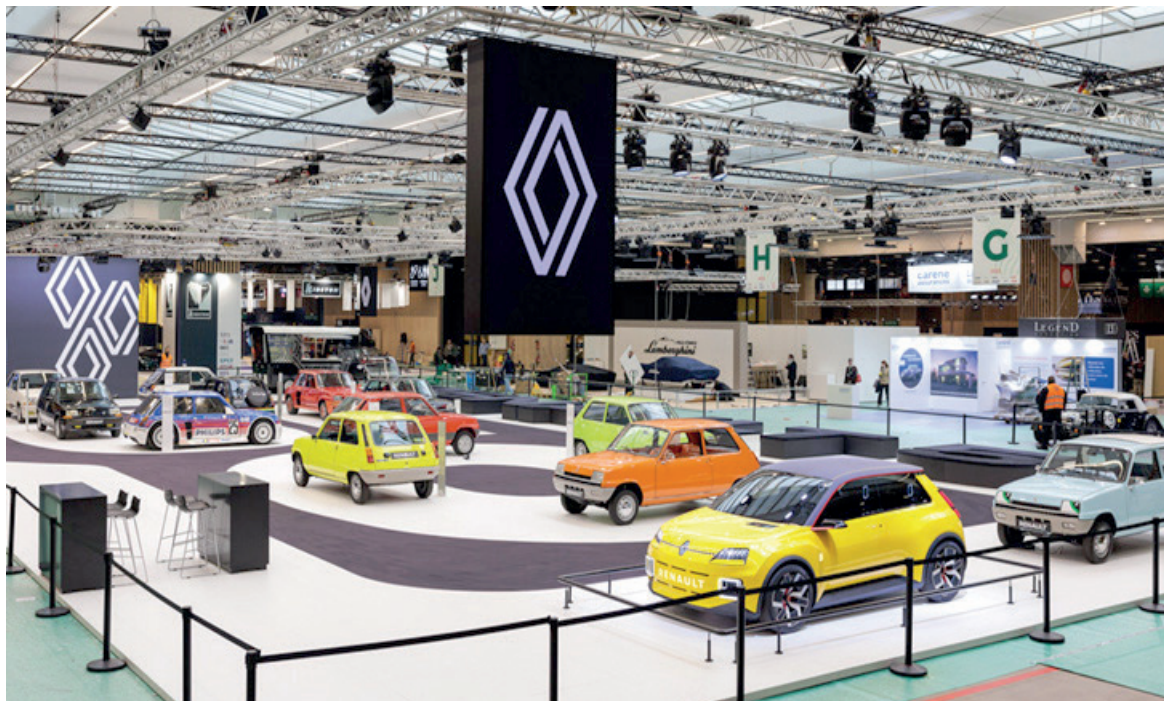
O Renault 5 foi lançado em 1972, em duas versões: o “L” equipado com motor de 782 cm 3 e o “TL”, com motor de 956 cm 3

“É muito bacana comemorar o 50º aniversário do emblemático Renault 5 com