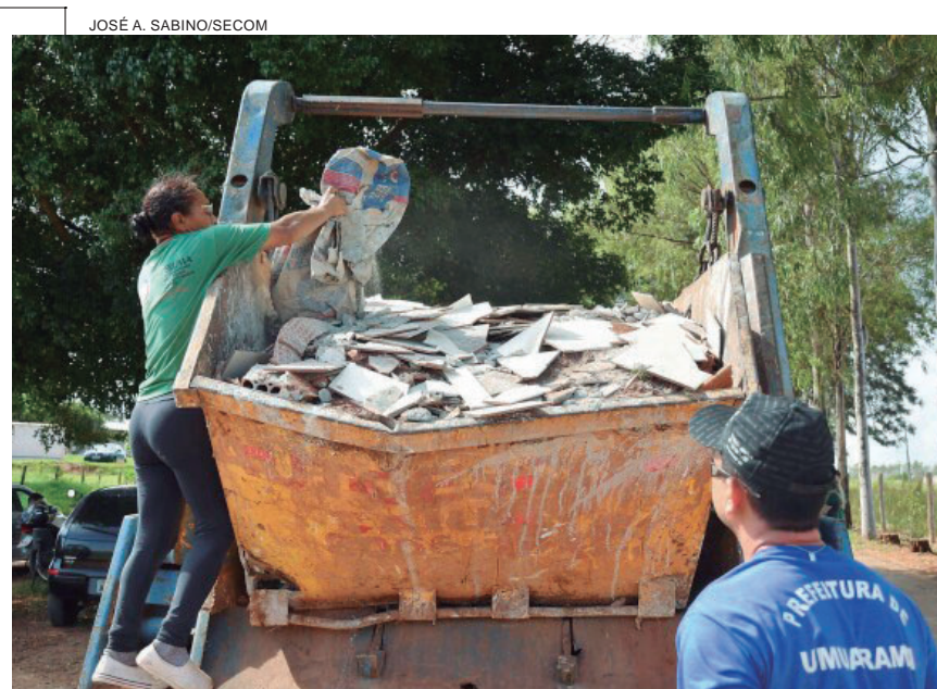
Prefeitura de Umuarama vai instalar cinco pontos de entrega voluntária (PEV) de resíduos em regiões estratégicas da cidade, para facilitar à população o descarte de móveis velhos, entulho de construção, galhos e materiais recicláveis. Os locais já estão definidos e o projeto tem a parceria da Secretaria de Estado do Desenvolvimento Sustentável e do Turismo (Sedest) que, por meio de convênio, fornecerá dois caminhões e seis caçambas para o transbordo do material. Com uma contrapartida R$ 16 mil, firmou convênio com o IAT para a cessão de um caminhão poliguindaste e seis caçambas estacionárias para coleta de resíduos. Os pontos de recolhimento – denominados ‘ecopontos’ – serão criados nos bairros Parque D. Pedro, Conjunto Habitacional Sonho Meu, Parque Industrial, Jardim São Cristóvão e Parque 1º de Maio, onde as caçambas serão disponibilizadas, e a sexta unidade será para a troca”, anunciou o secretário do Meio Ambiente, Rubens Sampaio. Outro caminhão será destinado a esgotamento sanitário em fossas de prédios públicos ou imóveis residenciais, neste caso em atendimento a determinações da Justiça.

objetivos, por isso capacitações como esta são muito importantes”, pontuou.