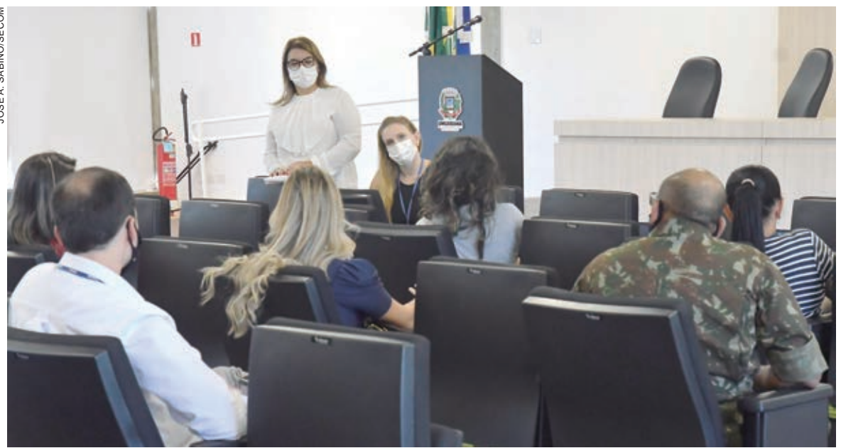
NUMA reunião realizada na Prefeitura entre os envolvidos, foram definidos os detalhes de como será realizada a ação

Além de todos esses serviços, também serão montados brinquedos infláveis para a criançada e feitas avaliações