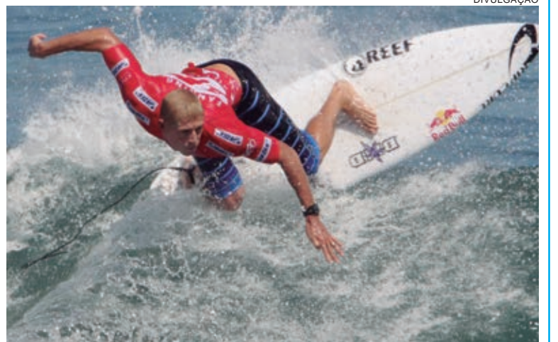
FANNING ganhou títulos mundiais em 2007, 2009 e 2013, mas também é lembrado por seus encontros com dois tubarões em três anos no J-Bay Open, na África do Sul

O ícone do surfe australiano se aposentou oficialmente em 2018.