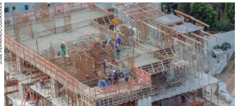
NO acumulado dos dois primeiros meses do ano, o Estado tem saldo de 47.804 postos abertos, ficando atrás apenas de São Paulo e Santa Catarina

“Mais uma ótima notícia que reforça os acertos da política econômica adotada pelo Governo do Estado. Emprego é nossa prioridade, a melhor política social que existe. Por isso o esforço para ampliar a atração de investimentos. De 2019 para cá, do início da nossa gestão, foram mais de R$ 100 bilhões