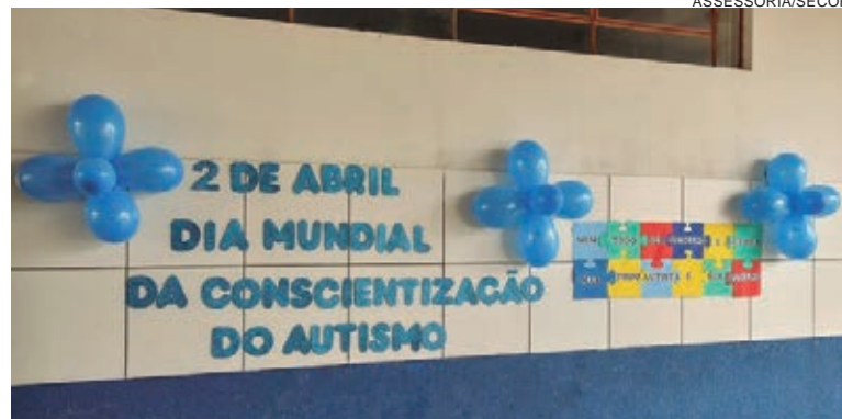
ASSESSORIA/SECOM O Dia Mundial da Conscientização do Transtorno do Espectro Autista, é comemorado em várias cidades brasileiras por meio de atividades como palestras e eventos públicos

Ela relata ainda que a coordenadoria de Educação