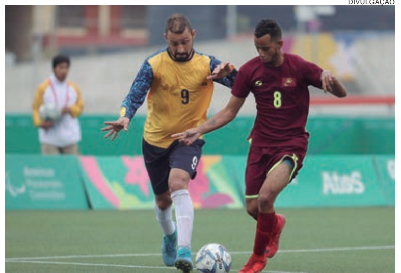
A seleção esteve reunida no Centro de Treinamento Paralímpico entre os dias 13 e 23 de março, para o último encontro antes da convocação definitiva

Na última edição, em 2019, também disputada na Espanha, mas em Sevilha, os brasileiros ficaram na terceira posição, repetindo as campanhas de 1998, 2001 e 2015. Oito jogadores chamados para o Mundial de Salou fizeram parte da equipe nacional