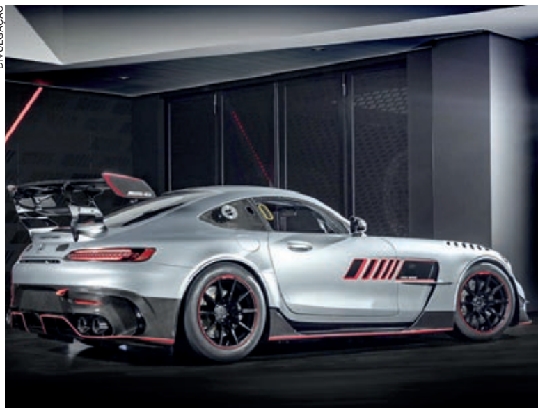
Esportivo é desenvolvido para ser utilizado somente em pistas de corrida, especialmente em Track Days