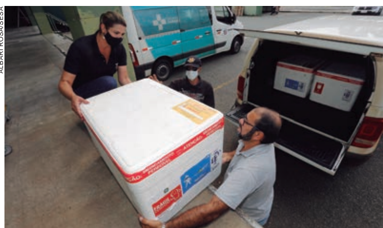
Ao todo, no Paraná, 4.308.575 pessoas pertencem aos grupos prioritários e deverão ser vacinadas durante a campanha

“Este primeiro lote deve contemplar uma parte do primeiro grupo definido pelo Ministério da Saúde de idosos e trabalhadores da Saúde. Outras remessas devem chegar ao Paraná”, disse o secretário