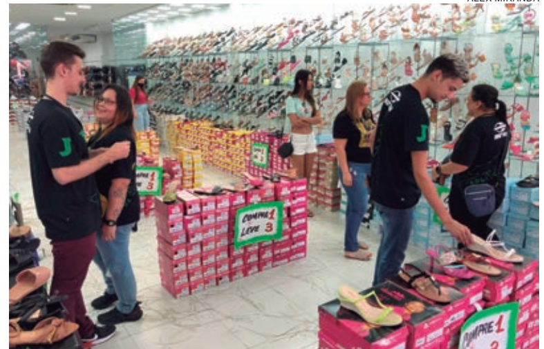
RATINHO Junior assinou decreto que libera a circulação sem máscaras e revoga os dispositivos da norma anterior

No Paraná, quase 80% da população está com a cobertura vacinal completa e mais de 4 milhões de pessoas receberam a dose de reforço. Também houve redução no número de mortes e de casos mais graves da doença. A