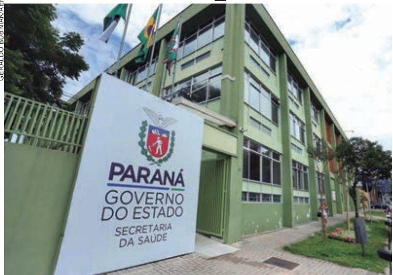
A mudança foi possível graças à queda no número de casos, óbitos e internamentos pela Covid-19 no Estado

A Secretaria de Estado da Saúde (Sesa) voltou a liberar as visitas hospitalares no Paraná. A orientação foi confirmada na Resolução Sesa nº 236/2022, publicada no Diário Oficial do Estado ontem (terça-feira, 29).