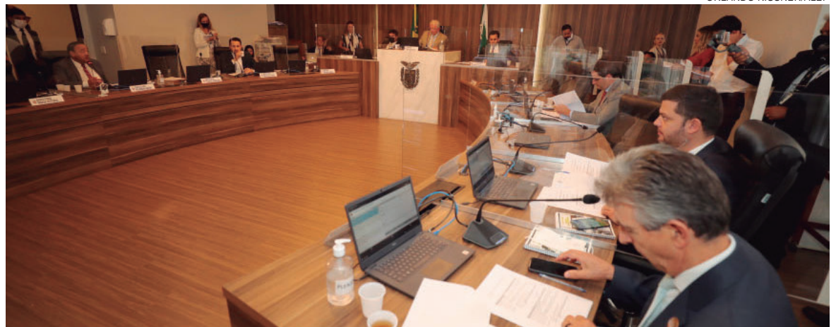
PASSANDO pela CCJ, as propostas deverão ser votadas em primeira e segunda reuniões, além da redação final

emenda modificativa dobrando os valores de aumentos da tabela proposta pelo Governo com utilização de recursos dos dividendos da Copel e Sanepar que cabem ao Estado. Sugeriu, ainda, mudanças em relação ao quinquênio, mantendo os 5% a que os policiais têm direito quando passam de uma referência para outra e que ficaram abaixo na nova tabela do Governo. As alterações, contudo, não foram acatadas.