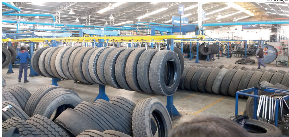
Para recapar um pneu é necessário apenas de 25% da matéria-prima para fabricação de um novo e diminui a emissão de CO 2 na mesma proporção

novos, existe uma demanda média de 57 litros de petróleo, e a emissão de cerca de 26 kg de CO 2 na atmosfera. Já para reforma do mesmo pneu e com desempenho semelhante, a necessidade é apenas de 25% da matéria-prima, e diminuição da emissão de CO 2 na