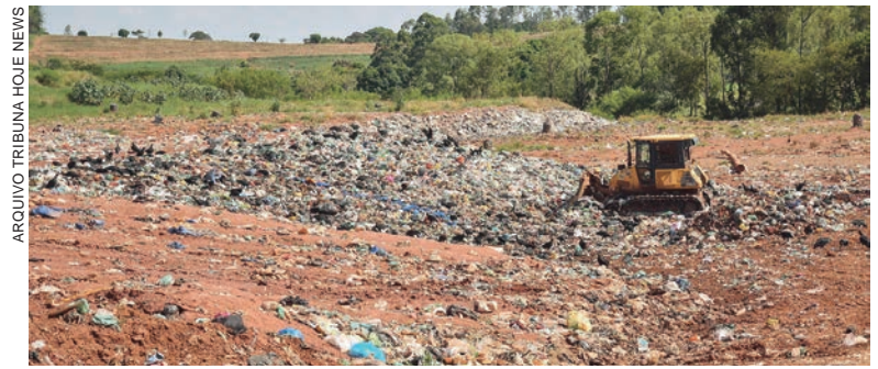
MATÉRIA prevê regulamentação das operações de aterros sanitários e industriais, além de dispor sobre as atividades de gerenciamento de resíduos

A matéria tramita em regime de urgência e será analisada em primeiro turno já na sessão desta quarta-feira (30).