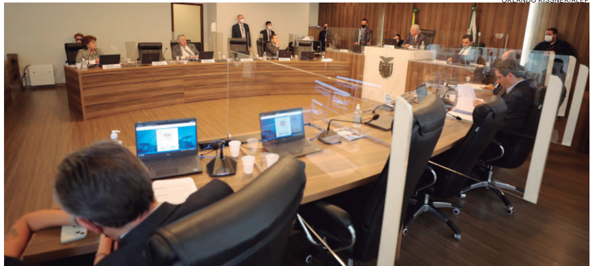
RELATÓRIO foi aprovado com um voto contrário e ainda será analisado pela Comissão de Indústria, Comércio, Emprego e Renda, antes de ir ao plenário