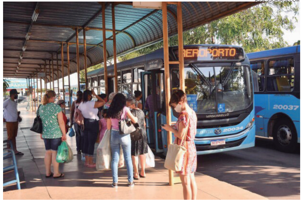
DECISÃO unilateral da empresa, alegando desequilíbrio econômico, queda de passageiros e a alta dos insumos, levou prefeito a constituir comissão