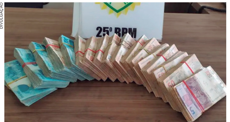
TUDO o dinheiro foi recolhido e levado, junto com o taxista, à Delegacia de polícia de Umuarama

Depois de receber uma denúncia anônima, policiais militares de Umuarama abordaram no centro da cidade, um taxista que transportava cerca de R$ 110 mil em espécie. Ele havia recebido o dinheiro de uma pessoa, que segundo ele é desconhecido, e deveria entregar o pacote para outro desconhecido em Guaíra, cidade de onde ele veio para fazer o ‘corre’.