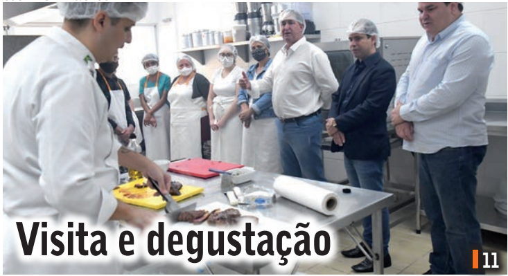
Visita e degustação