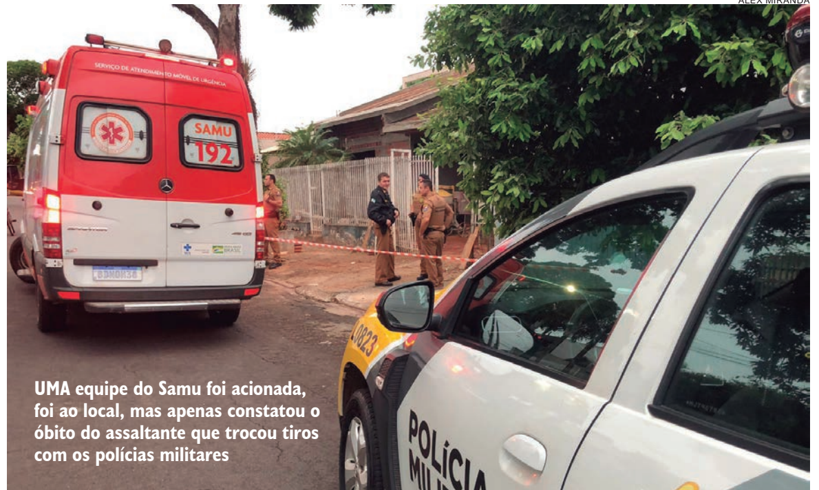
UMA equipe do Samu foi acionada, foi ao local, mas apenas constatou o óbito do assaltante que trocou tiros com os policiais militares

O corpo do criminoso alvejado foi encaminhado ao IML,