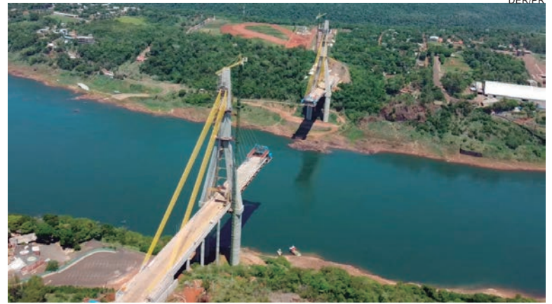
A ponte terá 760 metros de comprimento e um vão-livre de 470 metros – o maior da América Latina

A obra prevê uma nova ligação rodoviária entre a BR-277 e a Ponte da