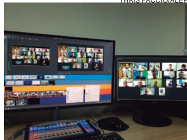
ESPECIALISTAS defenderam maior fiscalização para evitar acidentes com cargas perigosas na rodovia BR-376