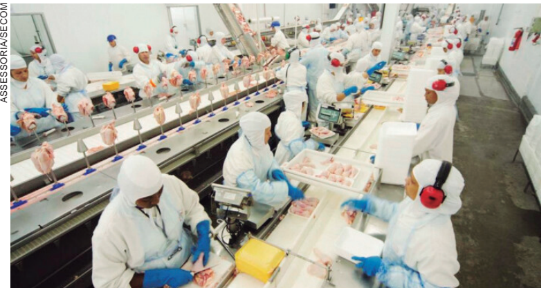
EQUIPES da Agência do trabalhador visitam os distritos em busca de interessados em trabalhar na Indústria de Alimentos Levo

Uma equipe da Agência do Trabalhador de Umuarama estará nos distritos de Serra dos Dourados e Santa Eliza, na próxima terça-feira, 3, para agendar entrevistas de emprego. O abatedouro de aves da Levo Alimentos disponibilizou 90 vagas de auxiliar de produção, exclusivas para moradores destas localidades.