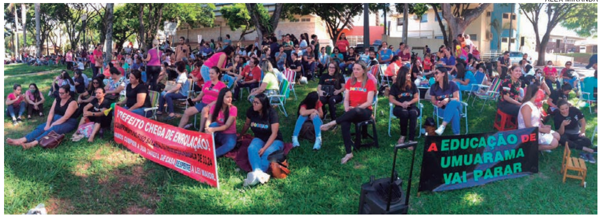
COMISSÃO e sindicalistas protocolou na Prefeitura os relatórios contábeis para confrontar com dados das receitas e percentual de gastos com folha de pagamento dos servidores

Porém, como foi confeccionado um novo protocolo para adequar os dados na manhã daquela quarta-feira, também pelo sindicato, a análise