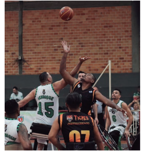
A competição começa com o embate contra o Kings Maringá, às 8h e às 15h30 os umuaramenses voltam à quadra para enfrentar os Lakers/Adefu, de Uberaba (MG)