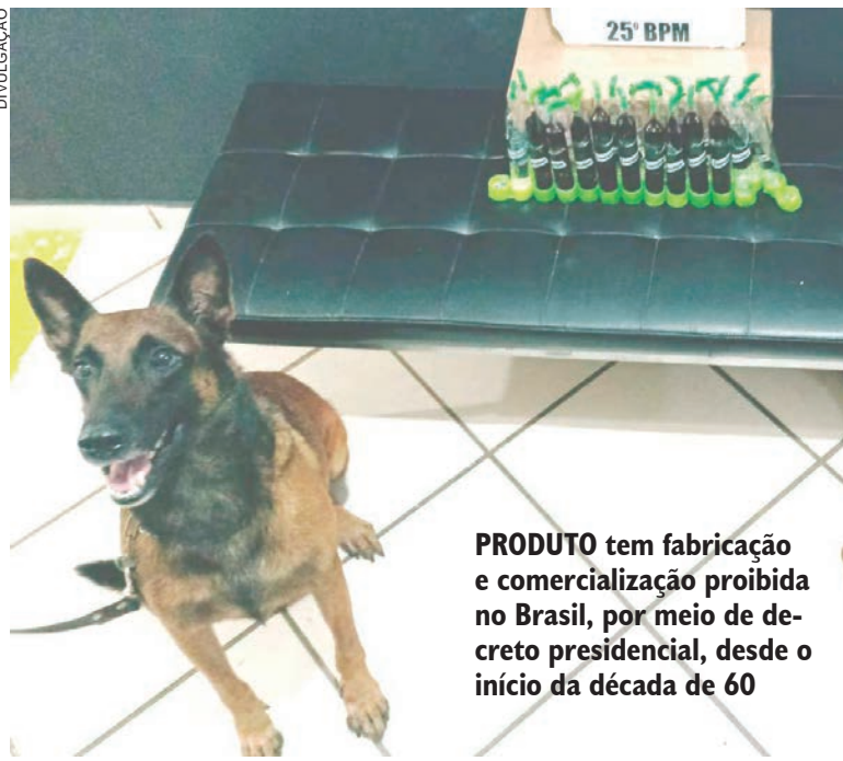
PRODUTO tem fabricação e comercialização proibida no Brasil, por meio de decreto presidencial, desde o início da década de 60

A encomenda foi interceptada na agência dos Correios do