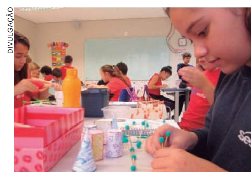
EM Umuarama, o cronograma prevê o projeto Matemática nas profissões, ciências e a Matemática e Tridimensionalidade. Haverá também provas de desafios online

Em Umuarama, o cronograma prevê o projeto Matemática nas profissões, ciências e a Matemática e Tridimensionalidade. Haverá também provas de desafios online