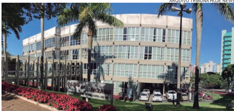
A maior fatia do 'bolo' é referente ao IPVA (R$ 21.966.112,07). Depois vem o repasse de ICMS (R$ 12.877.513,60) e logo atrás, o Fundo de Exportação (R$ 169.597,23)

Dados do Sistema Integrado de Acompanhamento Financeiro (Siaf) da Secretaria da Fazenda demonstram que o repasse de ICMS aos municípios foi de R$ 2,73 bilhões no primeiro quadrimestre do ano, o que corresponde a mais