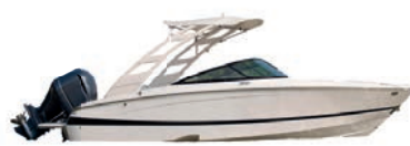
1º Prêmio: Lancha motorboat Evinrude 225

Sorteio 30/11/2022 pela extração da Loteria Federal