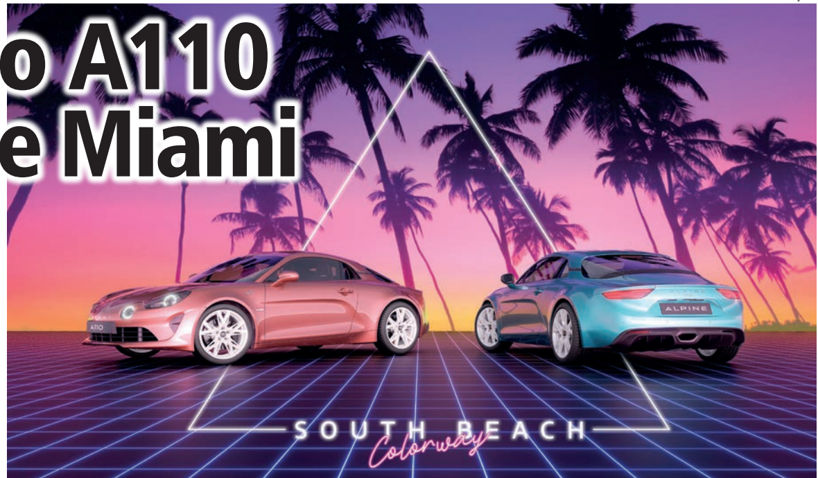
Durante o primeiro GP de Fórmula 1 de Miami, a Alpine revela um pacote exclusivo South Beach Colorway para o Alpine A110

Apesar da aparência disruptiva que remete ao pop art, o South Beach Colorway se insere perfeitamente na identidade da Alpine, pois as tonalidades Bleu Azur e Rose Bruyère fazem parte das cores históricas da marca, transformando esta edição com visual rétro em um ícone