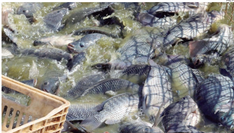
AINDA que a piscicultura seja, por enquanto, uma atividade com menos expressão, há um movimento da indústria para aumentar a representatividade na balança comercial

Ainda que a piscicultura seja, por enquanto, uma atividade com menos expressão que outras do agronegócio paranaense, os números mostram, segundo o Boletim de Conjuntura, que há um