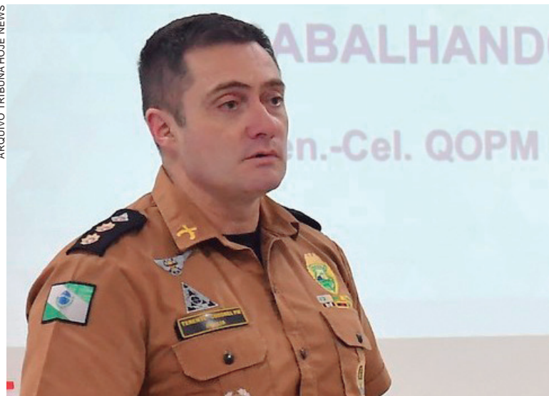
O comandante de Umuarama afirmou que, após a criação do programa, as regiões de fronteira ganharam mais segurança com policiais mais empenhados nas operações

As ações em conjunto tiveram um impacto positivo, já que, de 2020 para 2021, houve um aumento de 127% na apreensão de cocaína e de cigarros contrabandeados no