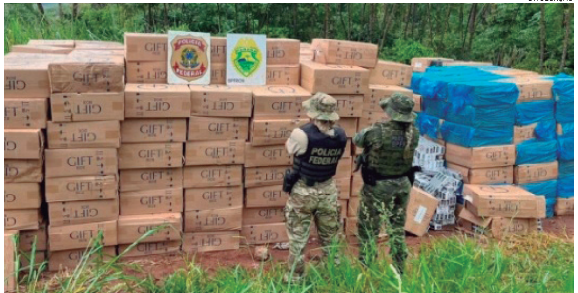
DESDE 2019 as polícias do Paraná já apreenderam 159 toneladas de drogas, prenderam 953 criminosos, apreenderam 256 armas e 95 milhões de maços de cigarros

Segundo ele, o Centro Integrado de Operações de Fronteira (CIOF), em Foz do Iguaçu, que tem policiais 24 horas por dia preparados para atender ocorrências, tem colaborado imensamente nesse trabalho.