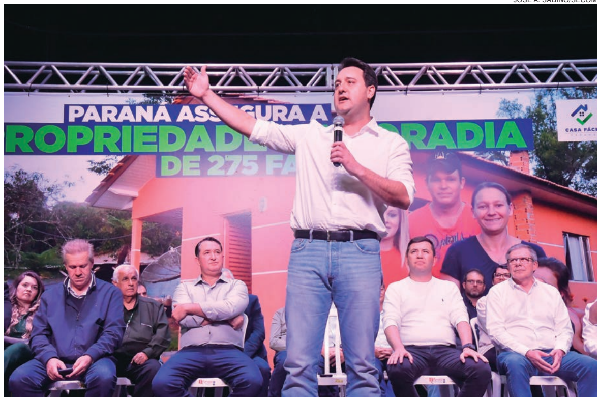
No discurso de abertura do evento, o governador Ratinho Junior e o prefeito Hermes Pimentel anunciaram a construção de novas 450 casas

“Cerca de 16 mil famílias de paranaenses receberão a documentação do imóvel dentro deste programa. Há ações parecidas em todas as regiões do Paraná. É o primeiro passo. Nos próximos meses voltaremos a Umuarama para entregar mais 200 escrituras deste tipo. Além das obras estruturantes como a duplicação da PR-323, a construção do Trevo