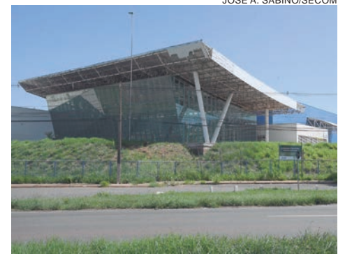
A última etapa compreende o fechamento do hall de entrada, colocação dos vidros, piso e forração, além do sistema de ar-condicionado e mobília

A conclusão do Centro de Eventos é uma das metas do prefeito Hermes Pimentel, que deseja inaugurá-lo ainda neste ano. “Uma obra dessa dimensão não pode ficar parada, se deteriorando sem uso. Já são quase 12 anos de obras que avançam e param e até hoje não se conseguiu terminá-la, por isso estamos agilizando os processos da última etapa e a reforma para entregar a obra o quanto antes”, disse ele.