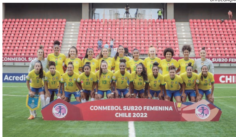
A competição reunirá 12 nações. O Brasil é um dos quatro países que participaram de todas as edições do Mundial Fifa Sub-20

A competição reunirá 12 nações. O Brasil é um dos quatro países que participaram de todas as edições do Mundial Fifa Sub-20. A lista seleta inclui também Alemanha, Nigéria e Estados Unidos. A melhor campanha da seleção brasileira ocorreu no Mundial de 2016 (Rússia), com a conquista da medalha de prata.