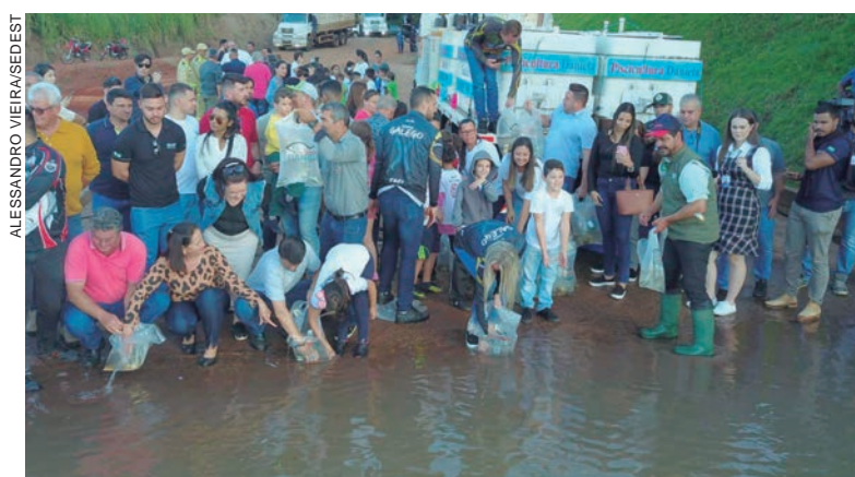
O objetivo é proteger a fauna silvestre e o ambiente natural contra espécies invasoras e proteger da fauna nativa

Pelo Rio Vivo, o Governo do Estado adquiriu mais de 2,6 milhões de peixes nativos. Até o final deste ano, cerca de 615 mil devem ser soltos nas Bacias Hidrográficas do Paraná.