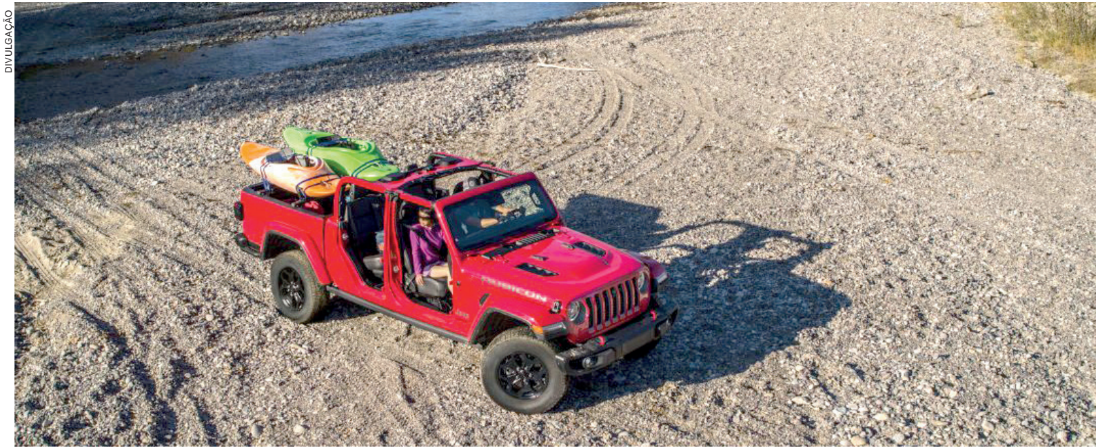
A Jeep vai redefinir os limites da aventura entre as picapes no Brasil com muita tecnologia, força e soluções inéditas ao segmento

A Gladiator repete os atributos já consagrados da marca e adiciona a versatilidade de uma picape para oferecer ainda mais possibilidades de aventura e ser a nova referência do segmento 4x4.