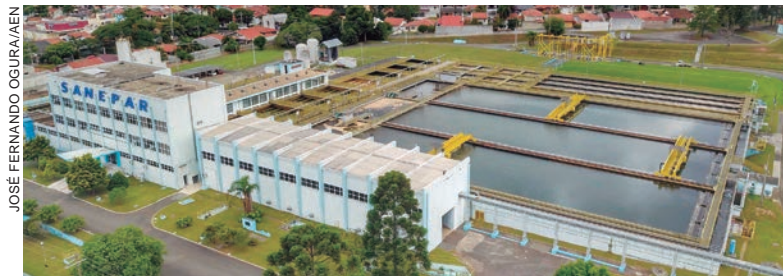
EMPRESA cumpre rigorosamente o cronograma do Planejamento Plurianual de Investimentos de R$ 1,7 bilhão de investimento para 2022

Com esses valores, a Sanepar cumpre rigorosamente o cronograma do Planejamento