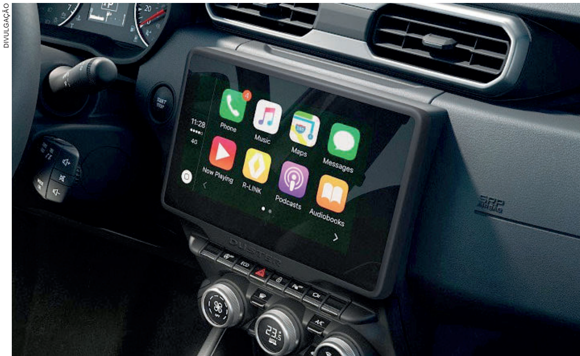
Sistema permite a conectividade sem fio de smartphones por meio do Android Auto e Apple CarPlay

O sistema possui ainda layout personalizável, conexão via Bluetooth e informações como temperatura externa e horário direto na tela. Para auxiliar o condutor na economia de combustível e no monitoramento de suas viagens, a central mantém o Eco Scoring