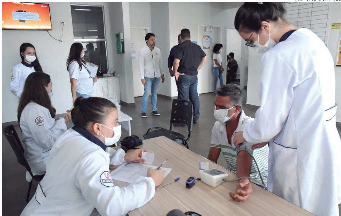
O programa estrutura modelo de financiamento focado em aumentar o acesso das pessoas aos serviços da atenção básica

O repasse de transferências do Ministério da Saúde aos municípios passa a ter como