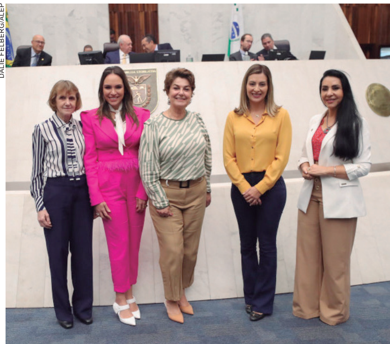
CONFORME o projeto de resolução, a bancada feminina terá a participação de todas as deputadas da Casa, independentemente de partido

Se o projeto for aprovado, além dos votos conjuntos, as deputadas terão mais poder administrativo. Elas poderão, por exemplo, indicar membros para as Comissões da