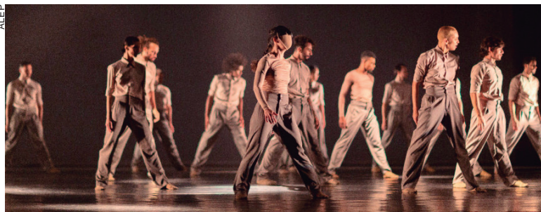
A audiência pública será uma oportunidade para que o setor possa ter 'voz' frente à política pública que vem sendo adotada no Estado

Na pauta, temas como a situação do Teatro Guaíra e dos corpos artísticos vinculados, o orçamento do PalcoParaná, as possíveis irregularidades identificadas pelo controle social na gestão da Cultura do Paraná, medidas tomadas pela sociedade civil em relação à retomada das atividades, a aplicação da Lei Aldir