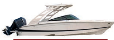
1º Prêmio: Lancha motorboat Evinrude 225

Sorteio 30/11/2022 pela extração da Loteria Federal