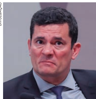
REPRESENTAÇÃO aponta que a filiação do ex-ministro foi feita no diretório paulista do União Brasil e não no paranaense