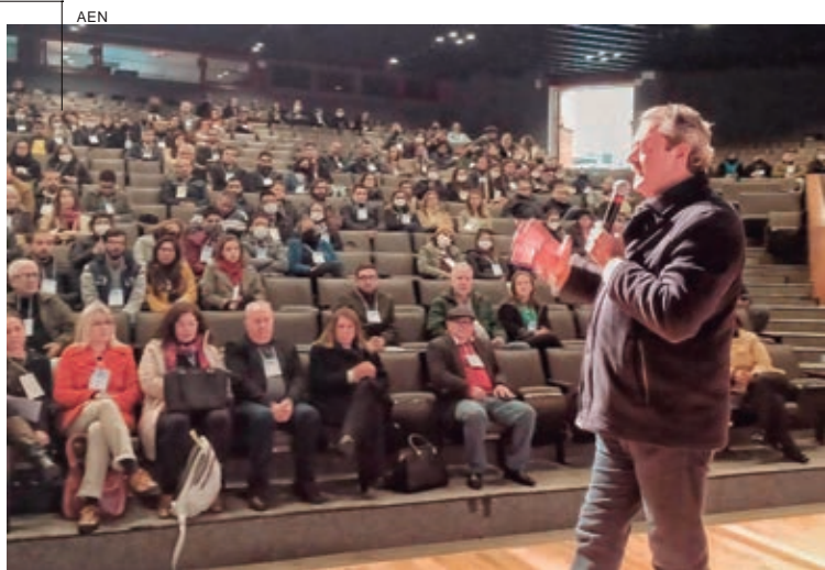
Novos servidores do Instituto Água e Terra (IAT) participam de um evento de integração em Curitiba, onde foi apresentada a estrutura do órgão. A capacitação é uma das maneiras de atualizar os servidores já ativos com relação a normativas publicadas que atualizam a legislação em diversas áreas. Participam todos os convocados a iniciarem a nova jornada como agentes públicos do Governo do Estado das 21 regionais do IAT. São servidores das áreas de técnico de manejo e meio ambiente, engenharia químico, engenharia florestal, engenharia agrônoma, geologia, biologia, química, engenharia civil, sociologia, geografia, arquitetura e medicina veterinária. Os 105 novos funcionários da entidade tomaram posse em abril.

Foram coletadas 38 amostras, das quais 26% apresentaram índices de agrotóxicos fora do padrão, com valores acima do Limite Máximo de Resíduo (LMR) permitido pela Agência Nacional de Vigilância Sanitária (Anvisa) ou proibido na modalidade de uso para a cultura. O principal ingrediente ativo detectado nas amostras fora do padrão foi o glufosinato, representando 80%. Esse produto é autorizado para dessecação pré-colheita. Das amostras que apresentaram glufosinato, 20% também apresentaram glifosato, com LMR acima do permitido, indicando mistura de tanque para dessecação. Também foi observada a presença do acefato, autorizado no controle de pragas, representando 10% das amostras fora do padrão. Todos os produtores flagrados em ações que não respeitam as normas legais foram autuados pela Adapar e tiveram os processos remetidos para o Ministério Público.