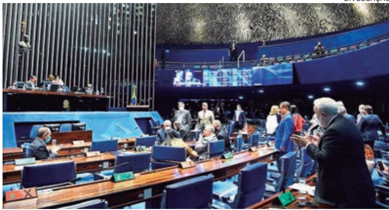
SENADORES governistas argumentam que mudança diminui preços para o consumidor final, ajudando no controle da inflação

O relator Fernando Bezerra Coelho (MDB-PE) complementou seu relatório analisando todas as 77 emendas apresentadas no Senado. Ele acolheu quatro emendas de maneira integral e outras nove