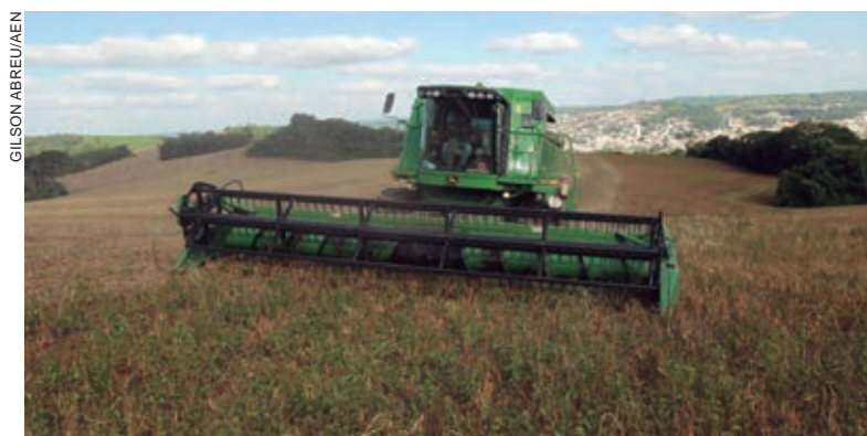
SEGUNDO relatório do Deral, na primeira safra da cultura entre 2018 e 2019, Umuarama produziu 152 toneladas

Analisando as hipóteses para o índice de contaminação, foi identificada a antecipação da dessecação, na qual o agrotóxico pode estar sendo aplicado ainda com a planta toda verde, sendo que a recomendação para uso de glufosinato é para quando a cultura estiver com 50% das vagens secas. “O adiantamento da dessecação pode ser um dos motivos de estarmos detectando resíduos em limites acima dos permitidos. Tudo indica que para a próxima safra o problema deve ser resolvido”, salientou Young Blood.