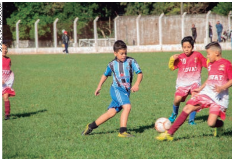
A próxima rodada do Interbairros Sub-11 será no domingo, 19, com os jogos disputados no estádio do distrito de Serra dos Dourados, a partir das 9h

A competição tem total apoio do prefeito Hermes Pimentel. A próxima rodada do Interbairros Sub-11 já tem data marcada. Será neste domingo, 19, com os jogos disputados