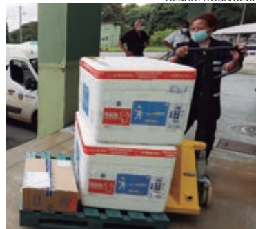
A nova remessa possui imunizantes para segunda dose e dose de reforço

As doses fazem parte das remessas enviadas pelo Ministério da Saúde na última semana. A Sesa aguarda ainda o recebimento de mais 640 mil vacinas nesta terça-feira (14), que deverão desembarcar no Estado entre o fim da manhã e o início da tarde.