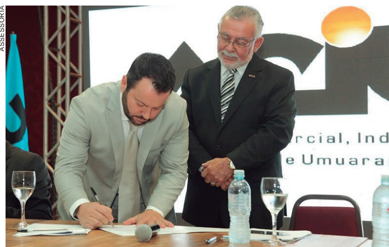
A cerimônia reuniu 300 convidados em uma festa que definitivamente já entrou para a história da entidade

“Especialmente por isso foi marcante. Novas e históricas parcerias saíram fortalecidas