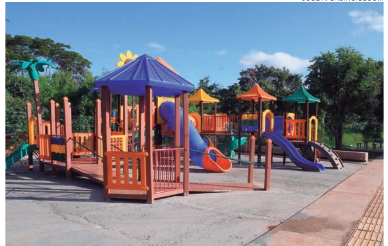
PARQUE urbano Jardim Ibirapuera já está em sua fase final e município já deu início ao processo de inclusão no programa

O parque conta com cercamento em gradil e pista de caminhada, rampas de acesso para cadeirantes, guias rebaxadas, plantio de grama, calçamento em concreto, drenagem