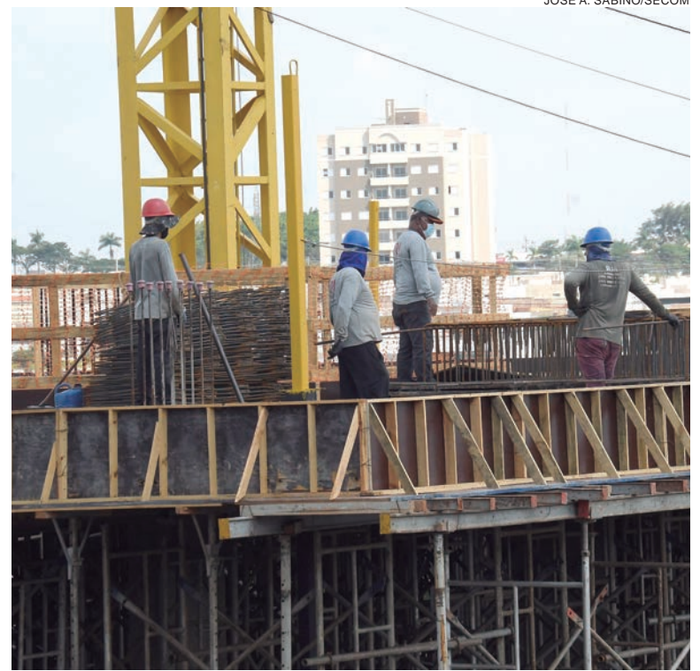
A Prefeitura aprovou 49.274 m 2 de obras em abril, incluindo ampliações, construções de moradias, estabelecimentos comerciais e um grande empreendimento imobiliário

O condomínio – com cerca de 21 mil m 2 de área construída – terá amplo espaço de lazer, quadras esportivas, piscina e outros atrativos. A construtora já tem o alvará para iniciar a obra e está iniciando a venda dos primeiros apartamentos.