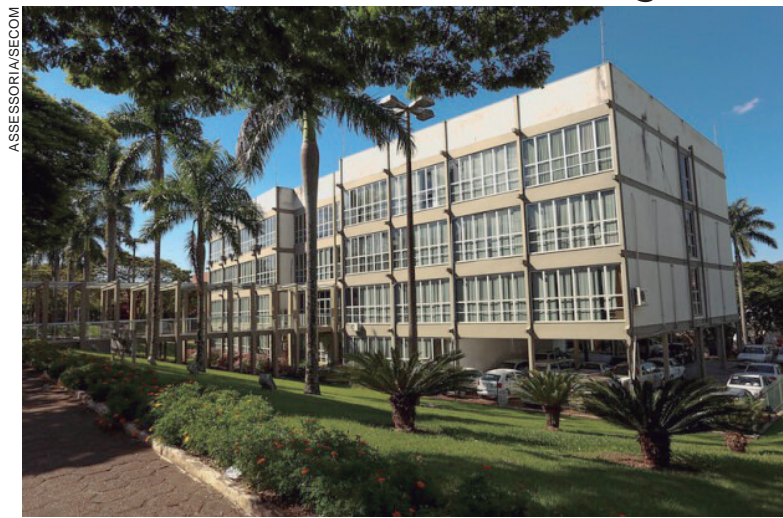
EQUIPES das secretarias do Município recebem curso preparatório para alterações que passam a vigorar em abril do ano que vem