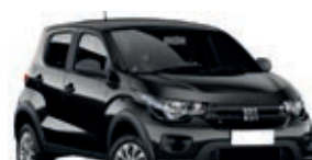
2º Prêmio: Fiat Mobi EASY 1.0 FLEX MANUAL, Ano 2021, Modelo 2022