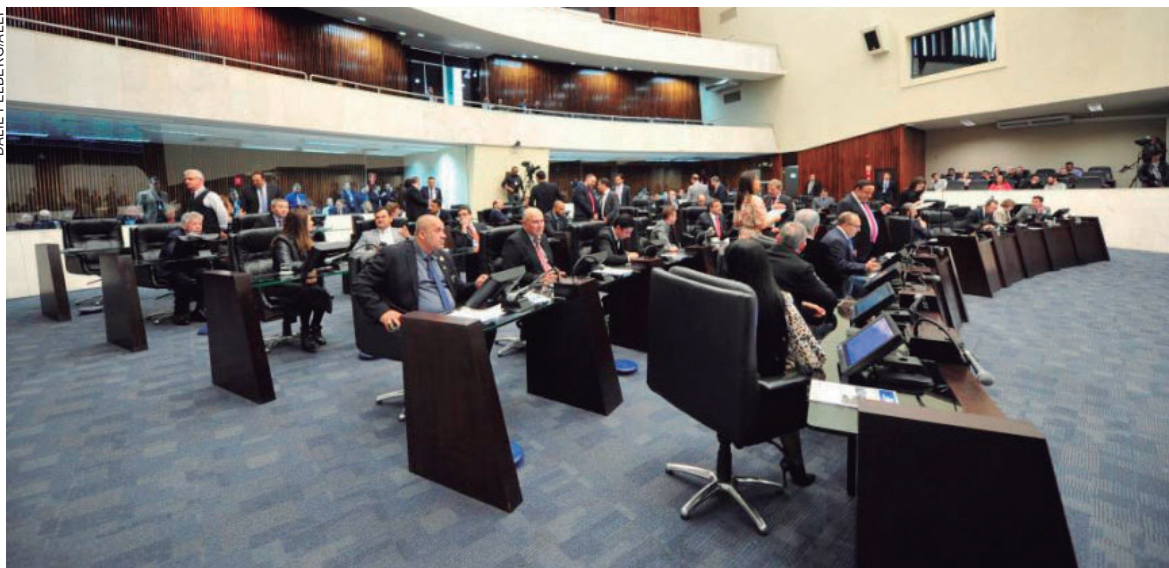
A proposta que passa a ser discutida em plenário na Alep, prevê o incentivo à formação e à capacitação de profissionais especializados

Deputados estaduais apresentaram, na última segunda-feira (27) na Assembleia Legislativa do Paraná (Alep), o projeto de lei 280/2022 que institui a Política Estadual de Proteção e Fomento dos Direitos da Pessoa com Fibromialgia. São sete diretrizes que podem balizar o tratamento no estado, entre elas, o atendimento multidisciplinar e a participação da comunidade na formulação de políticas públicas e o controle social da sua implantação, acompanhamento e avaliações.