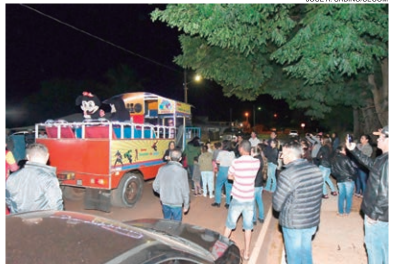
AL M do 'Trenzinho da Alegria' e atividades recreativas para a crian ada, o evento leva shows musicais e atendimentos   popula o

Ontem (28) o 'Prefeitura nos Distritos' foi at  Lovat, com o Trenzinho da Alegria e a distribui o de pipoca e algod o-doce, al m dos espet culos