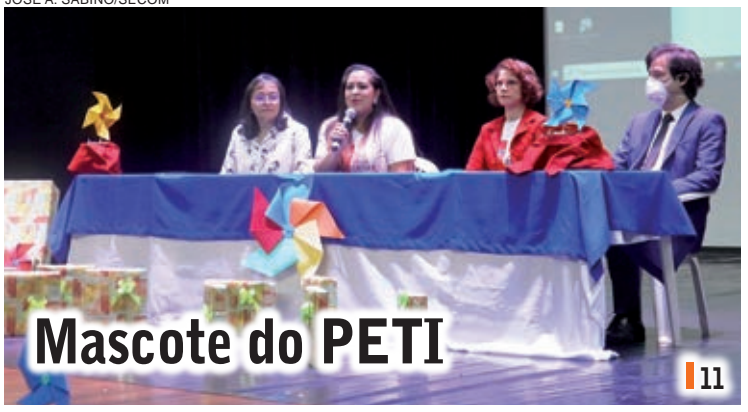
Mascote do PETI