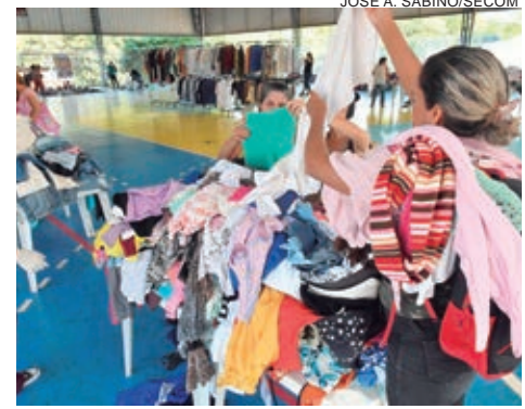
O 'brechó social' foi possível graças às doações da comunidade, realizadas nos pontos de coleta distribuídos em vários estabelecimentos