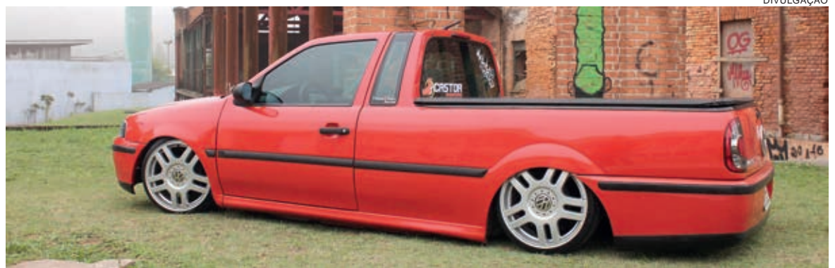
Veículos que passaram por modificações em suas características originais precisam da autorização prévia para transitar. PL quer acabar com esse processo