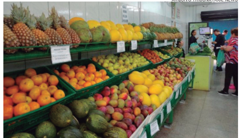
NA primeira etapa h  vagas para 82 pequenos agricultores que cultivem  rea m nima de 28 hectares. A terra ter  irriga o, acompanhamento t cnico e mudas selecionadas

A Prefeitura disponibilizar  servi o de hora/m quina para o preparo do solo, insumos (como calc rio) e mudas frut feras de alto padr o. O IDR/PR participar  com assist ncia t cnica e eventuais financiamentos, atrav s de programas estaduais. Os projetos de irriga o ficar o a