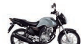
3º Prêmio: Motocicleta CG 160cc START - Ano/Modelo 2022