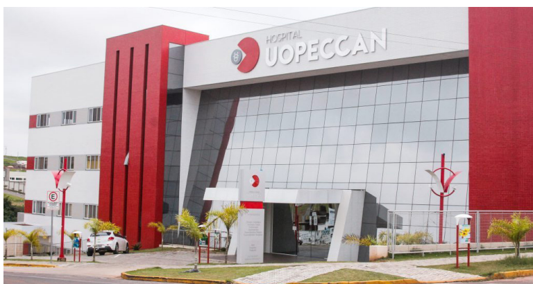
UNIDADE de combate ao câncer de Umuarama foi contemplada com R$ 20 mil no sorteio às entidades

O Paraná Pay também fez o sorteio dos credenciados no programa. Foram distribuídos 8 mil prêmios de R$ 100, totalizando R$ 800 mil. Os contribuintes que fizeram o aceite