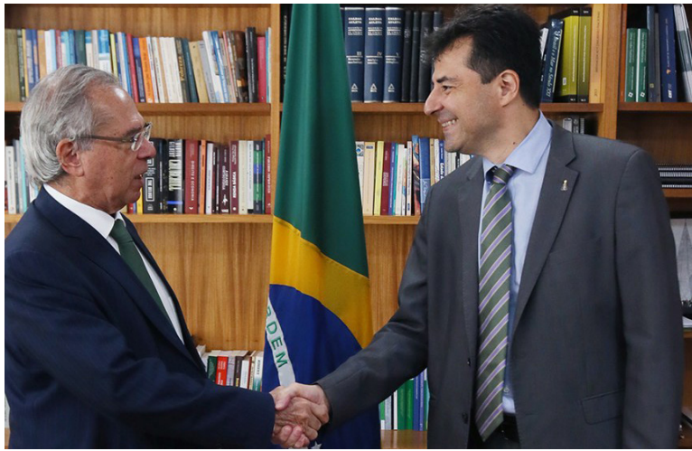
OS MINISTROS deverão prestar esclarecimentos à Comissão, na reunião marcada para terça-feira

A discussão dos requerimentos na CAE, em 20 de junho, foi marcada por duras críticas de senadores à política