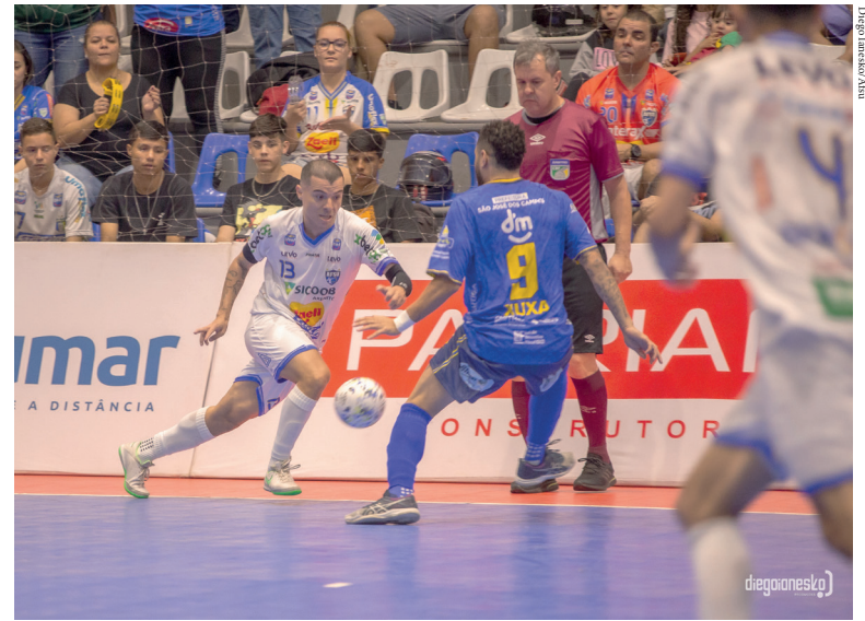
O PRÓXIMO jogo do Umuarama pelo Liga Nacional de Futsal será contra o Tubarão, em Santa Catarina no dia 15 de julho