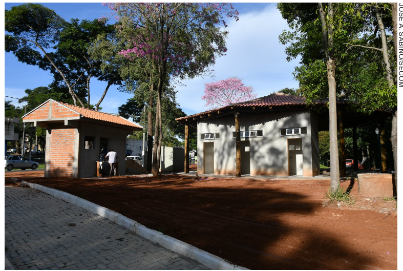
O PROJETO vai modernizar e valorizar o Bosque, muito utilizado para caminhadas e contato mais próximo com a natureza

A obra praticamente finaliza a revitalização do Bosque dos Xetá, executada pela administração municipal nos últimos anos, que contou com