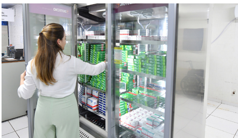
A CÂMARA é uma das mais modernas do mercado e possui um sistema de segurança com baterias que suportam até 24 horas sem energia elétrica

Como recomendado pelo Ministério da Saúde, a geladeira para medicamentos possui porta de visualização de conteúdo em vidro, alarme acoplado, freezer horizontal para condicionamento de bobinas de gelo reciclável e gerador de energia. “Ela foi adquirida após a realização de processo licitatório, com recursos do IOAF (Incentivo