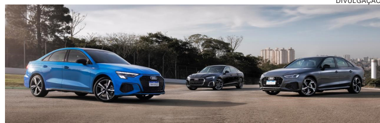
Veículos da Família Audi lançados no Festival Interlagos, que vai até domingo no Autódromo de Interlagos, em São Paulo

Com 28 anos de história e mundialmente respeitado por sua elegância e versatilidade, o Audi A4 chegou renovado ao país no final de 2020. O visual do modelo é moderno e sofisticado, com faróis em