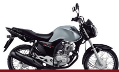
3º Prêmio: Motocicleta CG 160cc START - Ano/Modelo 2022