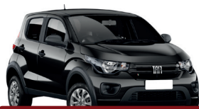
2º Prêmio: Fiat Mobi EASY 1.0 FLEX MANUAL, Ano 2021, Modelo 2022