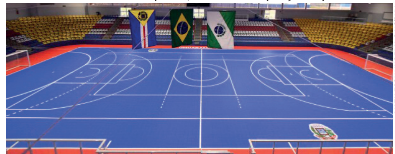
A FASE regional em Umuarama contemplou quatro modalidades: basquete, futsal, handebol e voleibol, nos naipes feminino e masculino

A sequência de cinco vitórias consecutivas da Seleção Brasileira masculina de vôlei na Liga das Nações chegou ao fim ontem (8), na terceira e última semana da primeira fase, com jogos em Osaka, Japão. O Brasil foi derrotado pela França, atual campeã olímpica, por três sets a zero (21/25, 22/25 e 21/25). Os brasileiros aparecem em sexto lugar na classificação, com 21 pontos e sete vitórias após 11 jogos. A seleção – comandada por Renan dal Zotto – está garantida por antecipação no mata-mata e volta à quadra no domingo (10), às 7h10, para encarar o Japão, quinto colocado, pela última rodada. Uma vitória diante dos anfitriões pode tirar o Brasil do caminho de rivais como Polônia, Itália, Estados Unidos e a própria França nas quartas de final.