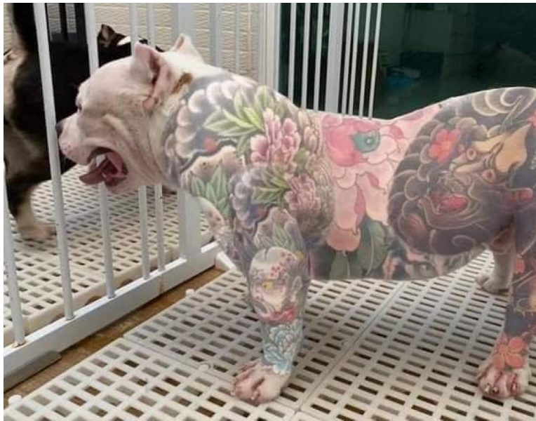
A LEI já está em vigor no Paraná, enquanto o Senado Federal ainda debate a proibição de tatuagens e a colocação de piercings em animais domésticos no País

A lei, que teve por objetivo diminuir os maus-tratos aos animais, pois os procedimentos deste tipo em um animal de estimação apenas satisfazem as preferências estéticas de seus donos, causando dores inúteis aos bichos, determina ainda que nos locais em que tais serviços sejam realizados, devem conter comunicados aos clientes sobre a proibição da realização em animais. Caso haja o descumprimento da lei, o infrator estará sujeito a perda da guarda do animal, além da proibição de obter a