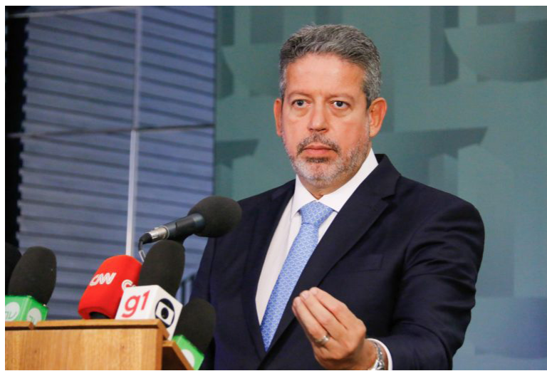
SEGUNDO LIRA , medidas para elevar a renda da população, garantido o respeito às contas públicas, deverão ser discutidas na elaboração do Orçamento da União

Segundo ele, medidas para elevar a renda da população, garantido o respeito às contas públicas, deverão ser discutidas na elaboração do Orçamento da União para 2023. A proposta do Poder