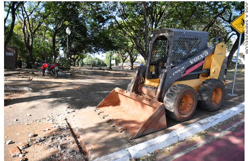
A EMPREITEIRA implantará calçamento em paver com rampas para cadeirantes, conjuntos de mesas, bancos e lixeiras novos, e substituirá louças e portas dos sanitários

Desde que assumiu o cargo, o prefeito Hermes Pimentel garantiu a continuidade das obras que estavam em andamento. Ele vê as praças como importantes pontos de encontro, lazer e convívio para a população. “Estamos adequando alguns pontos – como a passagem da ciclovia nas praças da Rio Grande do Norte – e