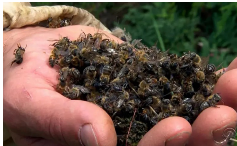
NA CONTA de um dos produtores atingidos, pelo menos 1,5 milhão de abelhas morreram nos últimos dias

Os apicultores estão se reunindo para denunciar o provável crime ambiental e exigir seus direitos. (Colaboração – Obemdito)