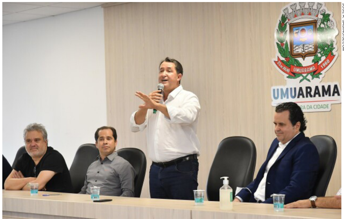
PROJETO completo será encaminhado à Secretaria Especial das Zonas de Processamento de Exportação do Ministério da Economia