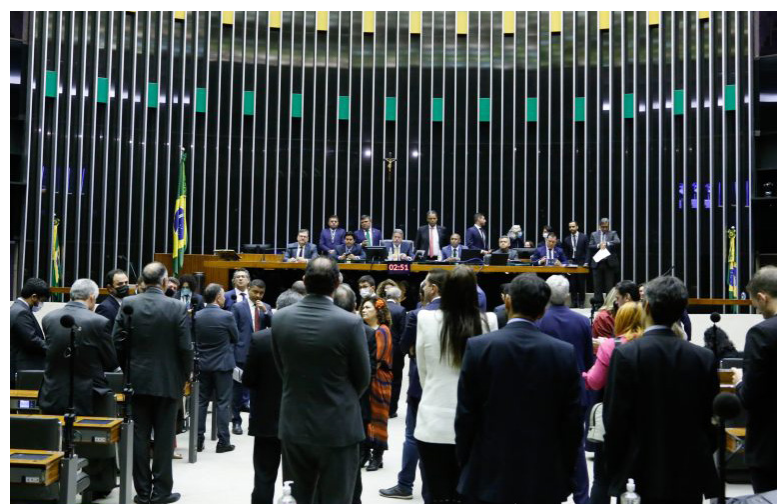
A EXPECTATIVA é de que a proposta dê maior autonomia aos trabalhadores na movimentação de seus recursos

Com a aprovação da urgência, a proposta poderá ser analisada diretamente pelo Plenário sem precisar passar antes pelas comissões permanentes.