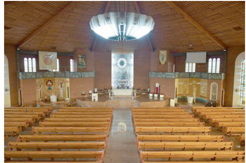
SÃO oferecidas vagas gratuitas para aperfeiçoamento aos profissionais e empreendedores das áreas relacionadas ao atendimento de visitantes do turismo religioso

As vagas serão destinadas a colaboradores das empresas do trade turístico de Umuarama (bares,