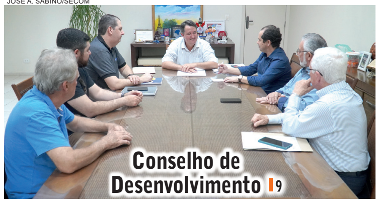
Conselho de Desenvolvimento | 9