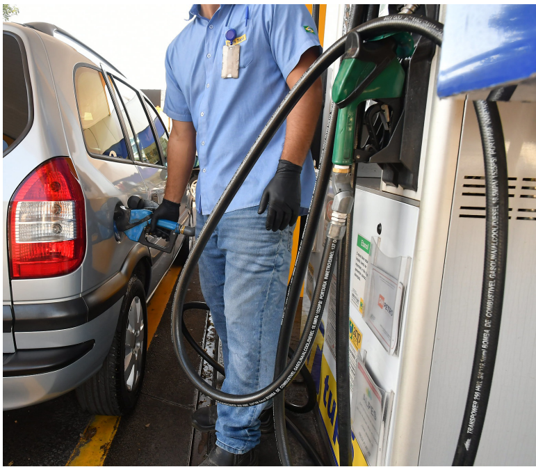
A GASOLINA mais barata na cidade é encontrada a R$ 5,57 e a mais cara a R$ 6,19, uma diferença de 11,1%

Já o diesel mais em conta é encontrado a R$ 7,06 e o mais caro a R$ 7,69, uma diferença de 8,9%. “Diante desses dados, é válido indicar que continua sendo melhor abastecer com gasolina, já que a autonomia do carro é 30% menor com etanol e, para ser vantajoso, sua utilização o preço do litro precisa também ser 30% menor – e no caso de Umuarama a diferença é de 22,9%”, pontua Bitencourt.