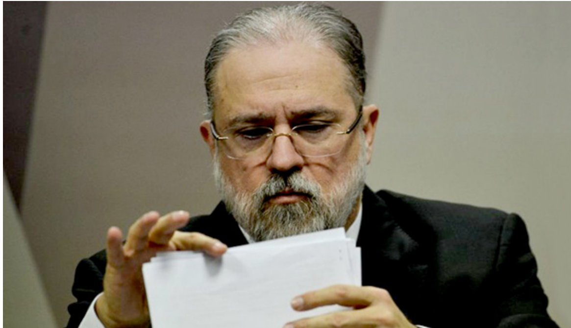
O ATO foi assinado em maio pelo procurador-geral da República, Augusto Aras, e passa a valer a partir de agora

O Conselho Nacional do Ministério Público (CNMP) criou um benefício que pode aumentar em até R$ 11 mil o salário dos procuradores da República. O ato foi assinado em maio pelo procurador-geral da República, Augusto Aras, e passa a valer a partir de agora.