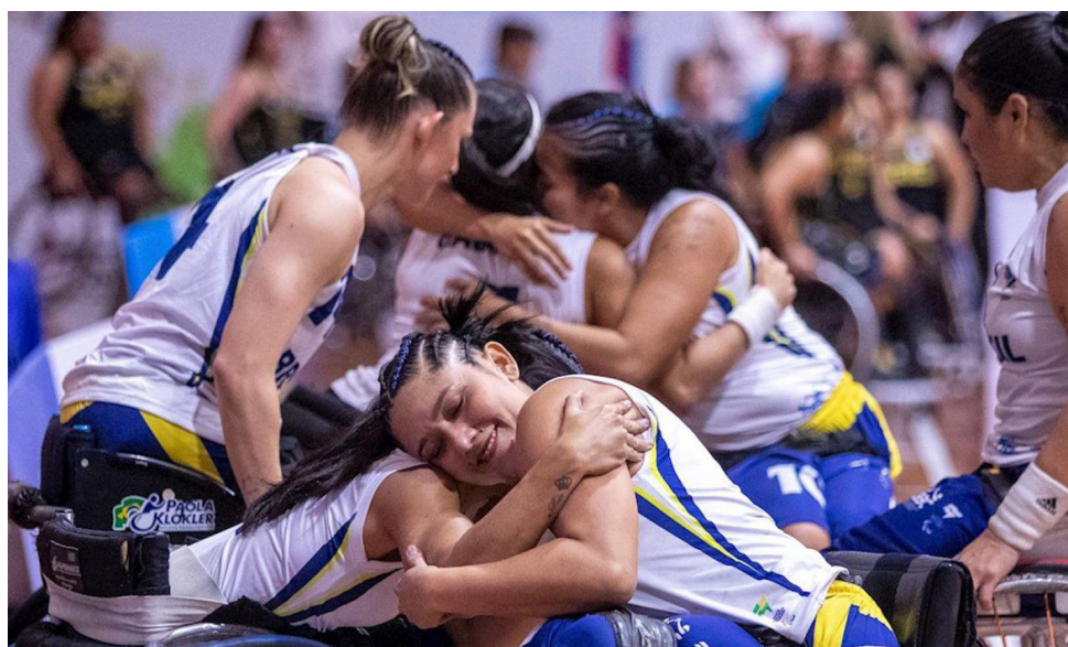
CLASSIFICAÇÕES foram asseguradas durante a Copa América, em São Paulo

Na briga por vaga na final da Copa América, no domingo, o Brasil foi batido pelos EUA (59 a 77). Antes do mata-mata, os brasileiros haviam ficado em segundo lugar no Grupo B, com uma vitória sobre o Canadá na estreia (66 a 52) e uma derrota para a Argentina (38 a 53).