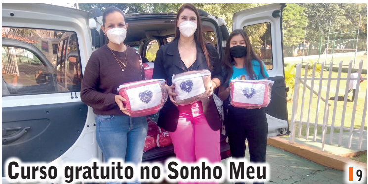
Curso gratuito no Sonho Meu