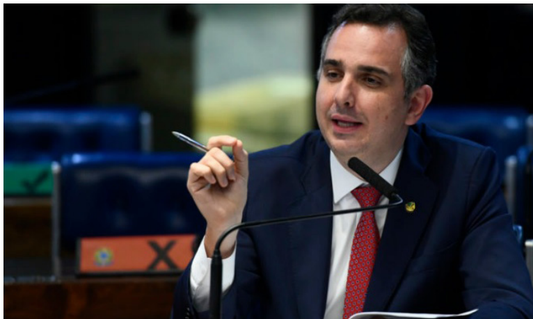
“COM tais medidas, objetiva-se combater efeitos inflacionários suportados pelos brasileiros”, disse Pacheco

A PEC 15/2022 foi apresentada para estabelecer um diferencial de competitividade para os biocombustíveis. O texto foi aprovado com parecer favorável em junho e seguiu para a Câmara dos Deputados. Lá, o texto foi turbinado com a PEC 1/2022, que passou no Senado no último dia de junho. A proposta abriu espaço para a instituição do estado de emergência até o final do ano para ampliar o pagamento de benefícios sociais e criar auxílios