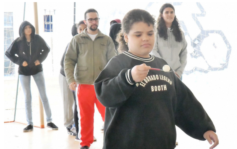
O PRIMEIRO grupo de jovens iniciou as atividades às 9h e permaneceu no Ceju até perto das 11h

Os participantes recebem um café da manhã reforçado, antes das atividades, e um lanche no período da tarde. O Ceju também oferece transporte para os que residem em bairros mais afastados.