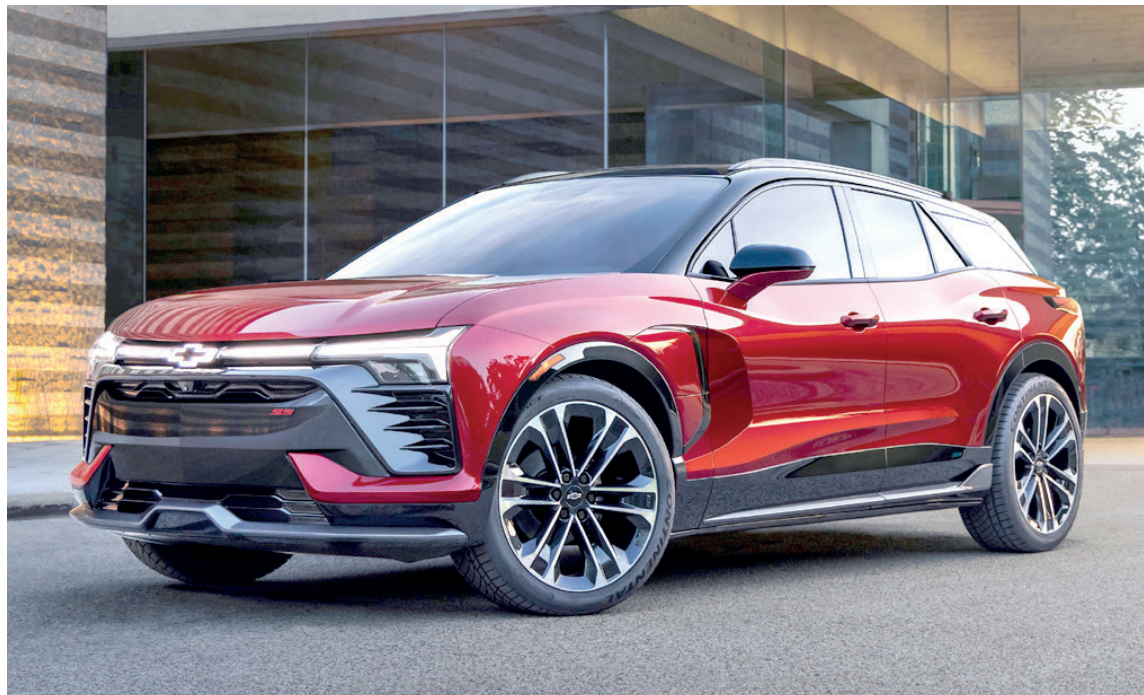
A Blazer EV é uma das opções de veículos elétricos da Chevrolet para o Brasil

Existem diferentes maneiras de medir o impacto do uso de um automóvel em relação ao aquecimento global. Para especialistas, a melhor maneira de calcular a emissão de um automóvel é somando os gases que o veículo emite pelo escapamento mais o impacto que a produção do seu combustível provoca no meio ambiente. É a famosa equação “do poço à roda”.