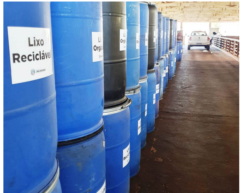
O GRUPO de Ação Ambiental do Rally dos Sertões já chega também com a responsabilidade de dar a destinação correta aos materiais