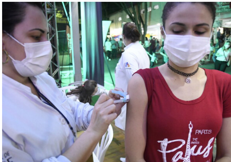
O PROGRAMA de Imunização terá cronograma especial para o Rally dos Sertões, que começa às 19h e vai até às 22h da sexta. No sábado, começa às 10h e vai até às 18h

(27) a vacinação começa às 10h e vai até às 18h, também com imunizantes contra influenza, paralisia infantil e covid-19. “Teremos vacinas pediátricas, para crianças, adolescentes, adultos, imunossuprimidos. E lembrando que as vacinas segundo reforço [quarta dose] são disponibilizadas para pessoas que tenham 35 anos completos e acima dessa idade, além de profissionais de saúde e trabalhadores da coleta de resíduos”, explica.