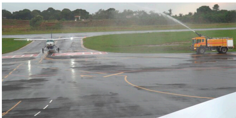
O AEROPORTO tem voos comerciais três vezes por semana num Cessna Gran Caravan, da Azul Linhas Aéreas. A expectativa é o início das atividades do ATR-72, com capacidade para até 72 passageiros

A empresa seguiu explicando: “A Certificação Operacional é um dos processos que iniciamos ao assumir a gestão do Aeroporto em primeiro de março deste ano, com o objetivo de definir as especificações operativas do aeroporto, caracterizando, com base na infraestrutura existente, os tipos de operações possíveis, atestando que o aeroporto está em condições plenas ao recebimento