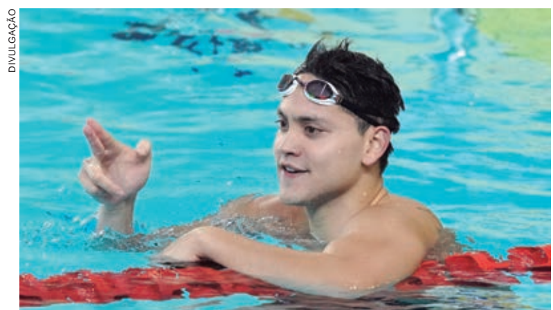
SCHOOLING, não terá mais liberação do serviço militar nacional para competir porque admitiu usar o entorpecente

O único ganhador de uma medalha de ouro olímpica por Singapura, o nadador Joseph Schooling, não terá mais liberação do serviço militar nacional para competir porque admitiu usar maconha, informou ontem (quarta-feira, 31) a cidade-Estado. Schooling, de 27 anos, que derrotou o norte-americano Michael Phelps para vencer os 100 metros borboleta nos Jogos Olímpicos de 2016, não testou positivo para a droga, mas admitiu usá-la no exterior no início deste ano, segundo o Ministério da Defesa. Singapura tem algumas das leis antidrogas mais duras do mundo, incluindo a pena de morte para traficantes, e não mostrou sinais de abrandar sua posição sobre a cannabis, mesmo que muitos países, incluindo a vizinha Tailândia, estejam se movendo para descriminalizar a droga. “Schooling não será mais elegível para licença