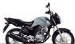
3º Prêmio: Motocicleta CG 160cc START - Ano/Modelo 2022