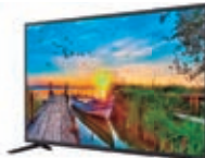
4º Prêmio: Televisor 43'