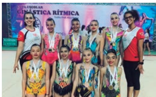
QUATRO das ginastas que estiveram em Marialva subiram nos mais altos degraus no pódio

Quatro das ginastas que estiveram em Marialva subiram nos mais altos degraus no pódio, com conquistas de 1º, 2º e 3º lugares, nas diferentes categorias disputadas. O aparelho do juvenil foi maças, que além do primeiro lugar individual, também foi coroado com o troféu de 1º lugar por equipe. (Colaboração – Obemedito)