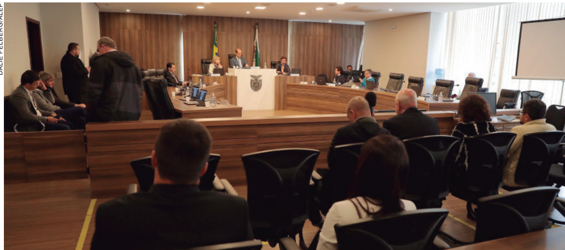
A aprovação foi em forma de substitutivo geral com 65 emendas dos parlamentares acatadas, entre as 92 propostas

A Comissão de Orçamento da Alep aprovou parecer favorável do relator ao projeto de lei que define diretrizes orçamentárias do Estado para o exercício fiscal de 2023. A previsão de receitas para o ano que vem é de R$ 58,2 bilhões.