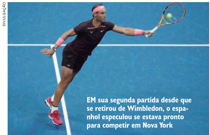
EM sua segunda partida desde que se retirou de Wimbledon, o espanhol especulou se estava pronto para competir em Nova York

“A primeira partida aqui em Nova York depois de três anos, sessão noturna, é sempre emocionante. Sim, passei por um momento difícil”, disse Nadal. “Segundo jogo em cerca de 50 dias. De certa forma, não era o dia para jogar de forma perfeita. É um dia para fazer o trabalho, e foi o que fiz”.