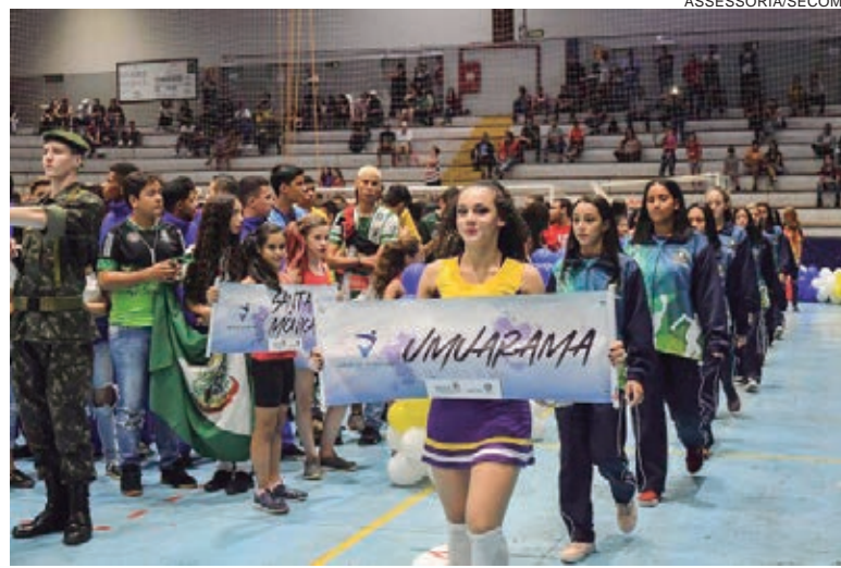
A cidade foi eleita pela Secretaria da Educação e do Esporte e pela Superintendência Geral do Esporte para receber a fase final dos 36º Jojups

Neste ano, a 34ª edição teve 12 cidades-sede (Campo Largo, Carambeí, Santa Mariana, Centenário do Sul,