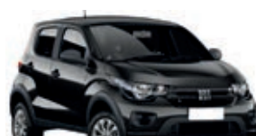
2º Prêmio: Fiat Mobi EASY 1.0 FLEX MANUAL, Ano 2021, Modelo 2022