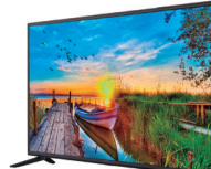
4º Prêmio: Televisor 43'