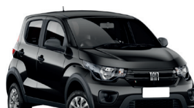
2º Prêmio: Fiat Mobi EASY 1.0 FLEX MANUAL, Ano 2021, Modelo 2022