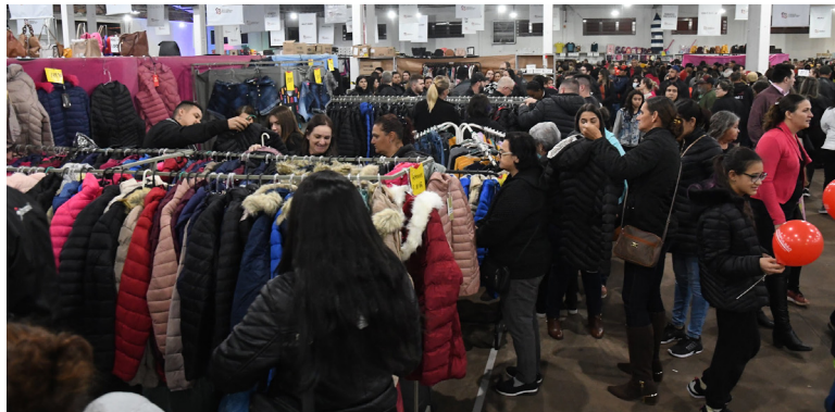
CERCA de 45 mil pessoas passaram pelo local e aproveitaram descontos, que em muitos casos superaram 70%

Os organizadores identificaram visitantes de cidades de várias regiões do Paraná e também de Estados vizinhos,