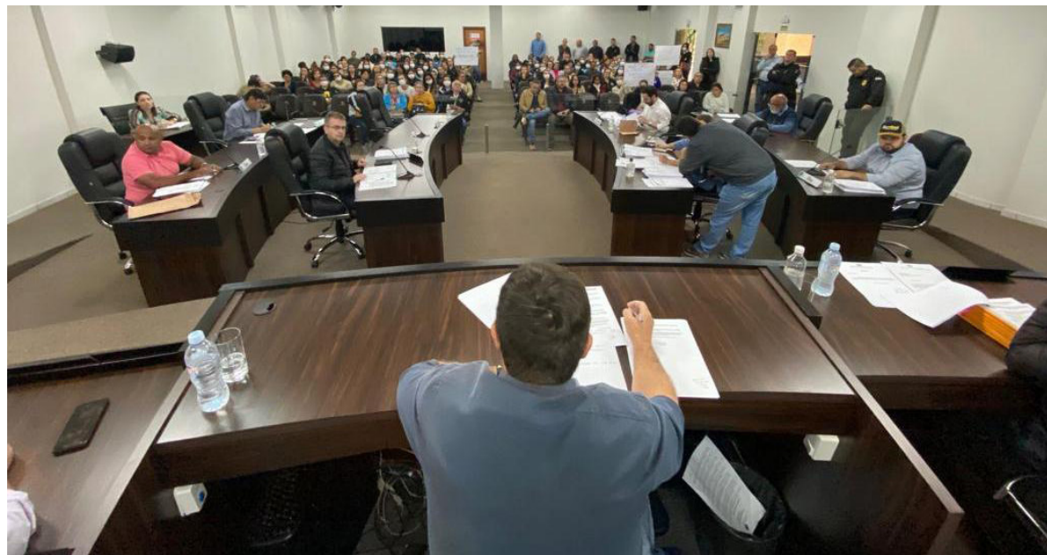
ALTERAÇÕES na Lei Orgânica do Município e no Regimento Interno da Câmara podem liberar reeleição para presidente do Legislativo

Primeiro, para alterar o Regimento Interno, basta um projeto de resolução. Este foi publicado ontem, em sessão ordinária, para conhecimento