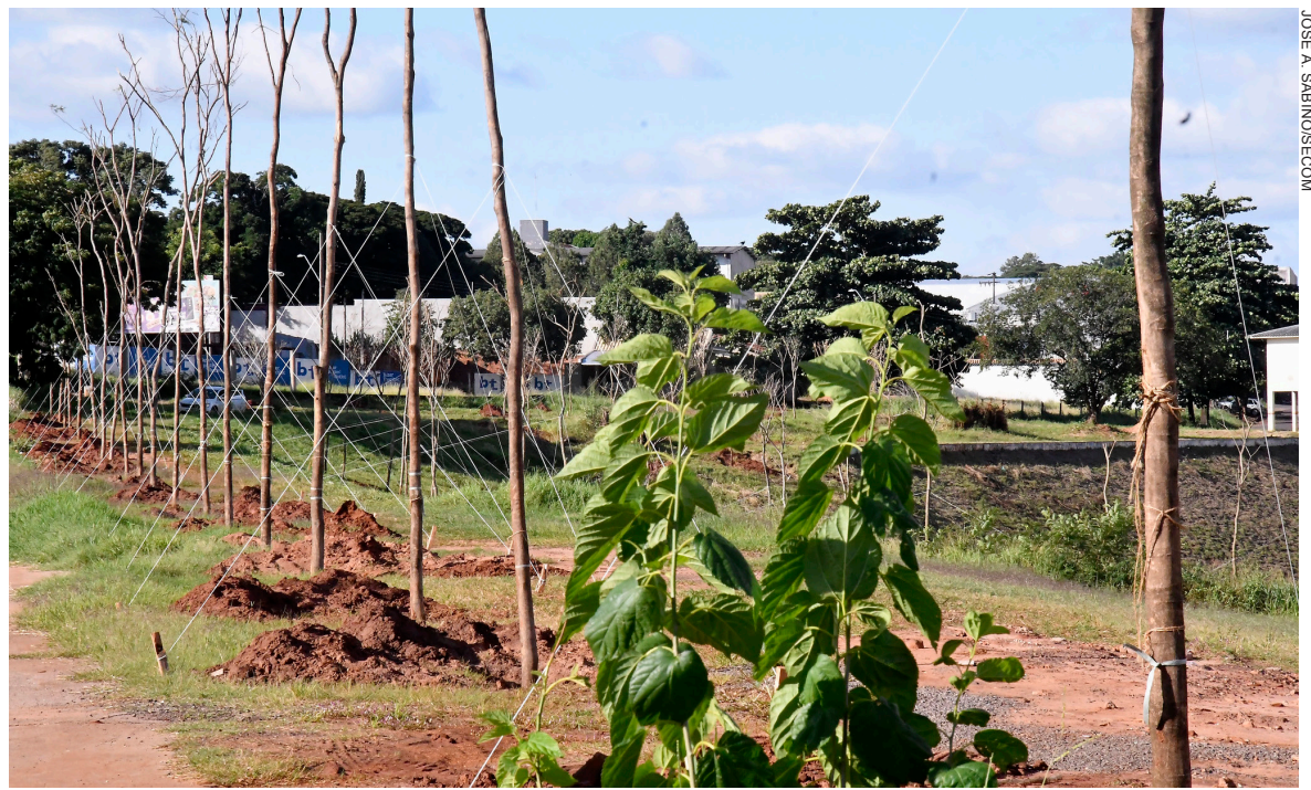
HOJE será realizado o plantio de 40 mudas, em comemoração ao Dia Nacional do Campo Limpo, comemorado no Brasil desde 2008