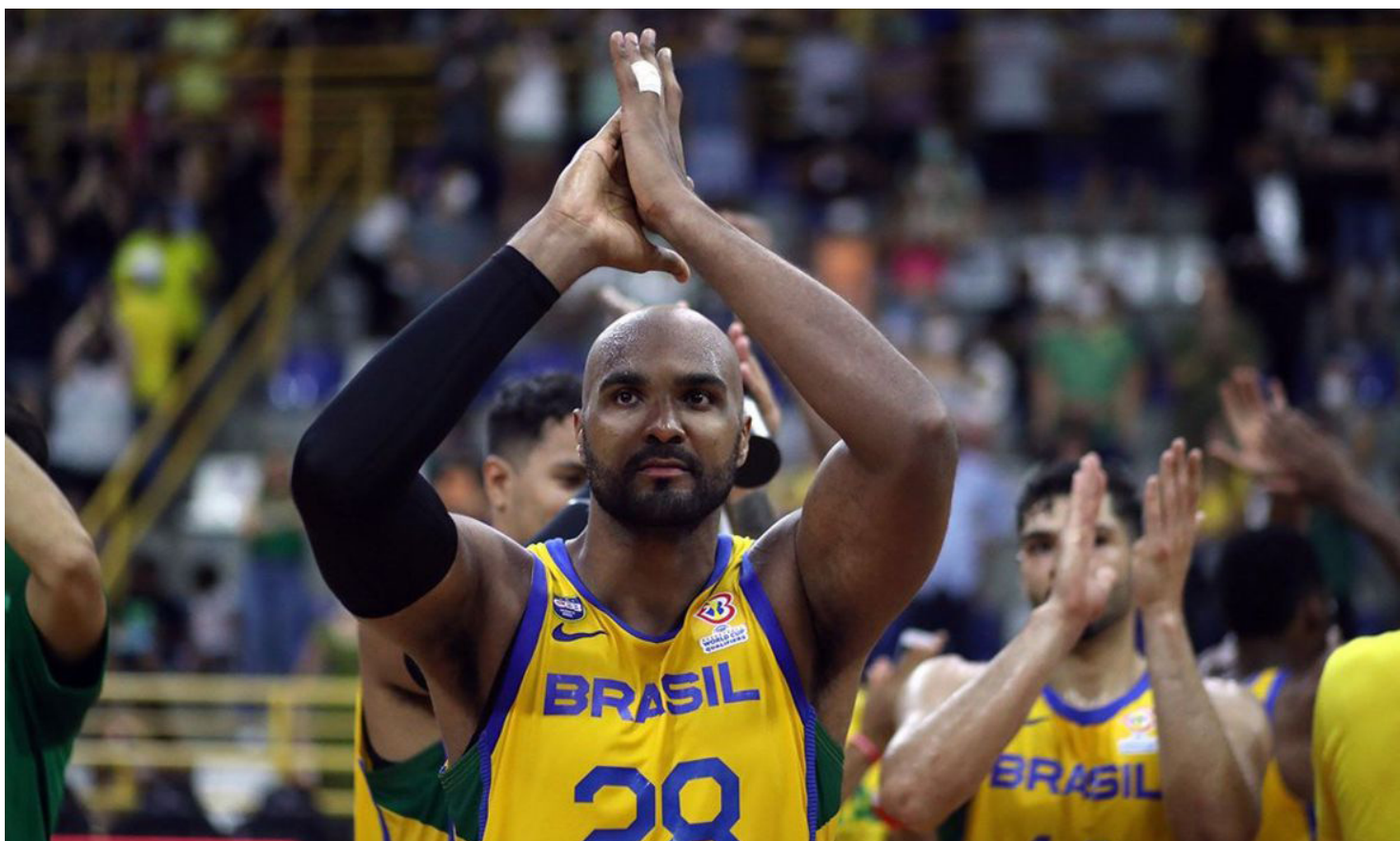
DA lista de 13 atletas convocados ontem (22) por Gutavo De Conti, técnico da seleção, 12 serão relacionados para o embate contra os portorriquenhos

O formato do torneio estabelece partidas dentro e fora de casa. Na