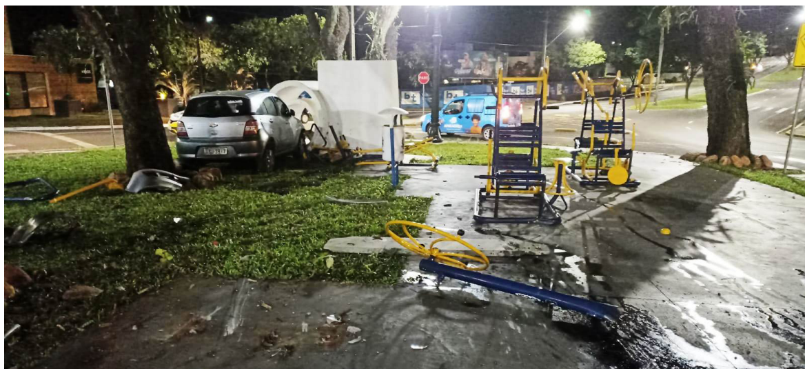
VEÍCULO invadiu a praça e destruiu parte da ATI instalada, só parando após colidir contra uma estrutura de concreto

Esse Exercício é mais uma ação da Polícia Militar para capacitar seu efetivo e preparar os policiais para lidarem com as mais diversas situações de risco à vida.