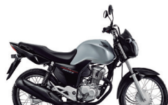
3º Prêmio: Motocicleta CG 160cc START - Ano/Modelo 2022