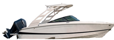
1º Prêmio: Lancha motorboat Evinrude 225

Sorteio 30/11/2022 pela extração da Loteria Federal