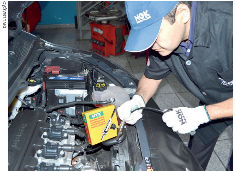
PEQUENAS falhas podem elevar o consumo de combustível e a emissão de gases poluentes, acarretando no aumento dos impactos ambientais

A garantia de níveis menores de emissão nos veículos está diretamente ligada ao funcionamento correto do motor, respeitando os padrões de calibração. “Os problemas nos sistemas de ignição e injeção, além de afetar as emissões, impactam diretamente no consumo de combustível”, conta Mori. O especialista da NGK ressalta que muitas oficinas possuem equipamento