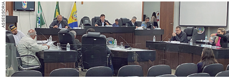
PROPOSTA foi aprovada em sessão extraordinária e agora, como Lei, aguarda sanção do prefeito para que a obra possa sair do papel

Foi aprovado por unanimidade em sessão extraordinária por vereadores de Umuarama, um projeto de lei de autoria do Poder Executivo, que autoriza a realização de aquisição onerosa de imóveis, para implantação de uma via pavimentada de transposição entre os Jardins Aeroporto II e Santiago no Município de Umuarama.