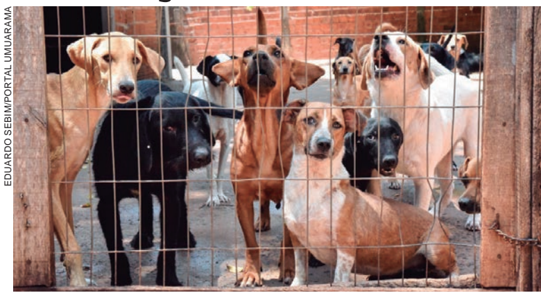
A iniciativa se dá em razão da necessidade que a cidade tem em contribuir para o fornecimento de rações para centenas de cães e gatos acolhidos pela entidade

Foi aprovado em segundo e definitivo turno de votação na Câmara, um projeto de Lei Ordinária, que prevê o repasse de R$ 150 mil para a Associação de Amparo aos Animais de Umuarama (Saau). O texto, de autoria do Poder Executivo Municipal, foi discutido na sessão ordinária da última segunda-feira pelos vereadores que o aprovaram por unanimidade.