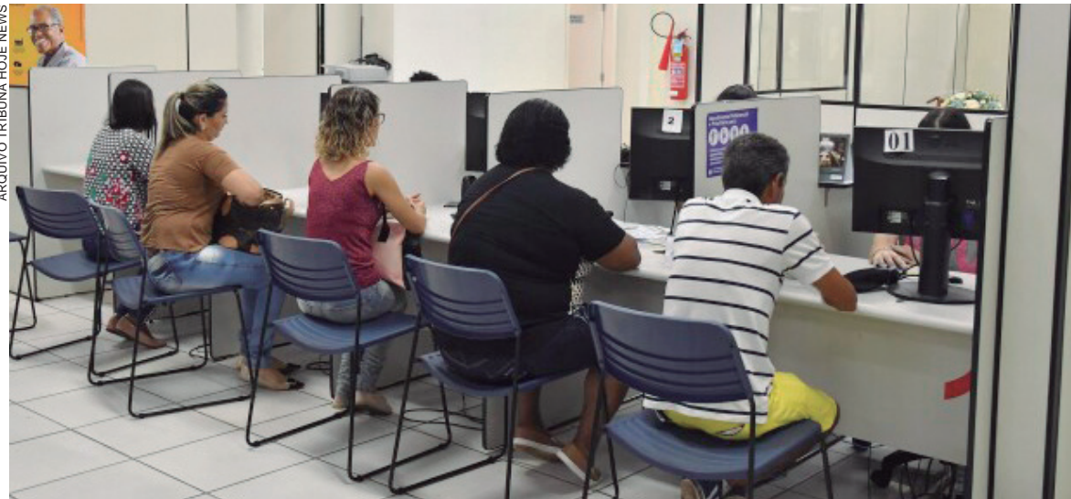
ALÉM de conquistar o 25º no Brasil, a agência do trabalhador de Umuarama ficou em 9º lugar no Paraná

E acrescentou: "Além disso, temos oferecido cursos de qualificação em diversas áreas, adquiridos pelo município e em parceria com instituições de ensino técnico e profissionalizante, que refletem diretamente