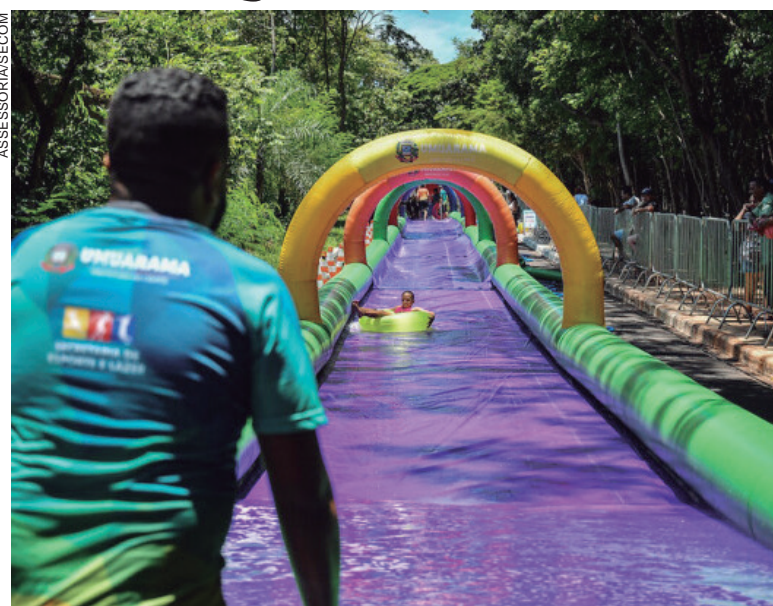
NA quarta (12), a festa será no Bosque Uirapuru, com toboágua de 70 metros entre 13h e 17h, que será instalado no espaço entre o bosque e o Estádio Lucio Pipino

Na quarta (12), a festa será no Bosque Uirapuru, que vai receber o toboágua de 70 metros entre 13h e 17h, que será instalado no espaço entre o bosque e o Estádio Lucio Pipino. "Também teremos uma