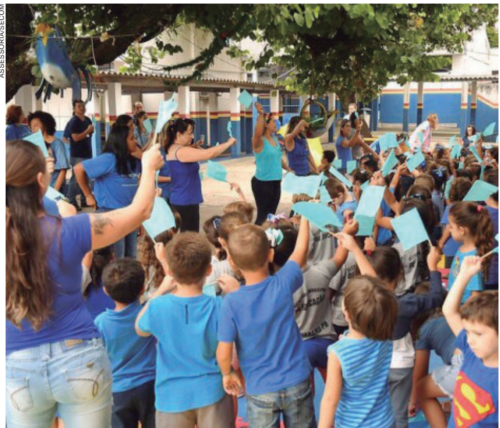
NO lugar das sirenes comuns, nos horários de início e término das aulas, outros tipos de toques serão usados, tais como trechos de músicas ou de poesias

De autoria do vereador Cleber Marcos Nogueira, o Clebão dos Pneus, legislação indica que as sirenes comuns, nos horários de início e término das aulas, bem como em outras ocasiões em que seja necessária a utilização de sinais sonoros para alertar ou comunicar algo aos alunos, devem ser substituídos por outros tipos de toques, tais como trechos de músicas ou de poesias, entre outros.