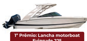
1º Prêmio: Lancha motorboat Evinrude 225

Sorteio 30/11/2022 pela extração da Loteria Federal