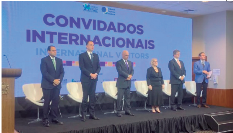
ROSA Weber participou da abertura do programa de observadores e convidados internacionais para as eleições gerais deste ano, promovido pelo TSE

“Em tempos turbulentos como os atuais, mais do que nunca se há de proclamar a irrestrita confiança que devotamos à Justiça Eleitoral quanto à integridade das eleições e à legitimidade dos resultados eleitorais. Estamos certos da atuação sempre firme do TSE a assegurar que nada tumultue a escolha livre e consciente dos cidadãos brasileiros do que entendam ser o melhor para o país, em absoluto respeito ao processo democrático, tal como ocorreu em 2018, quando, na