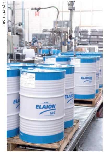
O óleo usado nos motores híbridos proporciona economia e redução de emissão de poluentes na atmosfera

Nas motorizações híbridas, o óleo lubrificante percorre todas as partes do motor que são desenvolvidas para combustão, e cada montadora imprime exigências específicas