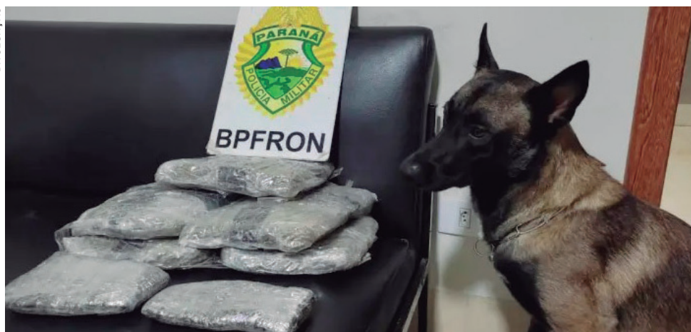
DROGAS estavam envoltas embaixo das roupas da mulher que foi descoberta pelo cão farejador da polícia

A mulher recebeu voz de prisão e foi encaminhada junto com a droga para a Delegacia de Polícia Civil de Umuarama.