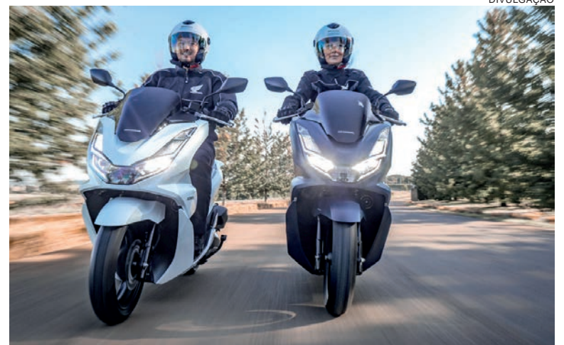
A scooter nº 1 do Brasil evoluiu em estilo e tecnologia através do motor eSP+ – enhanced Smart Power Plus, com cabeçote de quatro válvulas

válvulas arrefecido a líquido, que se vale da tecnologia eSP+ – enhanced Smart Power Plus –, conceito construtivo que explora a redução de atrito interno e outras tecnologias voltadas para otimização da eficiência. A potência máxima passou de 13,2 cv para 16 cv, com torque máximo subindo de 1,38 kgm.f para 1,5 kgm.f. O diâmetro do cilindro passou de 57,3 mm no motor de 150 cc para 60,0 mm no motor 160 cc. O curso foi reduzido de 57,9 mm para 55,5 mm. Já a taxa de compressão foi elevada de 10,6:1 para 12,0:1. Ao recorrer ao curso mais curto do pistão, conseguiu-se não apenas o espaço para as duas válvulas adicionais no cabeçote como