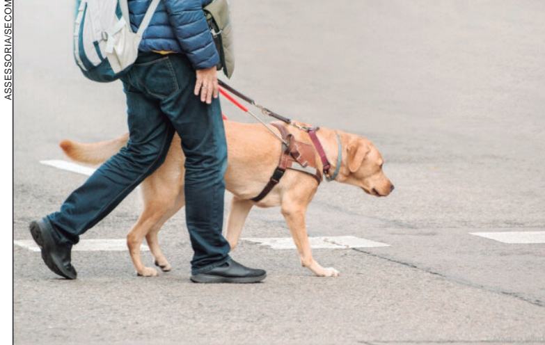
NOS estabelecimentos de sa de, por exemplo, a entrada do c o-guia para visita o de pacientes internados dever  considerar os crit rios definidos pelo estabelecimento

Qualquer ato direcionado a dificultar ou impossibilitar usufruir do direito previsto na lei vai configurar discrimina o, com penalidade administrativa de interdi o e multa nos termos do decreto federal 5.904/06. A norma define tamb m regras para identifica o do c o-guia ou de assist ncia, equipamentos necess rios (coleira, guia e arreo com al a) e adestramento do animal.