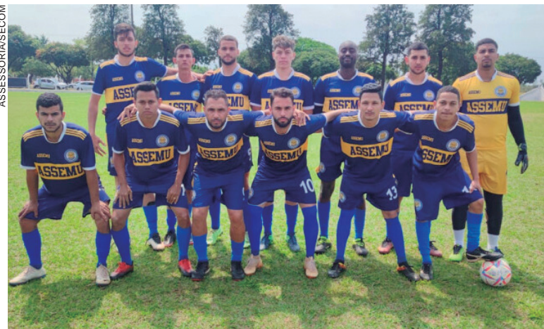
O time da Assemu faturou o segundo título desde que voltou às atividades no período pós-pandemia de coronavírus