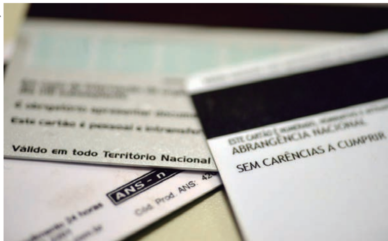
O procedimento deverá ter cobertura obrigatória por planos de saúde

As tecnologias também discutidas em reuniões técnicas