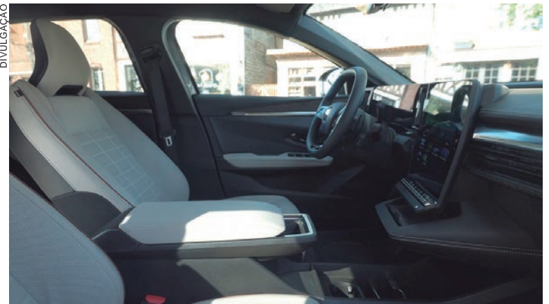
O Novo Mégane E-TECH Elétrico irá oferecer mais conforto sem alterar seu tamanho, mantendo as dimensões compactas do carro

Para isso, eles criaram um sistema de fixação no anteparo que cumpre a função de isolamento entre a cabine e o compartimento do motor.