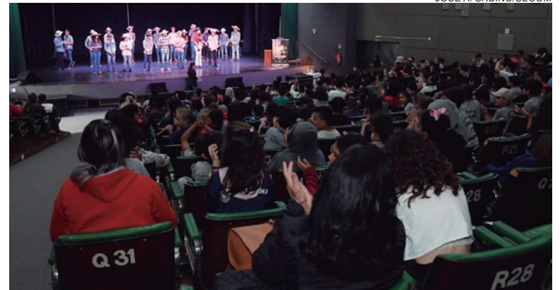
NO encerramento do projeto, crianças, adolescentes e idosos se reuniram no mesmo espaço, no centro cultural, para apresentações culturais e as considerações finais

Nas palestras realizadas nas escolas, as crianças também receberam gibis com histórias do personagem símbolo do município, o índio Umuaraminha e sua turma, criação do cartunista Marcos Vaz.