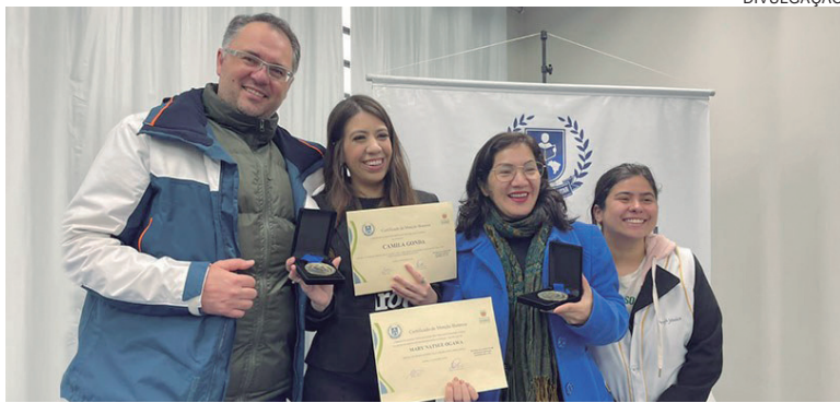
ENCONTRO , realizado no dia 26 de setembro, contou também com palestra que abordou a participação das mulheres na política

Ao final do evento, a EJE-PR, representada pela servidora Mary, e a palestrante