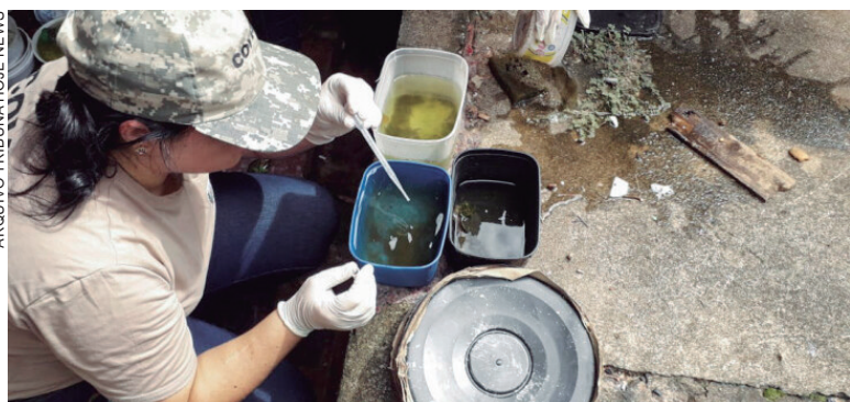
Os maiores volumes de positivos estão no Posto de Saúde Central e na UBS Vitória Régia (cinco em cada)

Dois casos de dengue foram confirmados ontem (sexta-feira, 30), no boletim semanal do Serviço de Vigilância em Saúde Ambiental e a Secretaria Municipal de Saúde aguarda, ainda, resultados dos exames de 29 pacientes que apresentaram sintomas semelhantes aos da doença. Umuarama acumula agora 32 casos positivos a partir de 1º de agosto, quando se iniciou um novo ano epidemiológico. Das 264 notificações registradas no período, 203 suspeitas foram descartadas. A doença já foi confirmada em 26 localidades