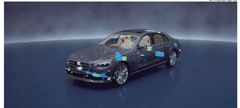
FREIOS, direção, fontes de alimentação e sensores são duplicados para garantir máxima segurança e eficiência no modo de condução autônoma

Após a ativação, o sistema controla a velocidade e a distância, mantendo o veículo em sua própria faixa. Sob certas condições e em seções adequadas nas autoestradas alemãs (Autobahn), os clientes podem entregar a tarefa de conduzir para o sistema ao viajar em tráfego intenso ou engarrafamentos com velocidades de até 60 km/h. No evento improvável de uma falha em um dos sistemas