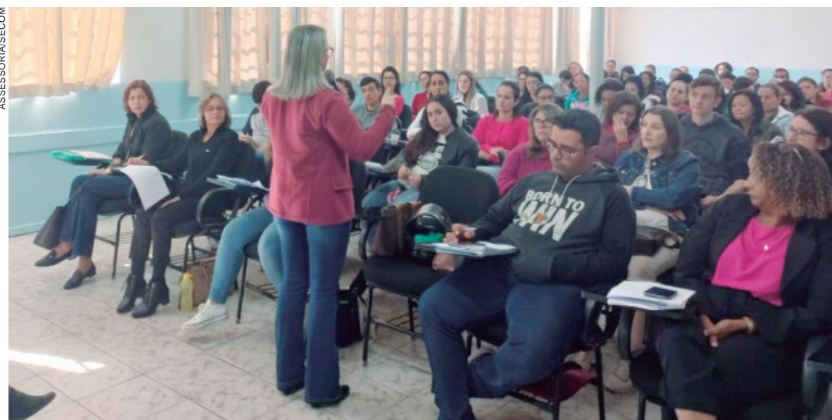
ONTEM foi comemorado o dia do Secretário Escolar e todos os profissionais das 42 instituições de ensino de Umuarama foram parabenizados

agradecimento especial em nome do prefeito Hermes Pimentel. “O secretário escolar é responsável pela vida legal