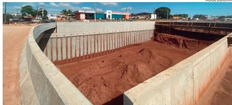
NA altura do Trevo Gauchão, está praticamente concluído um novo viaduto com duas alças. Para a construção da obra de arte, a rodovia foi rebaixada de 7 a 8 metros

Na altura do Trevo Gauchão, que dá acesso à Avenida Dr. Ângelo Moreira da Fonseca, está praticamente concluído um novo viaduto com duas alças. Para a construção da obra de arte, a rodovia foi rebaixada de 7 a 8 metros, preservando o alinhamento e os acessos dos