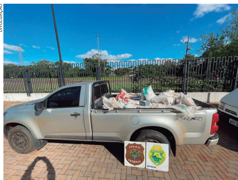
VEÍCULO levado por bandidos em Iporã foi recuperado em um galpão, além de agrotóxicos, armas e munições

Foi necessário o acionamento de um guincho para o transporte da caminhonete e dos agrotóxicos até a base do Nepom (Núcleo Especial de Polícia Marítima) de Guaíra. Posteriormente os agrotóxicos e o veículo foram encaminhados para a Receita Federal. Já as armas e munições foram entregues na Delegacia da Polícia Federal de Guaíra.