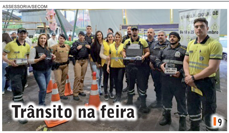
Trânsito na feira