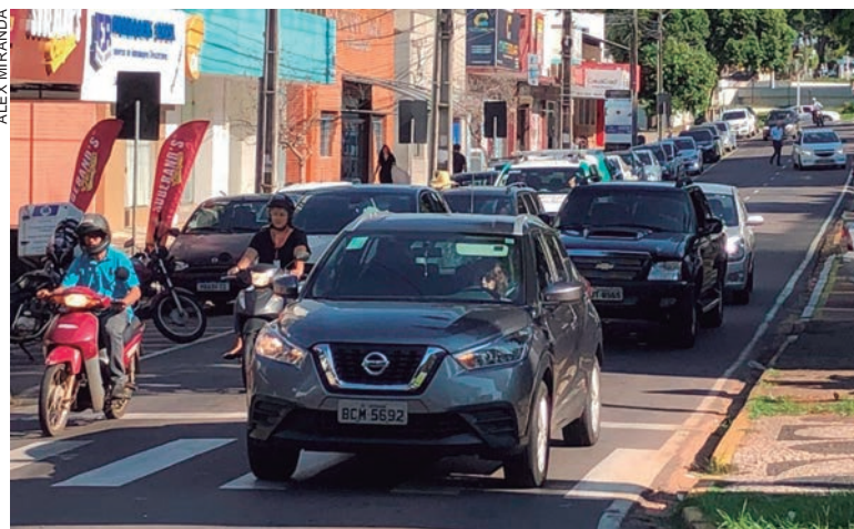
PROGRAMA tem o objetivo de premiar a boa conduta de motoristas que não cometeram infração de trânsito nos últimos 12 meses

As vantagens poderão ser concedidas a partir de 13 de outubro, quando o cadastro será ativado.