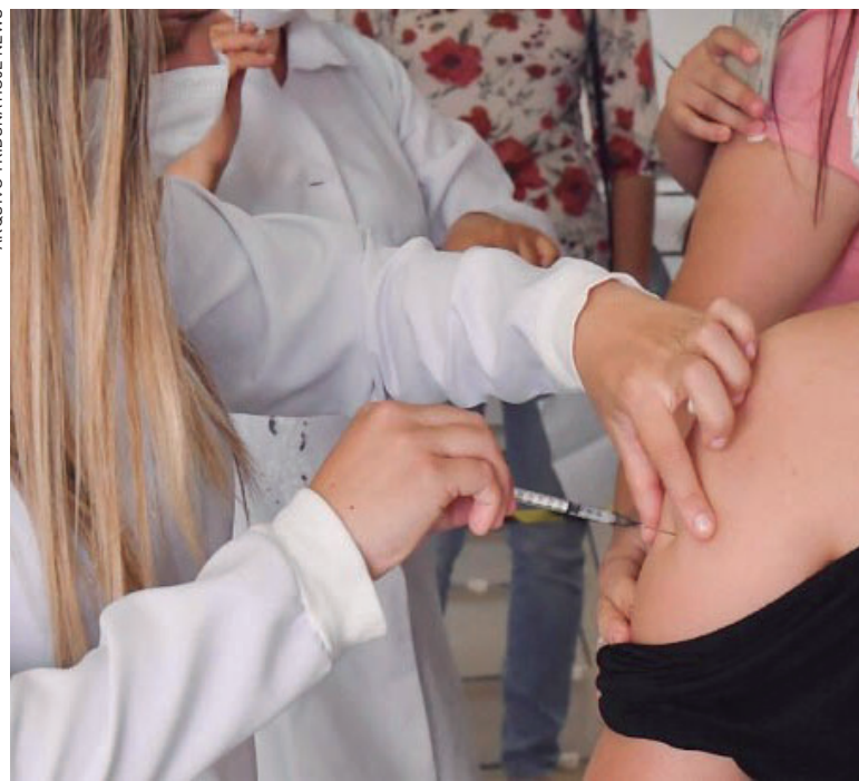
ALÉM desse público-alvo, a 4ª dose também será oferecida aos imunossuprimidos, trabalhadores da saúde e da limpeza urbana e manejo de resíduos sólidos

Ela adianta que também há 3ª dose (ou 1º reforço) para as pessoas acima de 12 anos que fizeram a dose 2 com a Astrazeneca, Coronavac ou Pfizer em 6 de junho ou datas anteriores e também as pessoas que fizeram a dose única de Janssen em 6 de agosto. “Todos os imunizantes vão ficar disponíveis na sede local do Sest Senat, que fica na