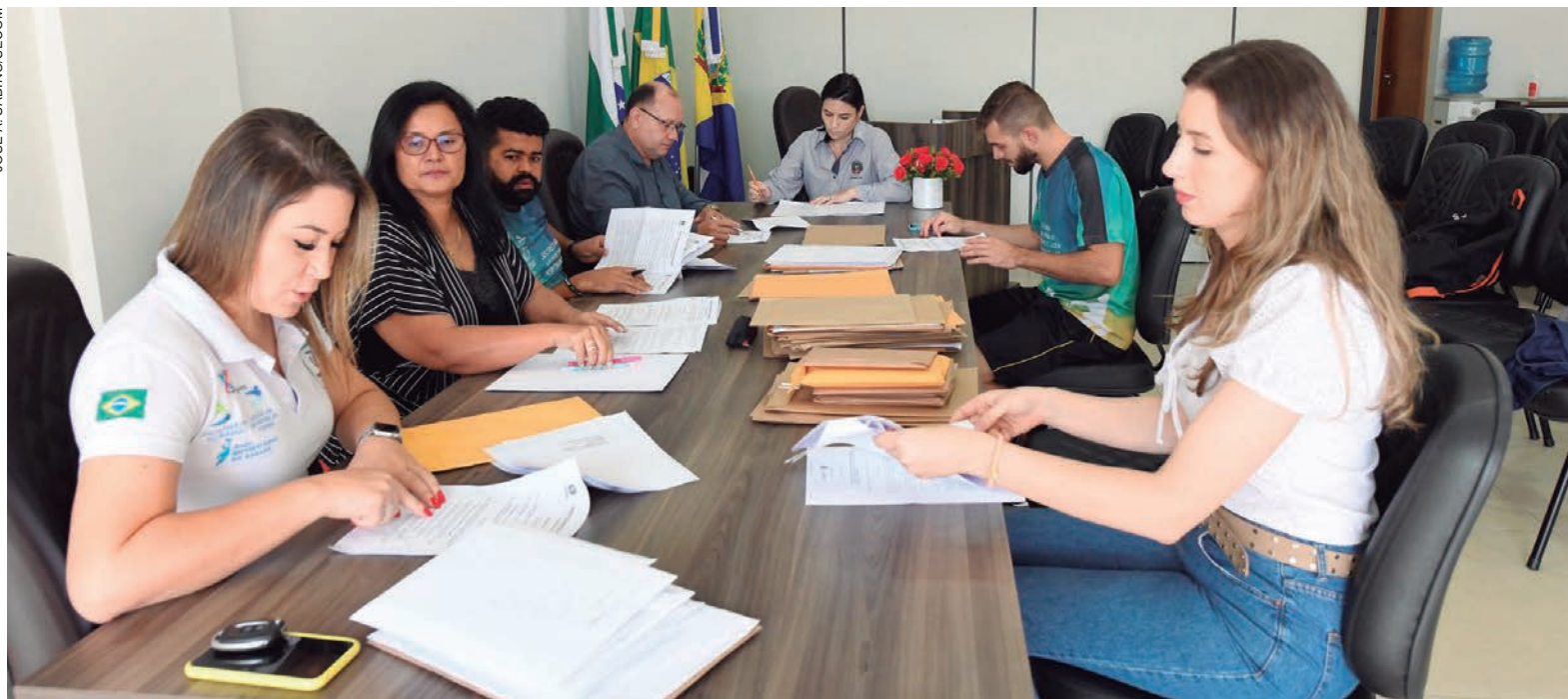
A análise e avaliação técnica devem ser concluídas até o próximo dia 18 e a divulgação das inscrições aprovadas ocorrerá em 20 de outubro