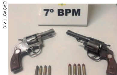
ARMAS usadas pelos bandidos também foram apreendidas, além das cinco prisões concretizadas e a recuperação dos bens levados na ação criminosa

A Polícia Civil investiga se há mais pessoas envolvidas no crime.