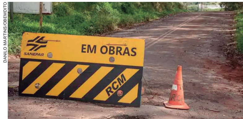
RUAS ficarão interditadas total ou parcialmente entre a Estrada Canelinha e o Conjunto Habitacional São Cristóvão, devido às obras da Sanepar

parcialmente ou totalmente fechada durante as obras. Já a Rua Santo André será totalmente interditada no momento