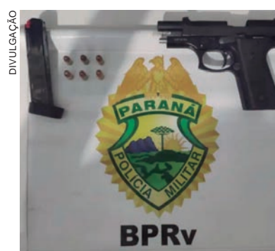
ARMA apreendida estava dentro de uma bolsa de tecido dentro do veículo abordado

O condutor recebeu voz de prisão e foi encaminhado junto com a passageira para a Delegacia de Polícia Civil de Iporã, onde prestarão esclarecimentos sobre o porte ilegal da arma. Conselheiros tutelares foram acionados para acompanhar a situação das crianças que estavam no veículo.