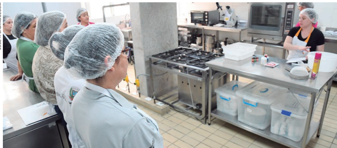
SERÃO cerca de 15 horas de curso, em dois dias, oferecido pela primeira vez no Senac de Umuarama com uma instrutora vinda de Ponta Grossa

Mas o que essa pipoca tem de diferente? São grãos selecionados, que produzem pipocas de ótima qualidade,