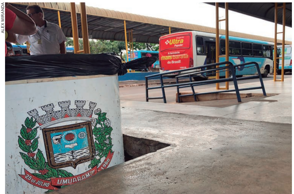
A redução do preço já causou efeito positivo ao longo da semana e já existe uma discussão a respeito de uma eventual ampliação de horários em algumas linhas