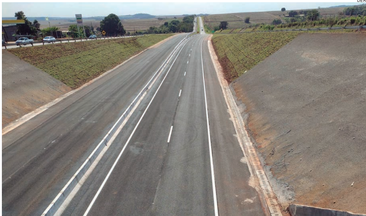
TRECHO faz parte do investimento de mais de R$ 250 milhões, com sua a duplicação em Doutor Camargo e em Umuarama, além de novas terceiras faixas

Para entrega da duplicação deste trecho da PR-323, o DER/PR está finalizando a rotatória