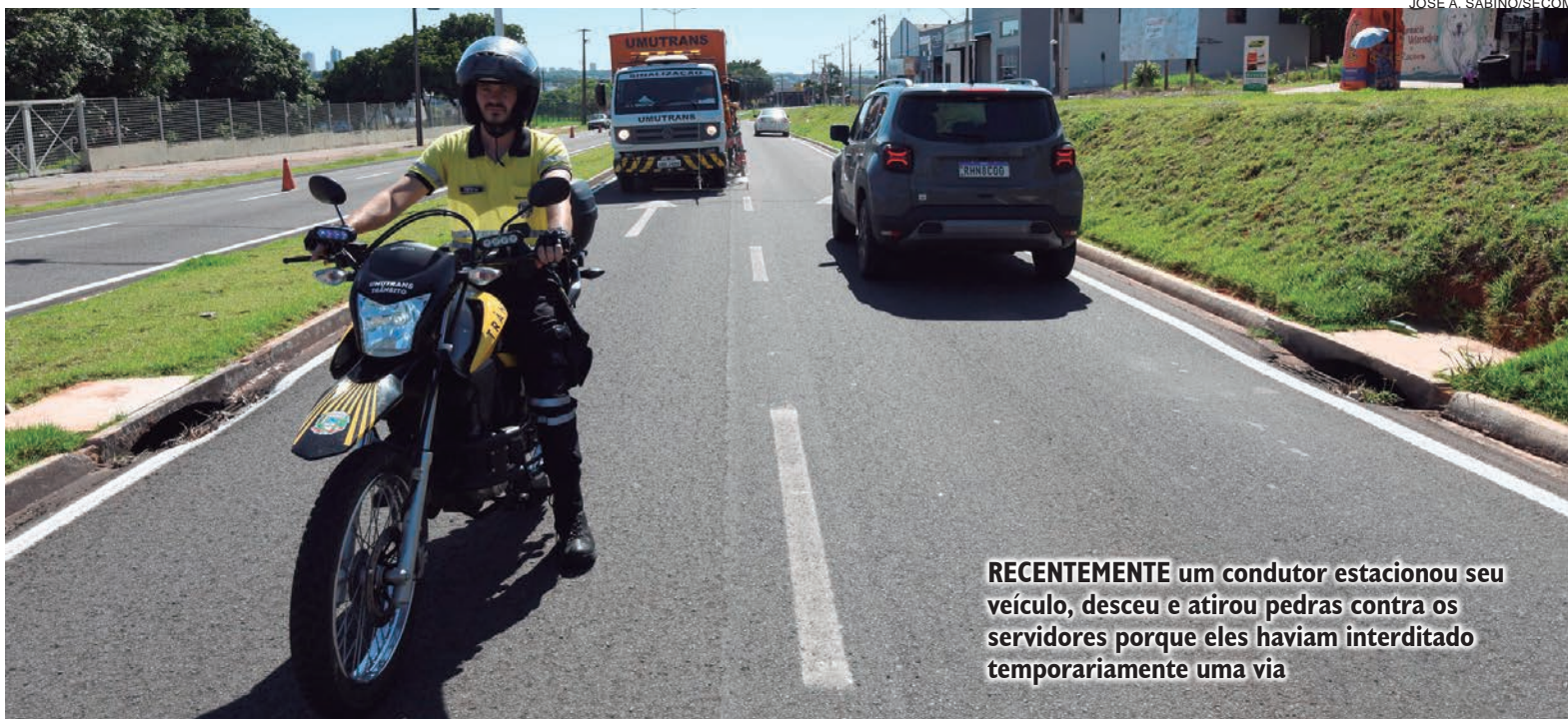
RECENTEMENTE um condutor estacionou seu veículo, desceu e atirou pedras contra os servidores porque eles haviam interditado temporariamente uma via

E este não foi o único caso. Em outra ocasião, os trabalhadores quase foram atropelados. “Os motoristas veem a sinalização de aviso, os cones