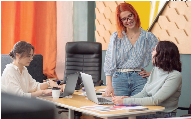
A lei busca incentivar as empresas a divulgar boas práticas organizacionais e as voltadas a promover o equilíbrio entre trabalho e família de seus funcionários

“Estamos avançando na garantia dos direitos das mulheres em todos os espaços e com uma série de medidas e projetos com este objetivo”,