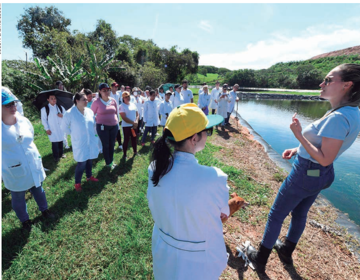
O grupo passou pela célula de orgânicos, lagoas de decantação do chorume gerado na decomposição do lixo, célula de volumosos

célula de orgânicos, lagoas de decantação do chorume gerado na decomposição do lixo, célula de volumosos (móveis velhos, colchões e outros resíduos de maior volume) e também a processadora de resíduos da construção civil, que separa as barras de ferro e produz brita para utilização em estradas rurais. Foram orientados também