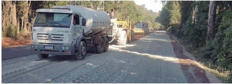
A previsão para o término é março de 2023. Já foram praticamente concluídos 10,89 quilômetros e outros 5,9 estão com obras em execução

A rodovia é um importante corredor de carga para o transporte agrícola do Paraná, que liga a regiões Noroeste e Oeste. O governo estadual está investindo R$ 59.359.057 na obra,