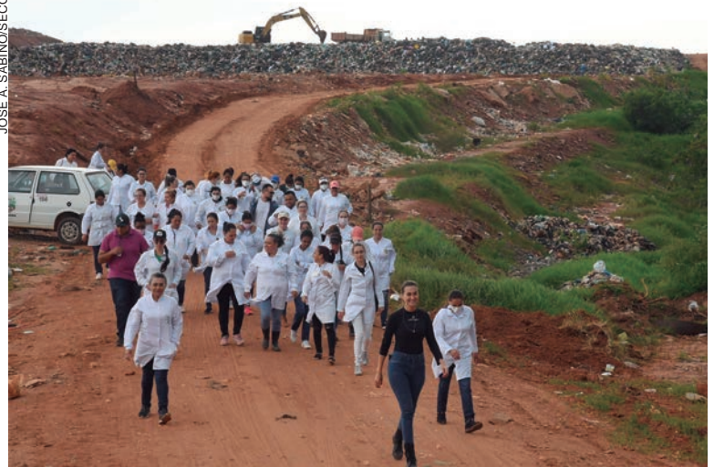
EM Umuarama, a Secretaria do Meio Ambiente preparou uma série de palestras e treinamentos a respeito do tema