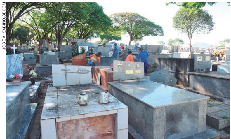
CEMITÉRIO está sendo preparado por equipes da Prefeitura Municipal para receber o público no Dia de Finados