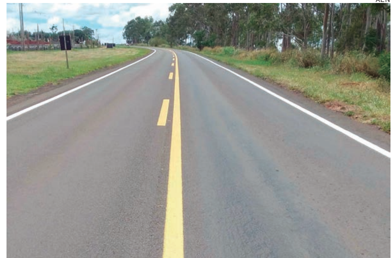
A PR-577 integra o Lote 6 do programa, que abrange 1.590,46 quilômetros da Superintendência Regional Noroeste do DER/PR