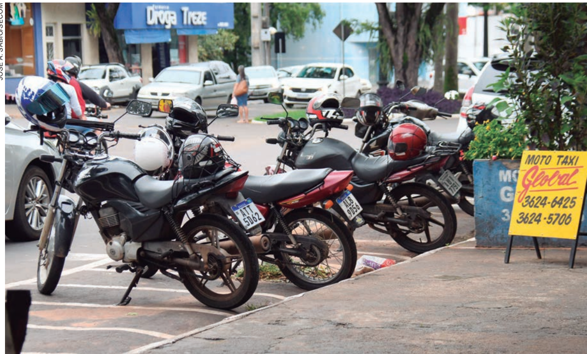
DECRETO deve regulamentar e ajustar uma série de requisitos para oferecer melhores condições de trabalho e mais segurança aos profissionais e usuários

Contendo 24 artigos, a lei determina, entre outros pontos, que a exploração do serviço de mototáxi em Umuarama deve ser feita por profissional que tenha CNH categoria A por, pelo menos, dois anos, possuir certificado