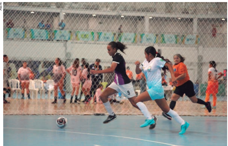
AS meninas do Colégio Estadual Senador Atílio Fontana, de Toledo, passearam na quadra, vencendo Roraima com o placar finalizado em 7 x 2

Vitória também no basquetebol masculino, em que o time de Castro, da Escola Evangélica da Comunidade de Castrolanda, disputou sua primeira partida na competição com o Maranhão e ganhou por 52 x 41.