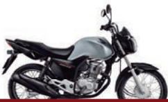
3° Prêmio: Motocicleta CG 160cc START - Ano/Modelo 2022