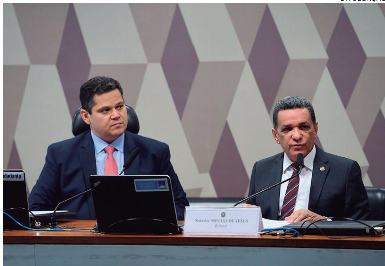
DAVI Alcolumbre, presidente da CCJ, ao lado do relator Mecias de Jesus, durante a reunião da comissão

Por sugestão de três senadores, a área de segurança também deverá receber R$ 100 milhões para a “Promoção da Política Nacional de Justiça”. Valor idêntico deve ir para “Articulação de Política Pública sobre Drogas V”, destinação