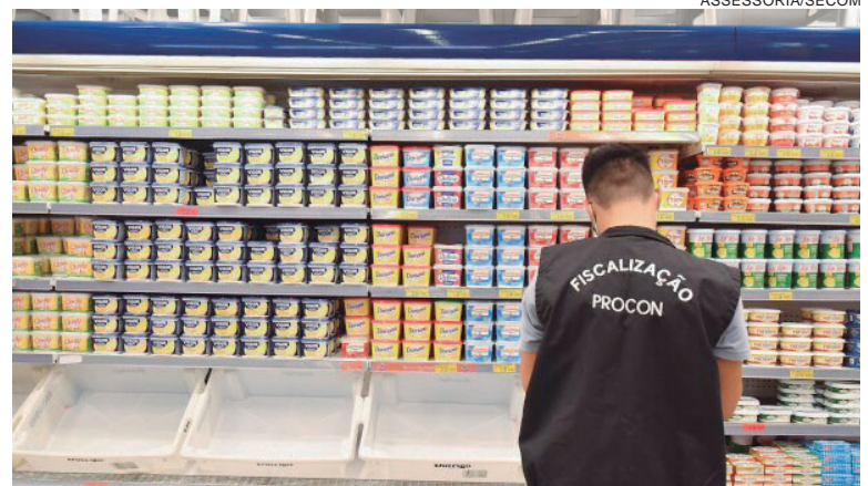
PESQUISAS mostra que os produtos que tiveram maior reajuste de preços foram a batata, a cebola, o extrato de tomate e o creme dental

mais baratas, para quatro pessoas, teve um pequeno aumento de 0,7% - custava em outubro R$ 829,17 e este mês R$ 835,38 – e a com marcas líderes custava R$ 1.076,71 e agora custa R$ 1.083,62 (aumento de 0,6%). “As pesquisas foram feitas entre os dias 6 e 10 de novembro, desta forma, alguns produtos podem apresentar diferenças de preços no momento em que o consumidor for até o supermercado escolhido”, observa Bitencourt.