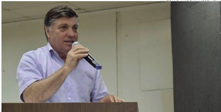
ARQUIVO TRIBUNA HOJE NEWS

A Operação Metástase é conduzida pelo núcleo