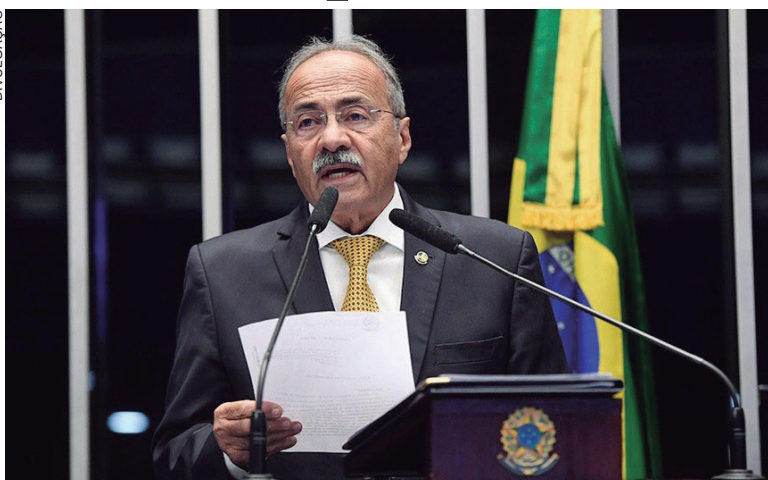
RELATADA pelo senador Chico Rodrigues, a MP que fura o teto de gastos foi aprovada sem alterações e segue para promulgação

Relatada pelo senador Chico Rodrigues (União-RR), a MP foi aprovada sem alterações e segue para promulgação. Em seu relatório,