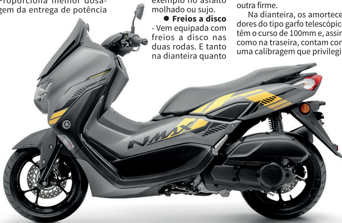
A Yamaha inova mais uma vez com a NMAX Connected 160 ABS, consolidando-se como a mais moderna e completa scooter da categoria

na traseira, os discos têm 230 milímetros de diâmetro e pinças de um pistão, o que garantem à scooter frenagens progressivas e em espaços mais curtos.