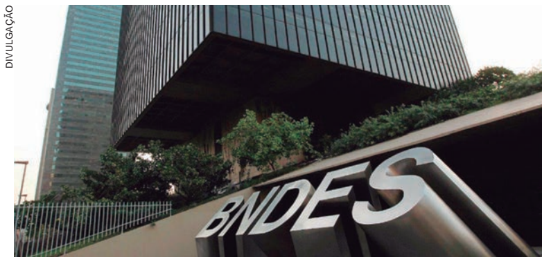
A expectativa é de que, pelo menos, 30 mil pessoas sejam capacitadas até 2025, com foco em mulheres, pretos, pardos e jovens empreendedores

Os conteúdos da plataforma direcionados aos empreendedores estão organizados em séries completas que abordam temas determinados