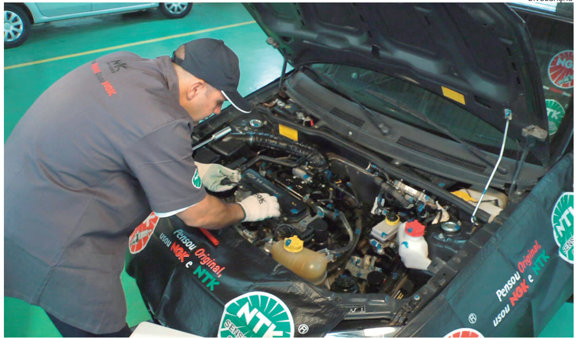
AS adequações mais comuns em carros para PCDs incluem o uso de direção assistida (elétrica ou hidráulica) e transmissão automática ou automatizada

A manutenção de um carro para PCDs segue o mesmo padrão de outras vistorias. Os veículos devem prioritariamente realizar a manutenção preventiva com peças de qualidade para evitar momentos indesejados durante o uso.