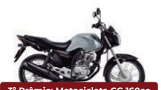
3º Prêmio: Motocicleta CG 160cc START - Ano/Modelo 2022