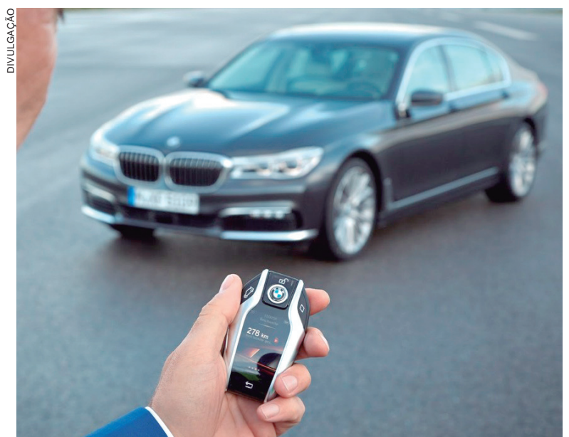
SISTEMA oferece garantia que vai além do travamento das portas

O sistema começou a ser implementado em novembro. No primeiro momento, é dedicado exclusivamente aos clientes compradores de veículos e blindagens. A venda ao público em geral terá início a partir de 2023.