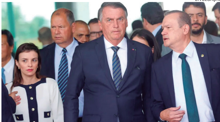
A alegação é de que houve “desconformidades irreparáveis de mau funcionamento” nos modelos UE2009, UE2010, UE2011, UE2013 e UE2015 nas eleições de 2022

“Todas as urnas dos modelos de fabricação UE2009, UE2010, UE2011, UE2013 e UE2015 apontaram um número idêntico de LOG, quando, na verdade, deveriam apresentar um número individualizado de