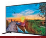
4º Prêmio: Televisor 43'