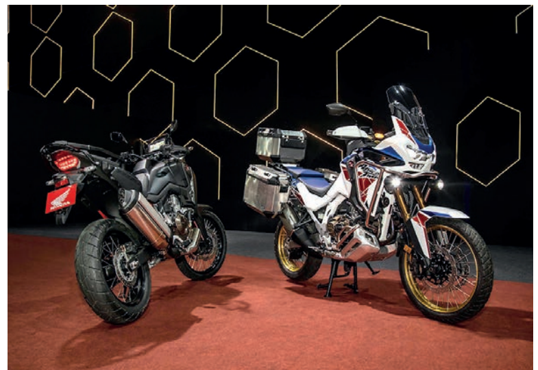
REFERÊNCIA mundial quando o assunto é motocicleta aventureira, a Honda CRF 1100L Africa Twin chega a sua versão 2023 no auge

O impactante estilo das Honda CRF 1100L Africa Twin ganhou força com novos grafismos e cores inéditas, que identificarão de forma inequívoca as versões 2023 do modelo, que permanecerá sendo oferecido com duas versões: Africa Twin (tanque de 18,8 litros) e