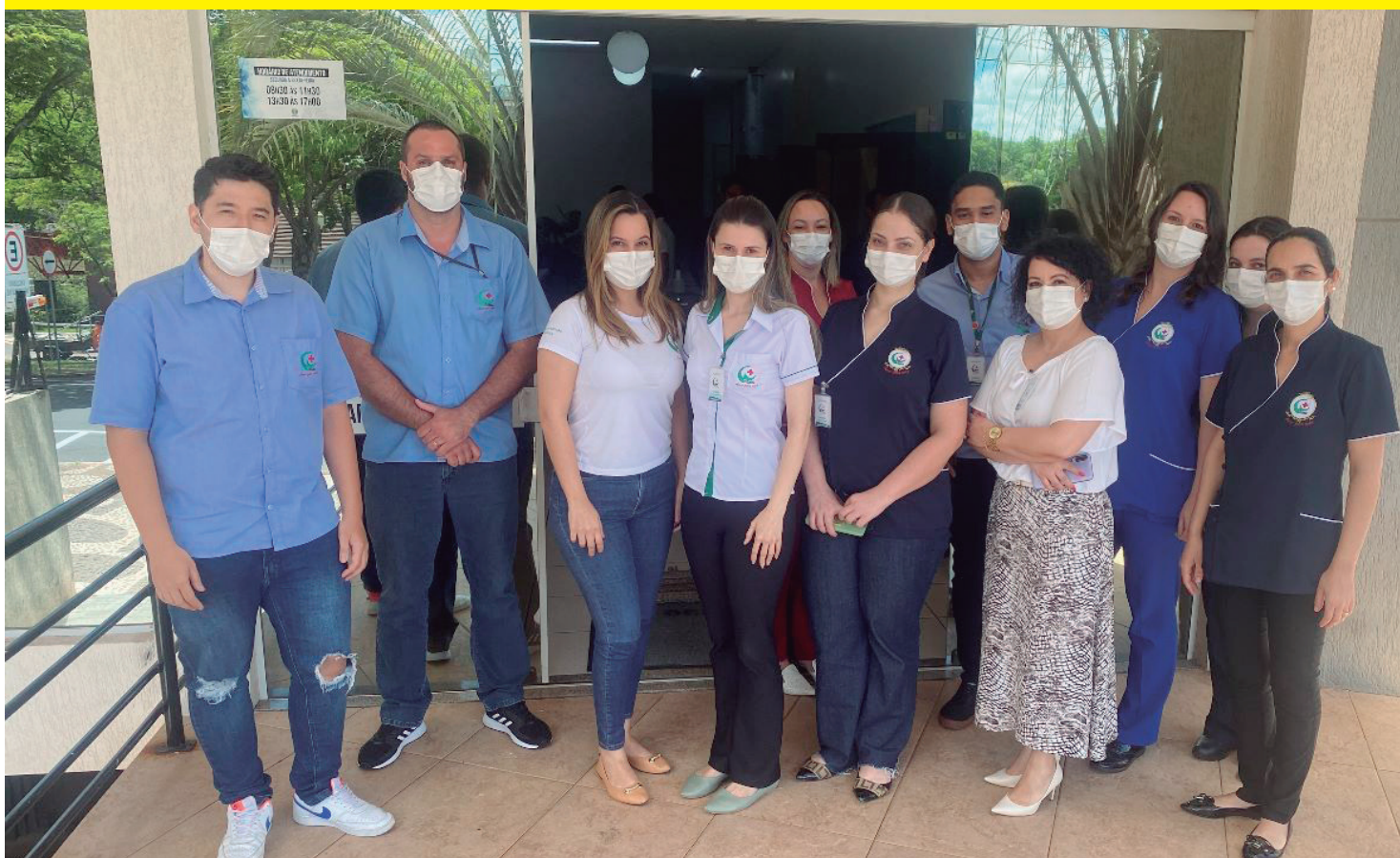
Equipe Hospital Cemil