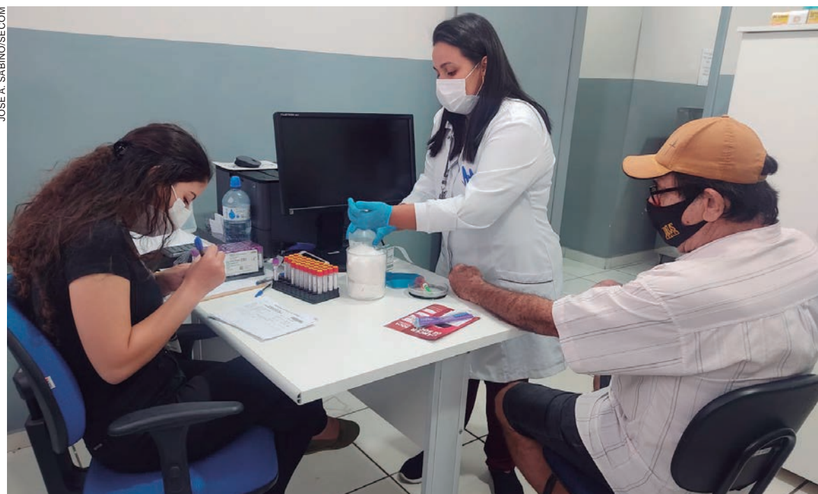
AS ações foram responsáveis por levar 2,5 mil pacientes a realizar exames de PSA, mais de 300 de toque e apresentar palestras informativas a quase mil homens

O câncer de próstata é o tipo mais comum entre a população masculina, representando 29% dos diagnósticos da doença no País. São 65.840 novos casos a cada ano, entre 2020 e 2022. Homens com mais de 55 anos, com excesso de peso e obesidade, estão mais propensos à doença. “O bom é saber que a chance de cura da doença chega a 90% caso o tumor seja diagnosticado logo no início. A estimativa do INCA (Instituto Nacional do Câncer) é que ocorram 1.130 novos casos da doença neste ano. Os