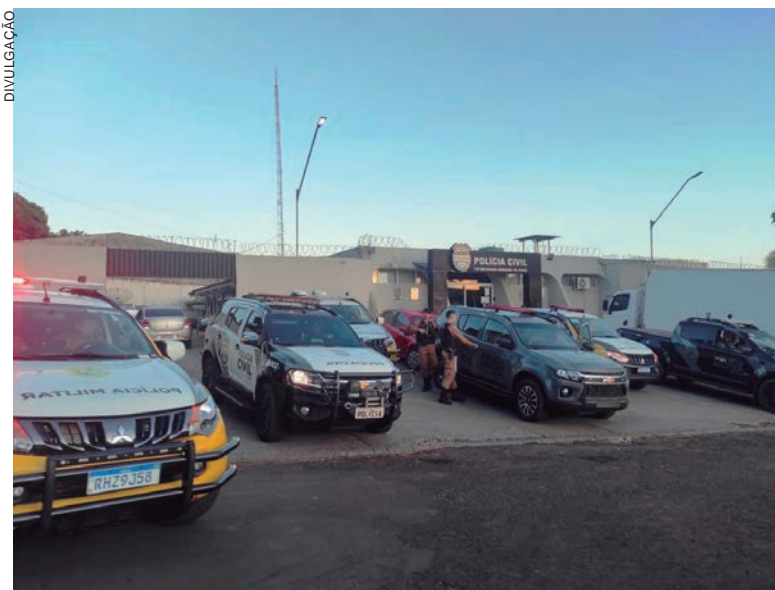
OPERAÇÃO foi desencadeada por investigadores e policiais militares na cidade de Cafezal do Sul e todos os presos foram levados à delegacia de Iporã

Ainda de acordo com o delegado, os jovens torturados e que teriam sido os autores do roubo que levou à ação dos populares, já foram presos