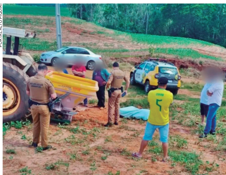
CORPO do homem foi prensado pelo equipamento que pesa cerca de 800 quilos

A Polícia Militar esteve na propriedade rural e solicitou a presença dos demais órgãos