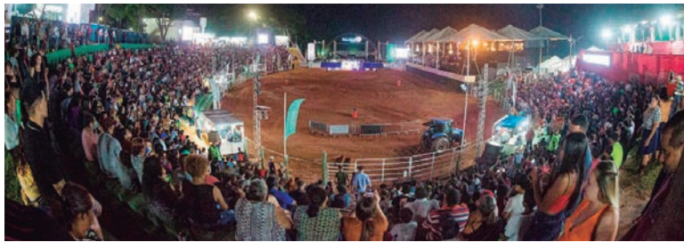
A arena do Parque de Exposições Dario Pimenta da Nóbrega terá esta nova atração na próxima Expo Umuarama

Elevado a esporte, o rodeio segue como a principal modalidade brasileira no quantitativo de público. Atrai mais gente que o próprio futebol. São várias competições em praticamente todo o país, uma verdadeira paixão nacional, que assim como a corrida para colocar a bola dentro do gol, ganhou ares de superestrutura.