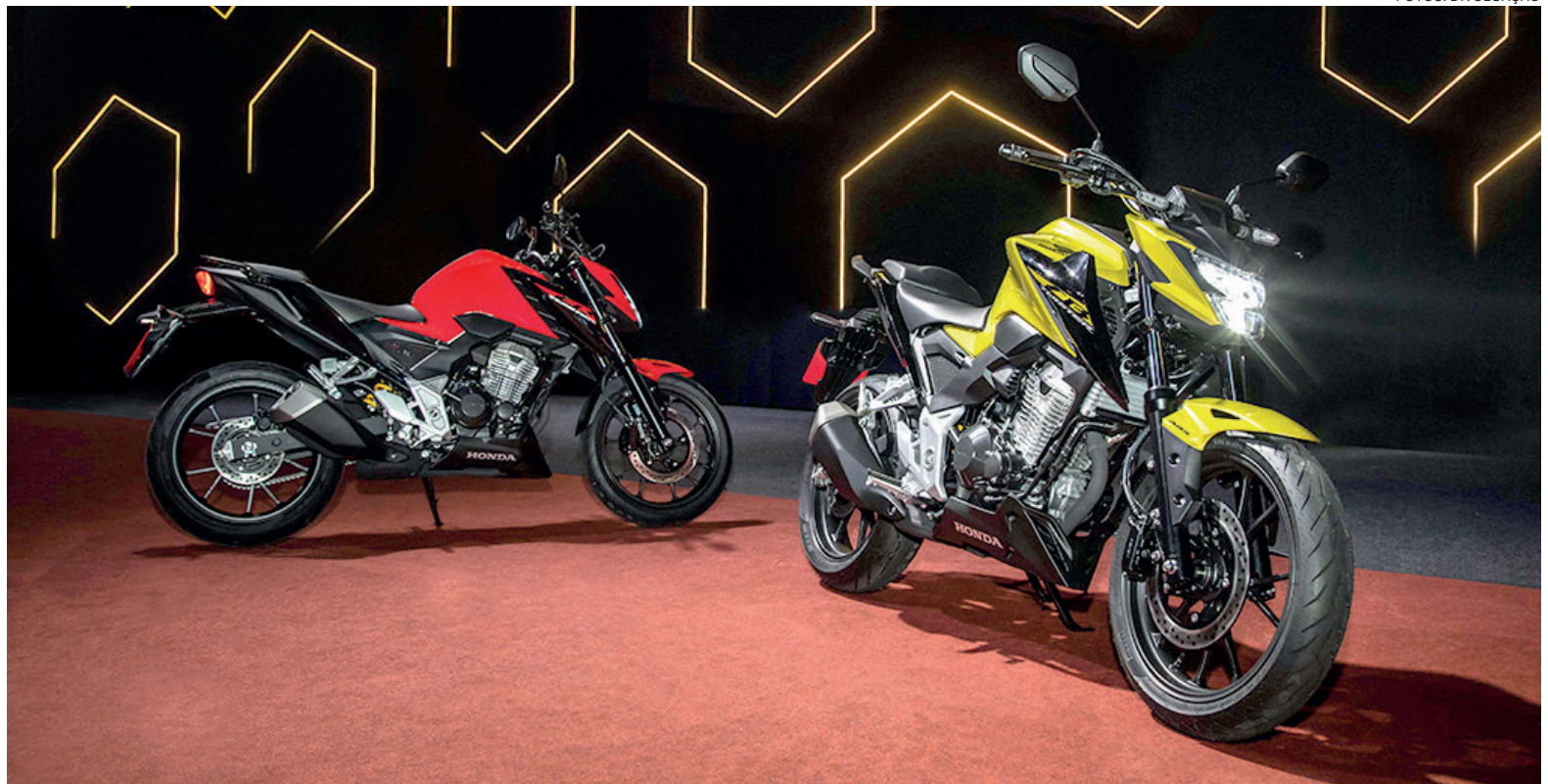
O nome, "Twister", é bem conhecido, sinônimo de moto robusta, econômica, confiável e de excelente desempenho

O nome, "Twister", é bem conhecido, sinônimo de moto robusta, econômica, confiável e de excelente desempenho. Tal herança está totalmente presente na nova Honda CB 300F Twister 2023, que se destaca pela agressividade, potência e esportividade. Para além do evidente progresso em termos de performance proporcionado pelo novo motor, a CB 300F Twister representa