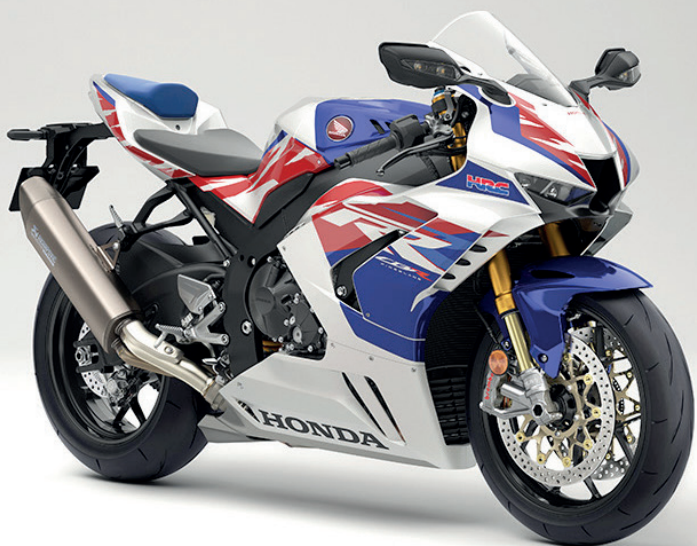
EM termos de estilo, serão duas as opções disponíveis na Honda CBR 1000RR-R Fireblade SP 2023: a "Grand Prix Red" e a "30th Anniversary Edition"

Em termos de estilo, serão duas as opções disponíveis na Honda CBR 1000RR-R Fireblade SP 2023: a "Grand Prix Red", com esquema de cor e grafismos que remete às Fireblade usadas no Mundial de Superbike pela equipe HRC e a "30th Anniversary Edition", inspirada na 1ª Fireblade de 1992, versão está numerada e com selo comemorativo aplicado no tanque, chave, painel e escapamento.