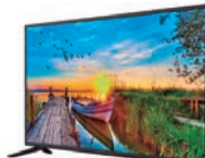
4º Prêmio: Televisor 43'