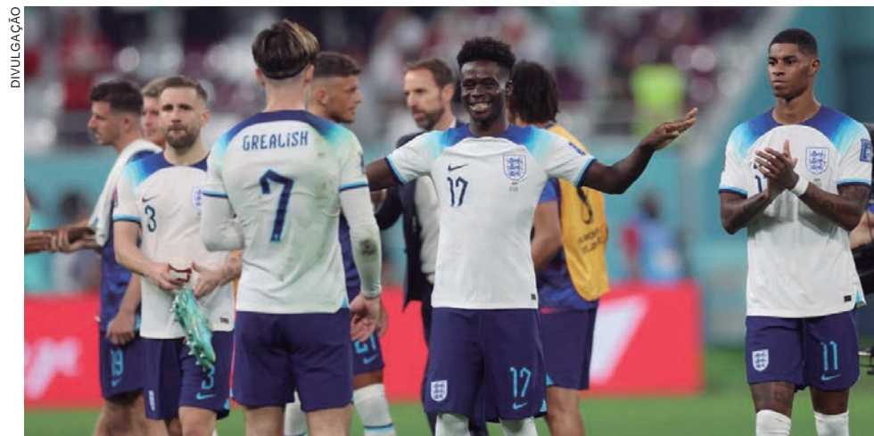
DUELO no Al Rayyan abriu as partidas pelo Grupo B na Copa do Catar, e teve arbitragem brasileira

Alguns torcedores (de ambos os sexos) nas arquibancadas ergueram cartazes exigindo liberdade ao direito