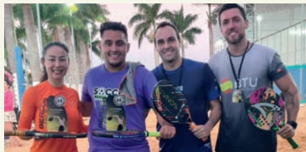
CLASSE OPEN BEACH TÊNIS CAMPEÕES: SONY/TORRONE FINALISTAS: RAFA/MARCOS