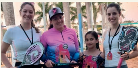
CLASSE B FEMININA BEACH TENNIS CAMPEÃS: MICHELE/SIMEIRE FINALISTAS: GABI/ FER ACOSTA