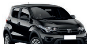
2º Prêmio: Fiat Mobi EASY 1.0 FLEX MANUAL, Ano 2021, Modelo 2022