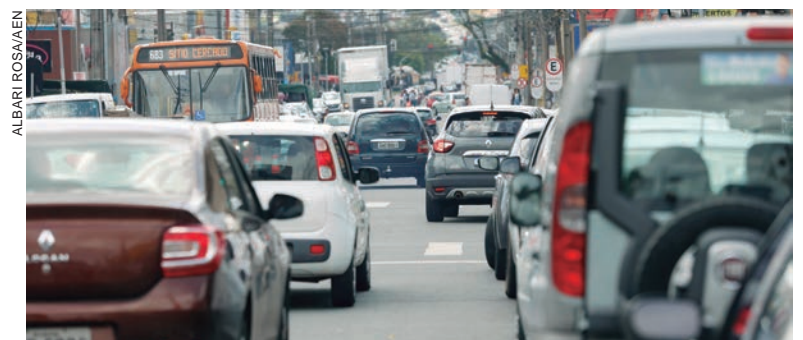
O crédito gerado pode ser utilizado para pagar o IPVA em sua integralidade ou em parte, caso o recurso não seja suficiente para cobrir o valor total

O crédito gerado pode ser utilizado para pagar o IPVA em sua integralidade ou em