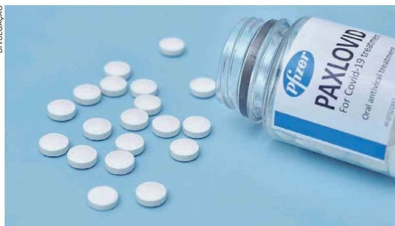
MEDICAMENTO poderá ser comercializado em farmácias com prescrição médica e também por hospitais particulares

Nas farmácias, é necessária uma prescrição médica (receita). O Paxlovid, porém, estará com bula e rotulagem