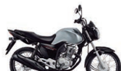
3º Prêmio: Motocicleta CG 160cc START - Ano/Modelo 2022