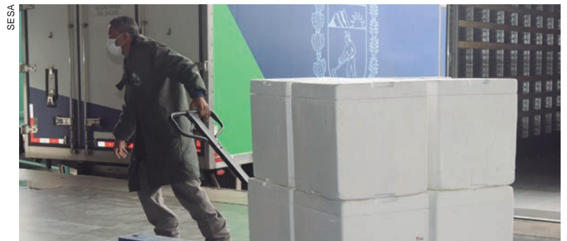
A remessa desembarcou no Aeroporto Internacional Afonso Pena, em São José dos Pinhais, Região Metropolitana de Curitiba, no período da manhã

“Esse quantitativo de doses atende às solicitações dos municípios feitas na semana passada. Assim que descentralizadas, as