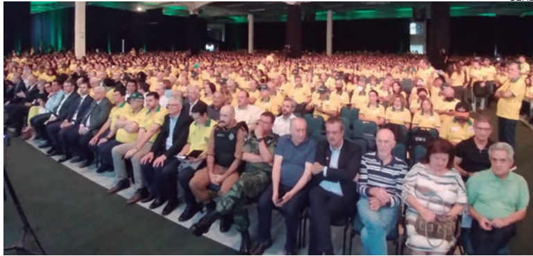
O Encontro Estadual de Líderes Rurais visa estimular os sindicatos e encontrarem soluções para ampliar o número de associados e de garantir sua autonomia

“Estamos preocupados em fazer com que haja água para todos os empreendimentos