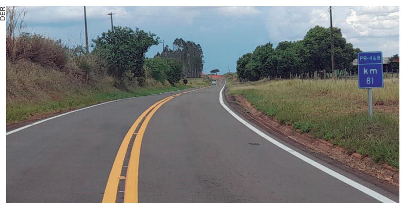
TRECHO sinalizado fica entre Umuarama e o entroncamento com a PRC-272, no território de Goioerê e passa também pelos municípios de Mariluz e Moreira Sales

As melhorias na PR-468 vão beneficiar mais de 135 mil habitantes através do Programa de Segurança Viária das Rodovias Estaduais (Proseg Paraná), que tem como objetivo diminuir o número de mortes nas estradas. A