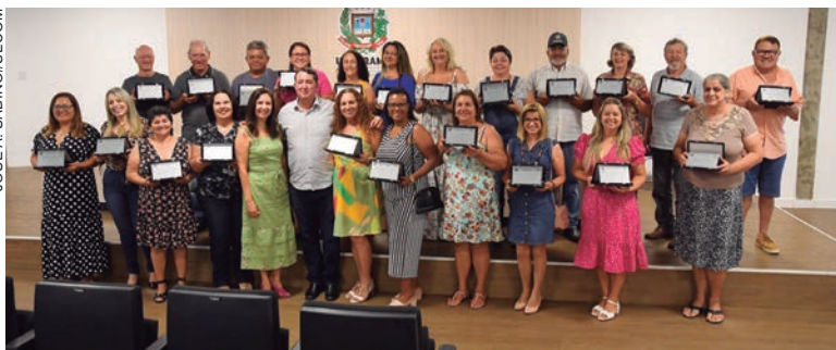
CONQUISTARAM o benefício da aposentadoria professores, auxiliares, vigias, serventes gerais, auxiliar administrativa, gari, motorista e uma auxiliar de enfermagem

“Todos vocês, com toda certeza, têm grandes histórias de luta para contar, muitas que até nos faria chorar,